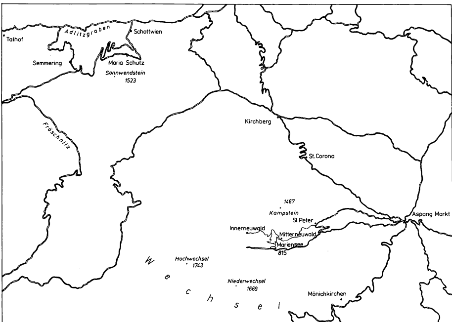
Abb. 1: Lage der Untersuchungsgebiete

Ein gewisser kontinentaler Einschlag des Klimas spiegelt sich auch in den Temperaturverhältnissen wider. So liegen die mittleren Jahresschwankungen der Temperaturen beträchtlich über den Werten vergleichbarer Höhenlagen in den herzynischen Mittelgebirgen des Harzes, Thüringer Waldes und Erzgebirges.