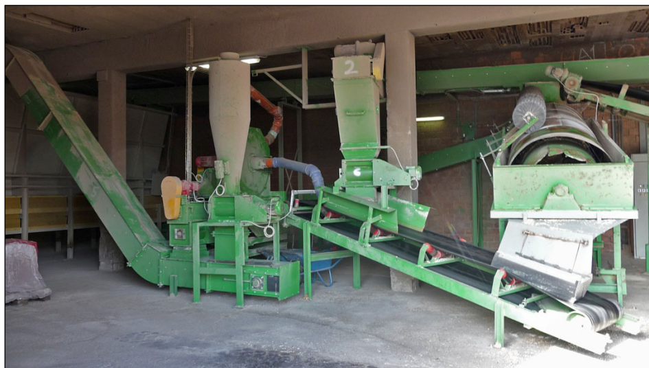
Abbildung 4: Drehsiebe und Häcksler zur Aufbereitung der Sägespäne (© Verband österreichischer Ziegelwerke).

Analysen der Sägespäne erfolgen etwa zweimal pro Jahr bzw. bei Bedarf. Dabei werden vor allem die Parameter Korngrößenverteilung, Wassergehalt, Schüttgewicht und fallweise Heizwert bzw. Chlorid erfasst. Die Analysen werden intern durchgeführt.