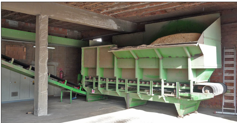
Abbildung 3: Sägespäne.

Die Anlieferung der Sägespäne erfolgt ausschließlich per Lkw. Im Werk werden durchschnittlich Sägespäne für eine Wochenproduktion auf Lager gehalten.