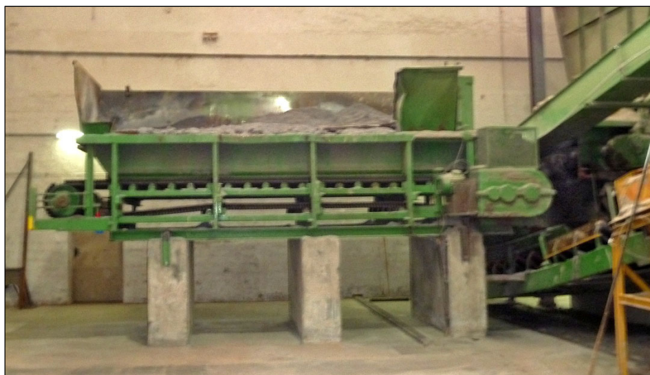
Abbildung 5: Papierfangstoff.

Die Anlieferung des für die Ziegelherstellung eingesetzten Papierfangstoffs erfolgt täglich. Durch die mit Papierfangstoff verbundenen Geruchsprobleme wird versucht, nur eine geringe Menge (ungefähr den Bedarf für ein bis zwei Tage) auf Lager zu halten. Der im Werk verarbeitete Papierfangstoff stammt von einem einzigen Lieferanten und wird ohne Vorbehandlung im Anlieferungszustand (mechanisch entwässert, ca. 40–50 % Feuchtigkeit) eingesetzt.