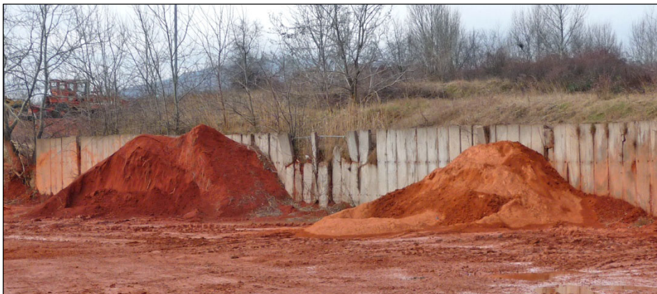
Abbildung 6: Gelagertes Tennismehl.

Das während des Brennens gebrochene Material wird an der nachfolgenden Entladestation ausgesondert. Dieses wird in die Produktionsanlage für Tennismehl übergeführt. Die Produktion von Tennismehl aus dem Eigenbruch und dem angelieferten Klinkerbruch erfolgt betriebsintern mittels Prall- und Turbomühlen. Der Tennissand wird in Säcken oder offen weiter verkauft.