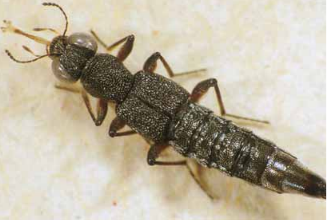
Abb. 1: Stenus providedus ERICHSON mit vorgestülpter Unterlippe (Länge 5,3 mm).

Zur Abwehr gegen andere Räuber besitzen die Kurzflügelkäfer Giftdrüsen am Körperende. Bei Beunruhigung wird das biegsame Abdomen S-förmig erhoben, nach vorne gerichtet und das Abwehrsekret gezielt versprüht. Die bunten Arten der Gattung Paederus signalisieren durch ihre auffallend schwarz-rotgelbe Färbung ihre besondere Giftigkeit (Abb. 5).