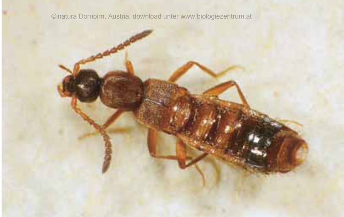
Abb. 3: Drusilla canaliculata FABRICIUS (Länge 4,9 mm)