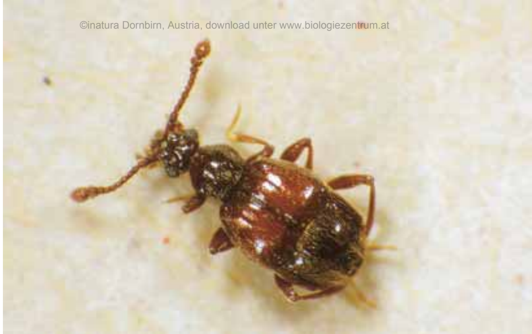
Abb. 2: Brachygluta narentina klimschi . HOLDHAUS (Länge 1,9 mm)