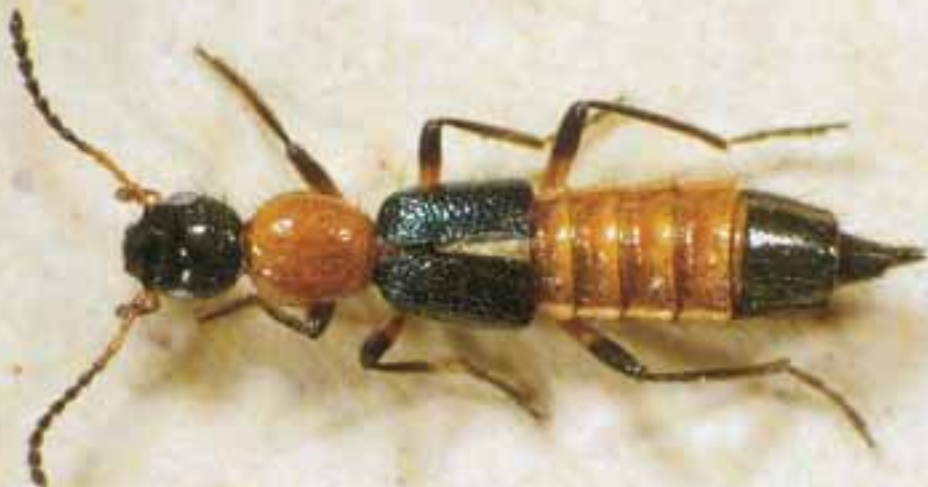
Abb. 5: Paederus limophilus HEER (Länge 6,7 mm)

Röhrichten und Gehölzen geeignete Lebensbedingungen, die von kleinen Bächen und Gräben durchflossen werden und daher für ripicole Arten attraktiv sind.