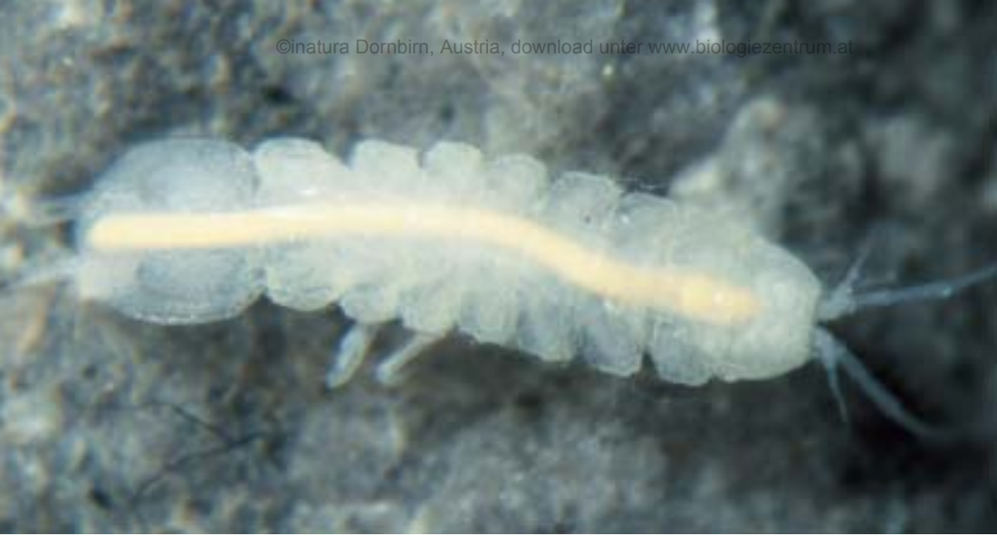
Abb. 5: Proasellus cavaticus , ♀: Große Baschghöhle, 26.4.92, Körperlänge 4 mm

Crustacea (Krebstiere): (Abb. 5 – 7). BREUSS (1995), JANETSCHKE (1952)