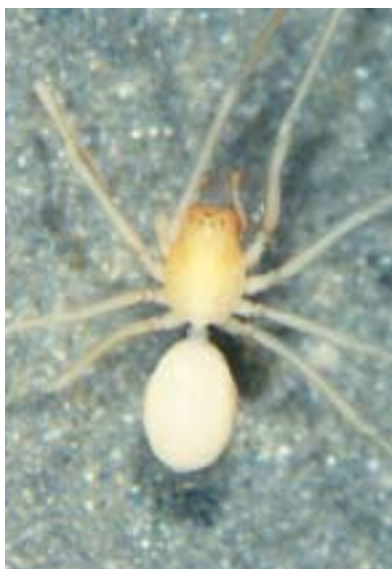
Abb. 2: Meta menardi , ♀: Große Baschghöhle, 25.12.92, Körperlänge ca. 17 mm