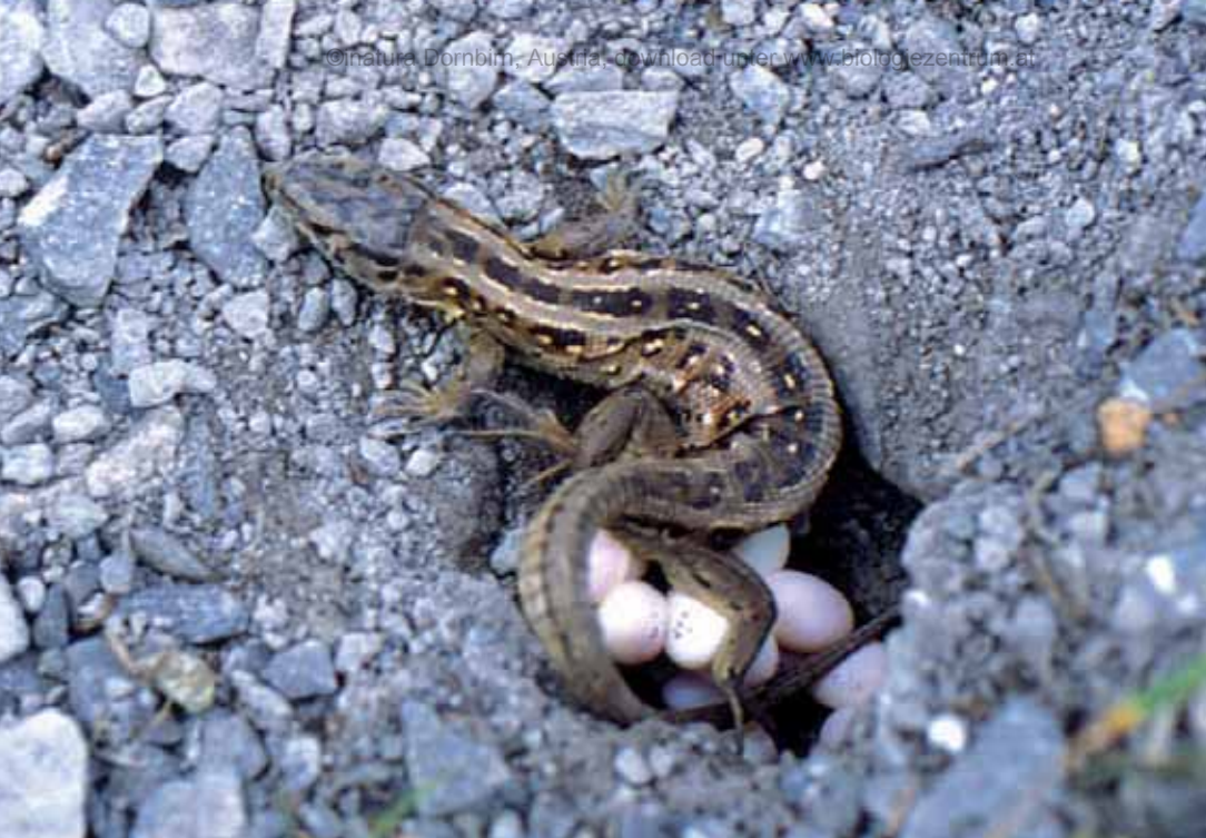
Abb. 12: In Gsieg – Obere Mähder besiedelt die Zauneidechse ( Lacerta agilis ) sonnenexponierte Böschungen (ALGE 1999e). Im Juni oder Juli vergraben Zauneidechsenweibchen ihr Gelege, das meist zwischen fünf und neun Eier umfasst, im Boden. Nach ein bis zwei Monaten schlüpfen etwa 5 cm lange Jungtiere (BLANKE 2004).

Kleingewässer, wie die Teiche in Obere Mähder, sind charakteristische Landschaftsstrukturen in Feuchtgebieten und wertvolle Lebensräume für zahlreiche Wirbellose (vgl. WUST & ALGE 1999). Bis heute wurden drei Muschel- und drei Wasserschneckenarten beobachtet. Unter den Landschnecken ist das Vorkommen mehrerer seltener Windelschneckenarten bemerkenswert. Mit insgesamt 40 Arten kommen rund 10 % der in Österreich bisher bekannten Mollusken im Naturschutzgebiet Gsieg – Obere Mähder vor, davon gilt mehr als die Hälfte in Vorarlberg als gefährdet oder zumindest potenziell gefährdet (STUMMER & ALGE 1999). Eine systematische Erhebungen der Molluskenfauna steht allerdings noch aus.