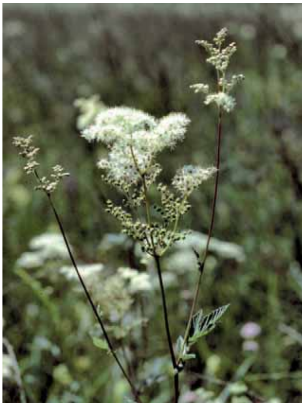
Abb. 19: Das Mädesüß ( Filipendula ulmaria ) wächst an feuchten Standorten mit guter Nährstoffversorgung.

Hochstaudenfluren entwickeln sich auf feuchten und nährstoffreichen Standorten. Im Gebiet kommt dieser Lebensraumtyp vor allem auf ehemals gedüngten Wiesen in den Oberen Mähdern vor, die jetzt wieder extensiv als Streuwiesen genutzt werden. Pflanzensoziologisch entsprechen die Bestände der Baldrian-Mädesüß-Flur ( Valeriano officinalis - Filipenduletum ), die vom Mädesüß ( Filipendula ulmaria ) und weiteren Hochstauden wie Waldengelwurz ( Angelica sylvestris ) und Gilbweiderich ( Lysimachia vulgaris ) dominiert werden. Auch wenn kaum gefährdete Pflanzenarten auftreten, sind die Lebensräume für die Tierwelt von großer Bedeutung. Insgesamt nimmt der Lebensraumtyp 6430 eine Fläche von 5,1 ha ein.