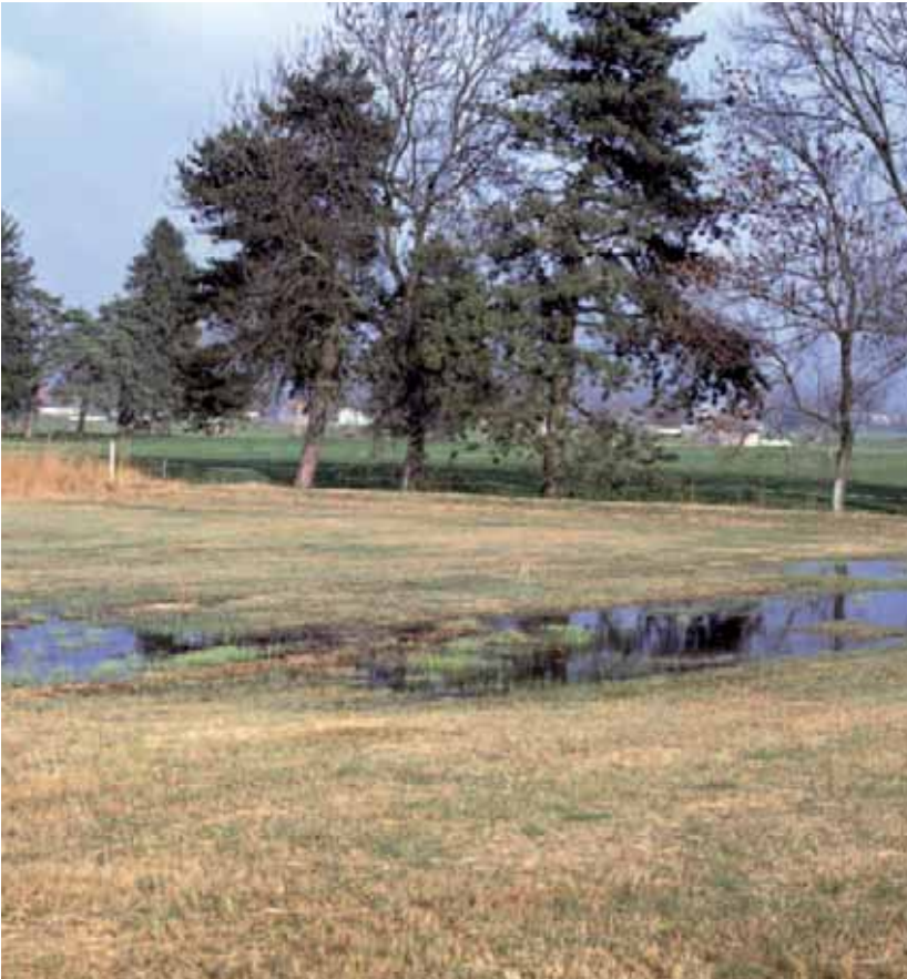
Abb. 11: Temporärer Tümpel im südlichen Gsieg. Gewässer sind wertvolle Lebensräume für zahlreiche wirbellose Tiere.