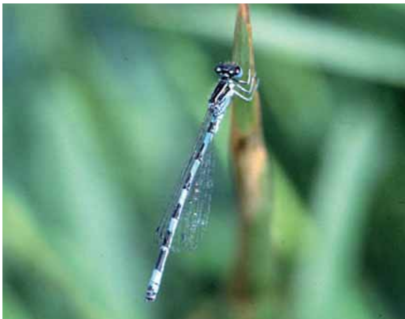
Abb. 26: In Österreich sind nur zwei aktuelle, bodenständige Vorkommen der Helmazurjungfer ( Coenagrion mercuriale ) bekannt – beide aus Vorarlberg (Andelsbuch und Nenzing). Zudem wurden Einzeltiere dieser vom Aussterben bedrohten Art im Natura 2000-Gebiet Gsieg – Obere Mähder und am Alten Rhein in Hohenems beobachtet (RAAB et al. 2006).

Aus dem Natura 2000-Gebiet Gsieg – Obere Mähder ist derzeit ein Einzelfund bekannt, wahrscheinlich ist die Art nur Gast im Gebiet (HÄMMERLE 2007). Potenzielle Gefährdungsfaktoren sind Austrocknung der Fortpflanzungsgewässer, zunehmende Beschattung der Gewässer, Grabenräumung oder Beeinträchtigung der Wasserqualität (PETERSEN et al. 2003).