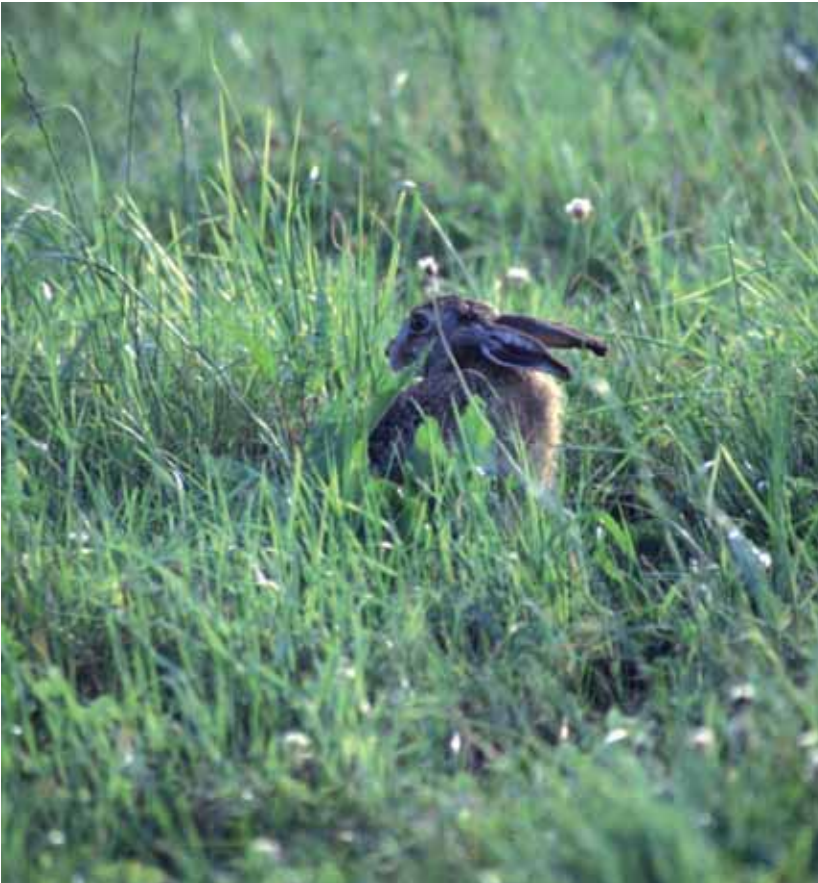
Abb. 14: Der Feldhase ( Lepus europaeus ) ist eine Indikatorart für die offene, strukturreiche Kulturlandschaft. Die Feldhasenbestände im Alpenrheintal wurden in einem grenzüberschreitenden Projekt erhoben. Auf Vorarlberger Seite ist die Feldhasendichte höher als in der benachbarten Schweiz (HOLZGANG & PFISTER 2003)