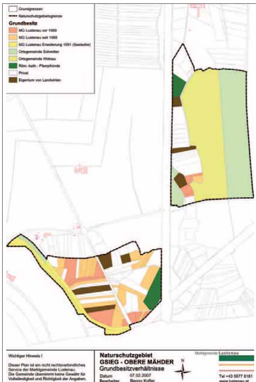
Abb. 2: Grundeigentumsverhältnisse im Naturschutzgebiet Gsieg – Obere Mähder

44 % des Gebietes sind Eigentum der beiden Schweizer Ortsgemeinden Widnau und Schmitter. Die Marktgemeinde Lustenau hält mit 23 % den größten Besitzanteil im Gebiet, der durch die Schutzgebietserweiterung Seelache um 3,97 ha und die Ablöse von über 7 ha privaten Grundflächen laufend erhöht wurde. Somit befinden sich mittlerweile über zwei Drittel der Grundstücke in öffentlichem oder halböffentlichem Eigentum; mit den Pfarrpfünden sind es sogar 72 %. Von den gut 28 % Privatbesitz sind nur 4 % bäuerliches Eigentum.