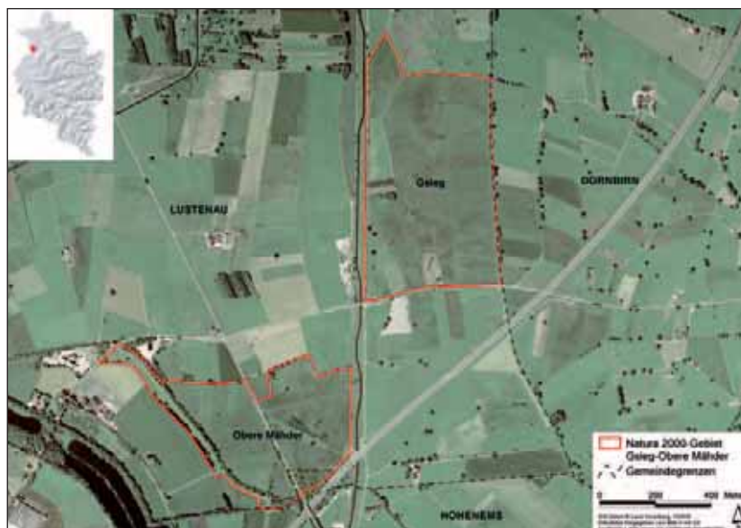
Abb. 1: Das Natura 2000-Gebiet Gsieg – Obere Mähder im Gemeindegebiet von Lustenau umfasst 73 ha und besteht aus zwei Teilgebieten: Gsieg mit 43 ha liegt östlich des Rheintal-Binnenkanals an der Gemeindegrenze zu Dornbirn, Obere Mähder mit 30 ha befindet sich westlich des Rheintal-Binnenkanals an der Gemeindegrenze zu Hohenems. Die stark frequentierte Landesstraße L 203 (Hohenemser Straße) trennt die beiden Teilgebiete (ALGE 1999b).