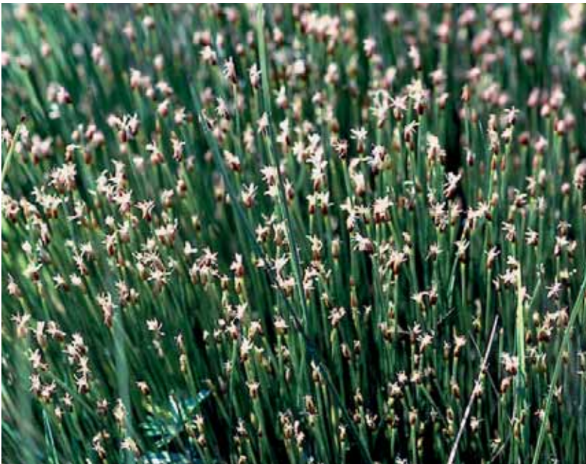
Abb. 17: Pfeifengraswiesen – hier mit Duftlauch ( Allium suaveolens ) – sind der dominierende FFH-Lebensraumtyp im Natura 2000-Gebiet Gsieg – Obere Mähder