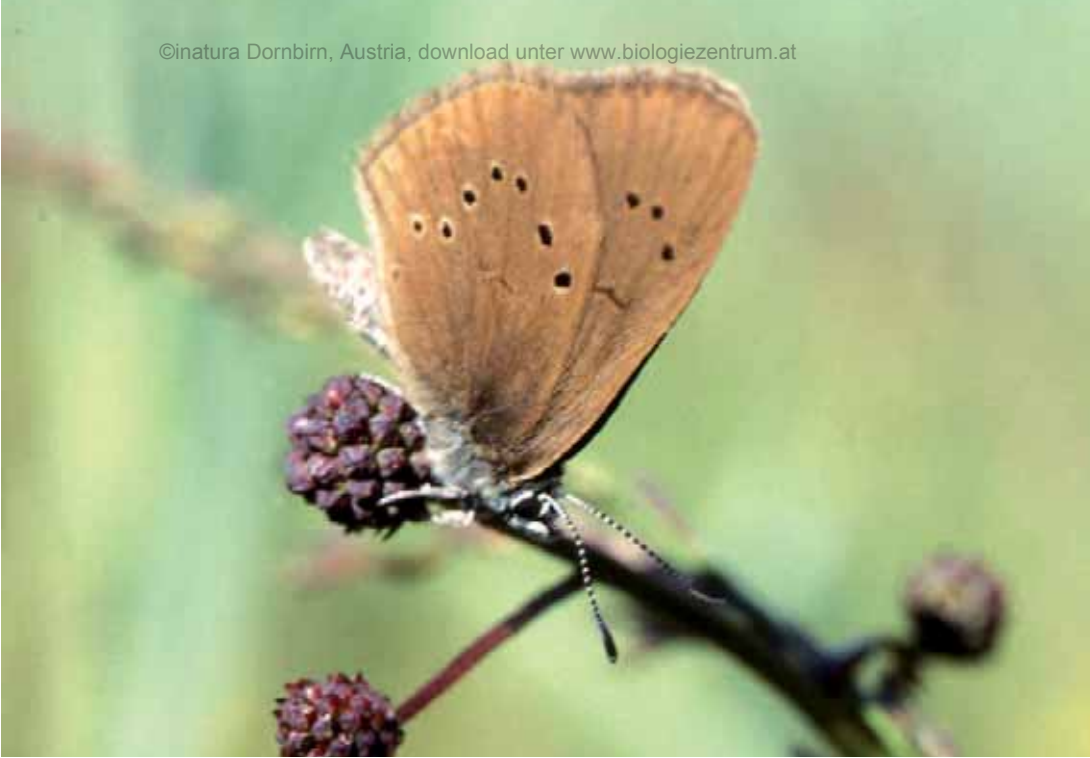
Abb. 24: Der dunkle Wiesenknopf-Ameisenbläuling ( Maculinea nausithous ), eine seltene Schmetterlingsart für deren Erhalt die EU Schutzmaßnahmen fordert.