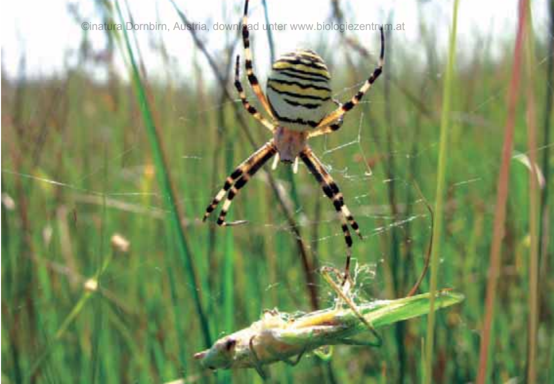
Abb. 7: Wespenspinne ( Argiope bruennichi ) mit ihrer Beute, einer Großen Schiefkopfschrecke ( Ruspolia nitidula ). Die Wespenspinne ist eine der auffälligsten Spinnenarten Mitteleuropas. Wie manch andere Wärme liebende Art konnte sie ihr Verbreitungsareal in den vergangenen Jahrzehnten stark ausweiten.