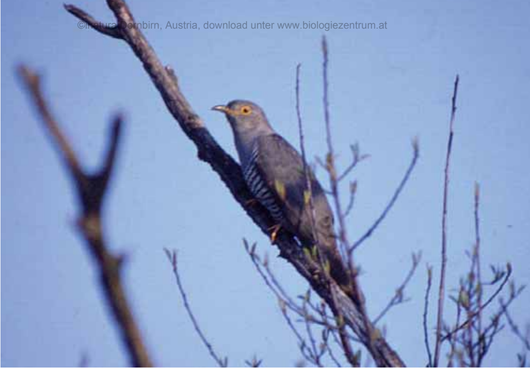
Abb.13: Ein alljährlicher Gast im Gebiet - der Kuckuck ( Cuculus canorus ).