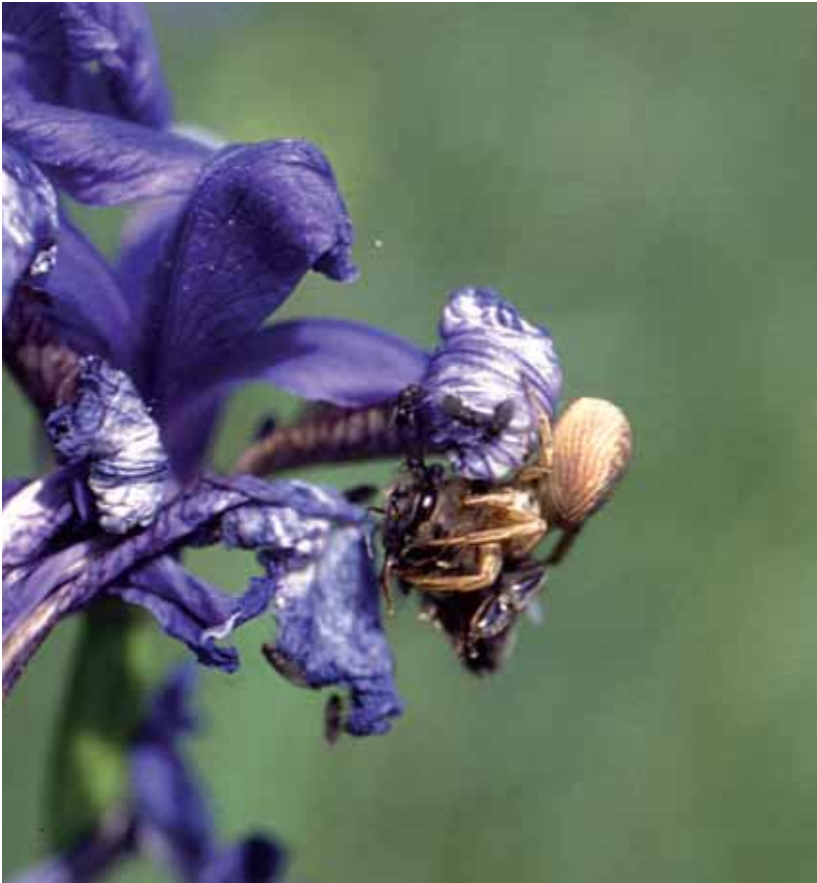
Abb. 8: Kommensalismus bei der Krabbenspinne. Da die Veränderliche Krabbenspinne ( Visumena matia ) ihre Färbung ändern kann, wurden über 20 verschiedene Arten beschrieben, bis mit modernen Methoden geklärt werden konnte, dass es sich um ein und dieselbe Art handelt (JÄGER & KREUELS 2006).