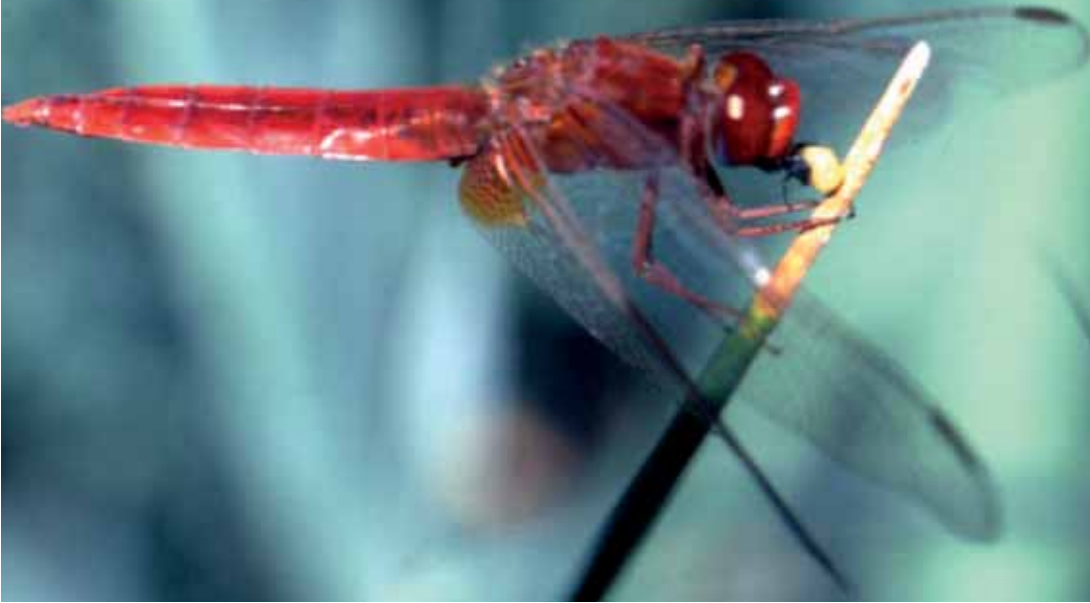
Abb. 10: Feuerlibelle ( Crocothemis erythraea ) – eine der seit 1999 neu beobachteten Libellenarten.