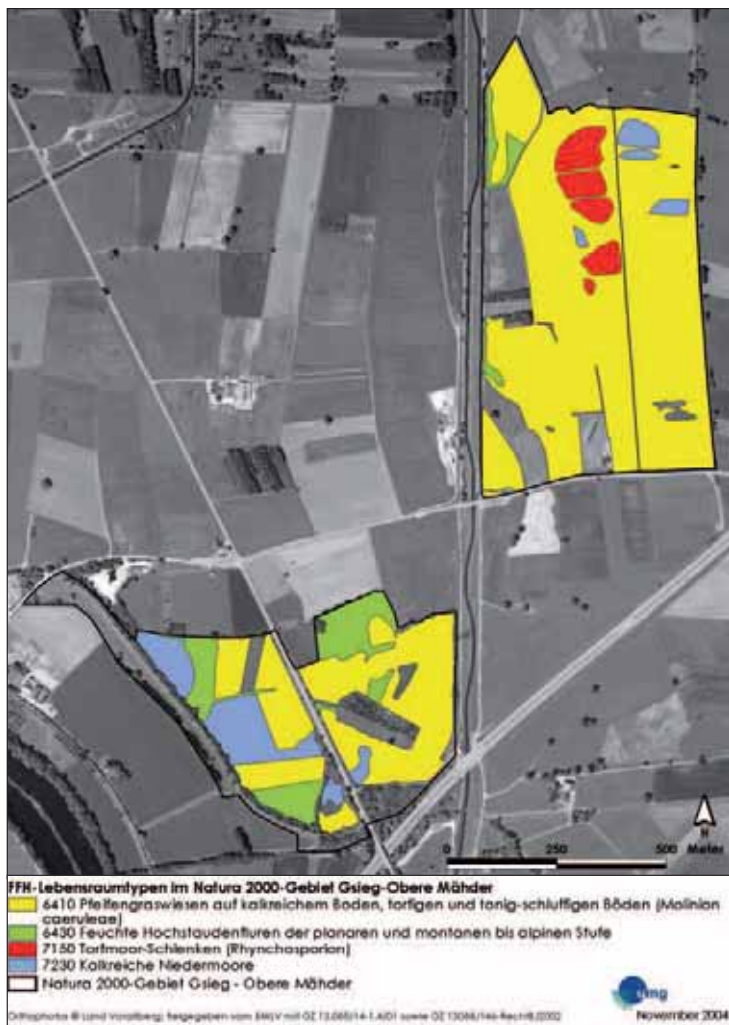
Abb. 16: FFH-Lebensraumtypen im Natura 2000-Gebiet Gsieg – Obere Mähder (UMG 2004). Im Natura 2000-Gebiet Gsieg – Obere Mähder wurden vier Lebensraumtypen des Anhangs I der FFH-Richtlinie nachgewiesen.