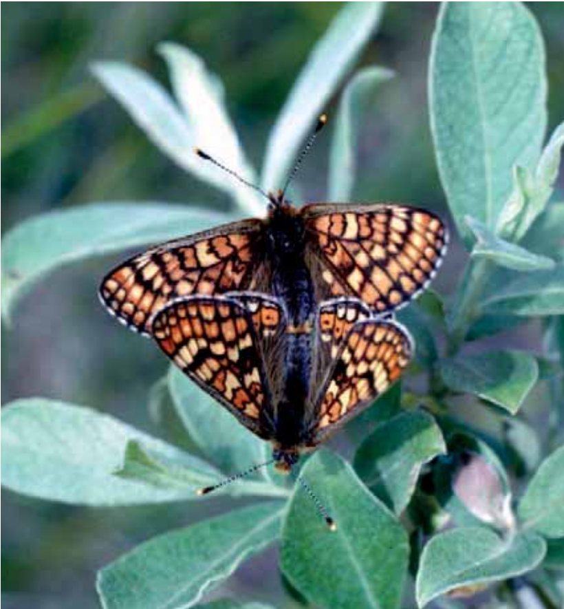
Abb. 24: Der dunkle Wiesenknopf-Ameisenbläuling ( Maculinea nausithous ), eine seltene Schmetterlingsart für deren Erhalt die EU Schutzmaßnahmen fordert.