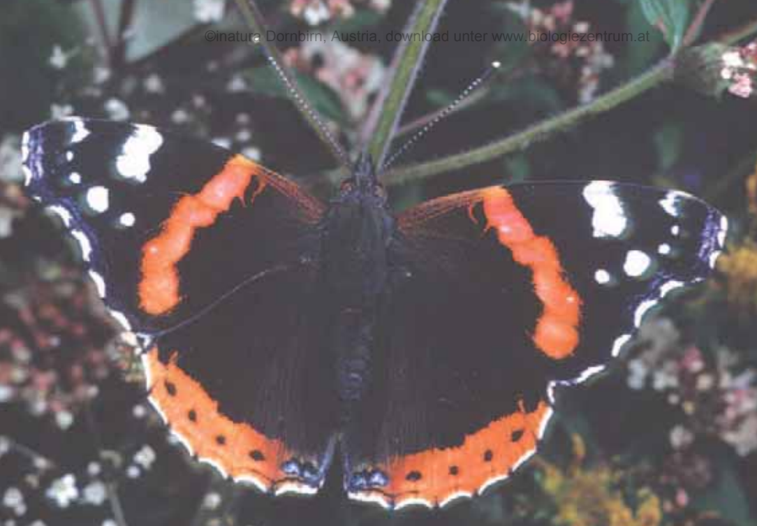
Abb. 9: Der Admiral ( Vanessa atalanta ) ist ein typischer Wanderfalter – im Frühjahr fliegt er nach Norden, im Herbst kehrt er nach Südeuropa zurück (SETTELE et al 1999).

die Fliegen der Gattung Desmometopa die Körpersäfte anderer Insekten zur Eireifung benötigen und nur über Kommensalismus an sie herankommen können (STERNBERG & BUCHWALD 1999).