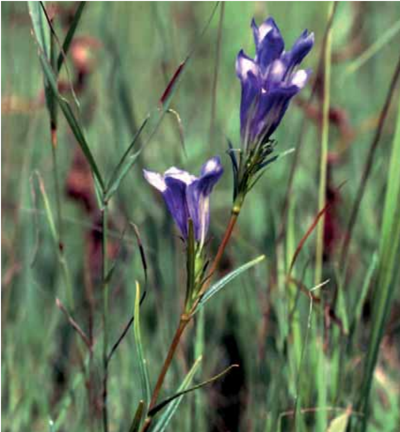
Abb. 28: Für den spätblühenden Lungenezian ( Gentiana pneumonanthe ) ist eine späte Mahd der Streuwiesen wichtig, damit die Samenbildung abgeschlossen werden kann.