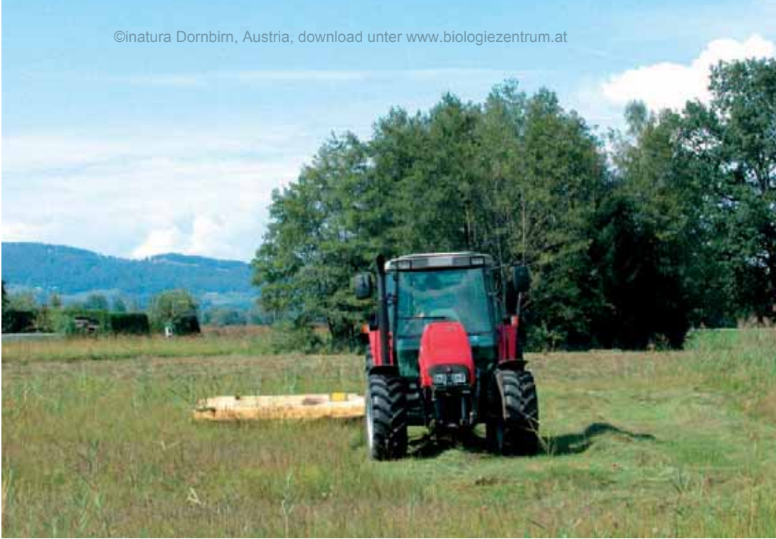
Abb. 27 : Streumahd in Obere Mähder. Eine regelmäßige Nutzung durch eine Mahd im Herbst ist Voraussetzung für den Erhalt der Streuwiesen.