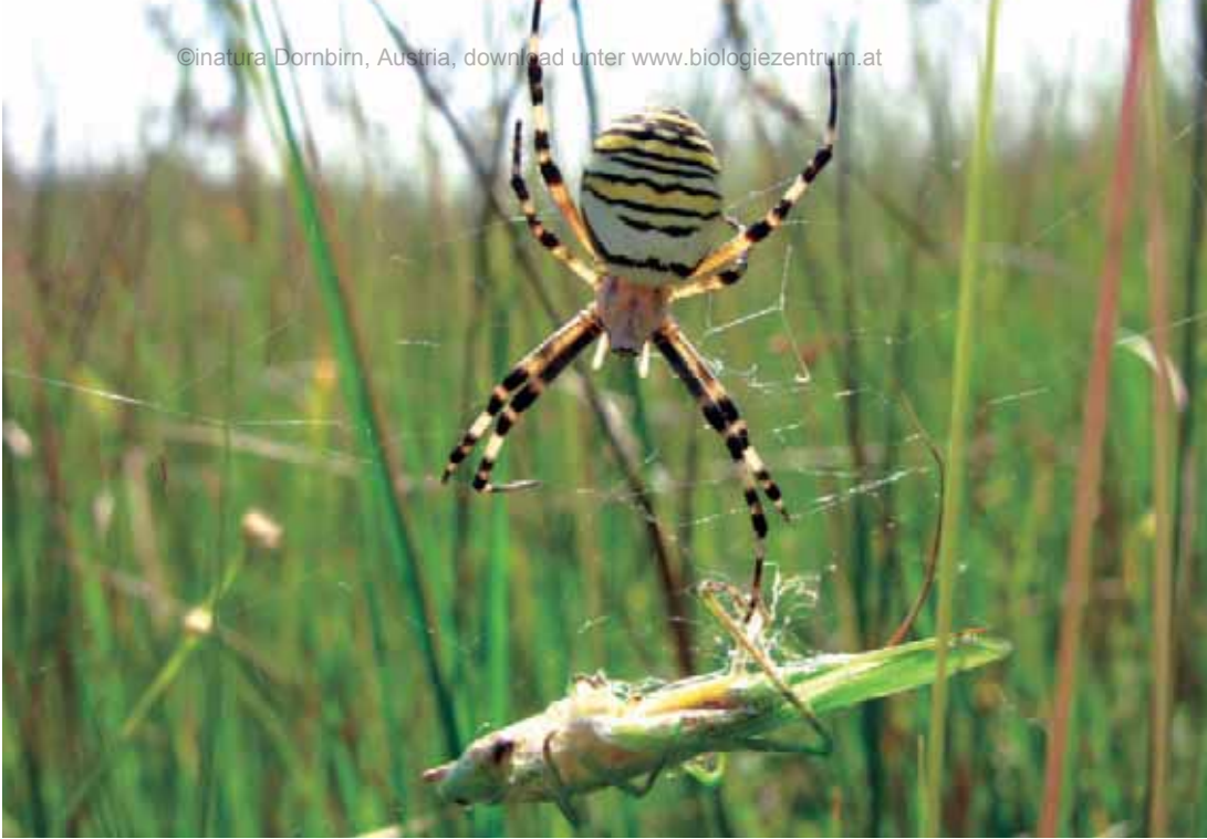
Abb. 7: Wespenspinne ( Argiope bruennichi ) mit ihrer Beute, einer Großen Schiefkopfschrecke ( Ruspolia nitidula ). Die Wespenspinne ist eine der auffälligsten Spinnenarten Mitteleuropas. Wie manch andere Wärme liebende Art konnte sie ihr Verbreitungsareal in den vergangenen Jahrzehnten stark ausweiten. (Foto: UMG)