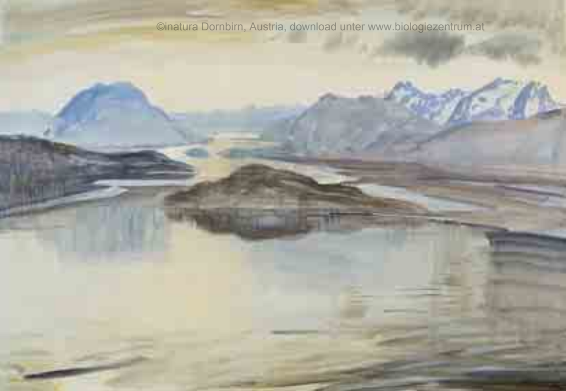
Abb. 1: Das Rheintal vor etwa 13.000 Jahren (Rekonstruktion – Aquarell von Hans Strobel). Der „Ur-Bodensee“ erfüllt das gesamte Rheintal. Gleichzeitig beginnt die Auffüllung der Sedimentfalle durch Seitenbäche

Talrand und Inselberge sind von geologischen Störungen durchzogen, die den einfachen Faltenbau des Helvetikums durchschneiden.