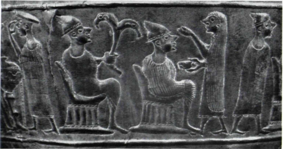
Abb. 7. Detail der Festszene auf der Situla von Vače in Ljubljana. Um 500 v. Chr. (etwa 1 : 1)

bildet ist. Etwa gleichzeitig ist ferner ein verziertes Helmfragment von der Magdalenska gora, das auch für Slowenien bereits für das 6. Jahrhundert diese Bildkunst nachweist. Schließlich machen andere nicht unmittelbar vergleichbare Werke, wie z. B. aus der Steiermark die Bronzegefäße von Klein Klein und der Kultwagen von Strettweg im Museum Joanneum in Graz, deutlich, daß bereits die orientalisierende Kunst Etruriens aus dem späten 7. Jahrhundert ihren Einfluß weit nach Norden ausdehnte und formend auf die Kulturentwicklung des Ostalpenraumes gewirkt hat. Daß auch Griechen mit diesem Raum Verbindung hatten, geht aus einem Gedicht des Alkman hervor (Parth. 50—51), der einen Vergleich mit einem venetischen Rennpferd bringt, was voraussetzt, daß die Rosse des nördlichen Adriagebietes einem Griechen des 7. Jahrhunderts bereits ein vertrauter Begriff für Tüchtigkeit waren.