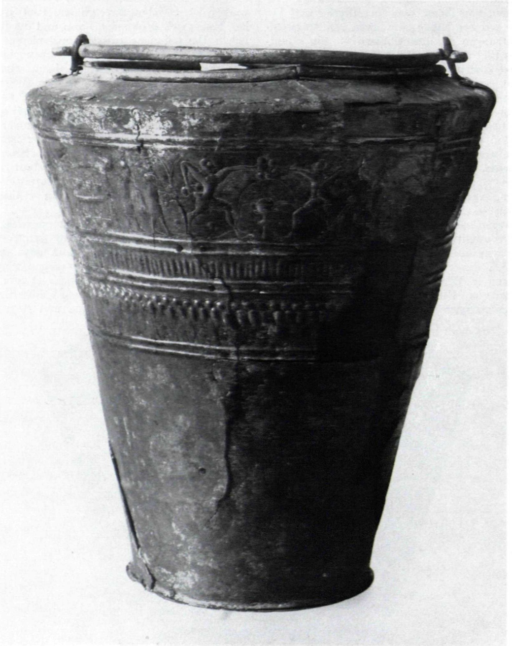
Abb. 2. Situla von Kuffarn (Höhe 25 cm)

Die Darstellung gliedert sich in vier Szenen: eine Bewirtung, einen Faustkampf, ein Pferde- und ein Wagenrennen. Ein Zecher in einem langen Gewand und mit einem mächtigen, breitkrepfigen Hut hat sich bequem in einen Sessel zurückgelehnt. In der Hand hält er eine Schale, die ein Schenk vor ihm aus einem Eimer mit