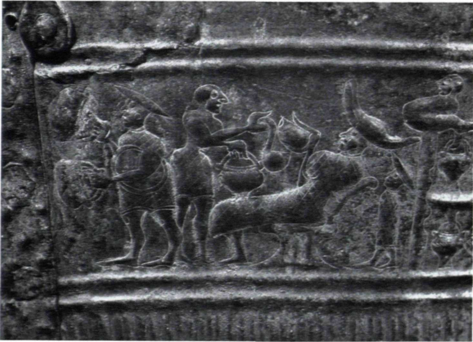
Abb. 3. Trinkszene (etwa 1 : 1)

einem Schöpfer füllt. Daß der Schenk nur mit einem kurzen Röckchen bekleidet zu sein scheint, da eine Gewandmusterung am Oberkörper