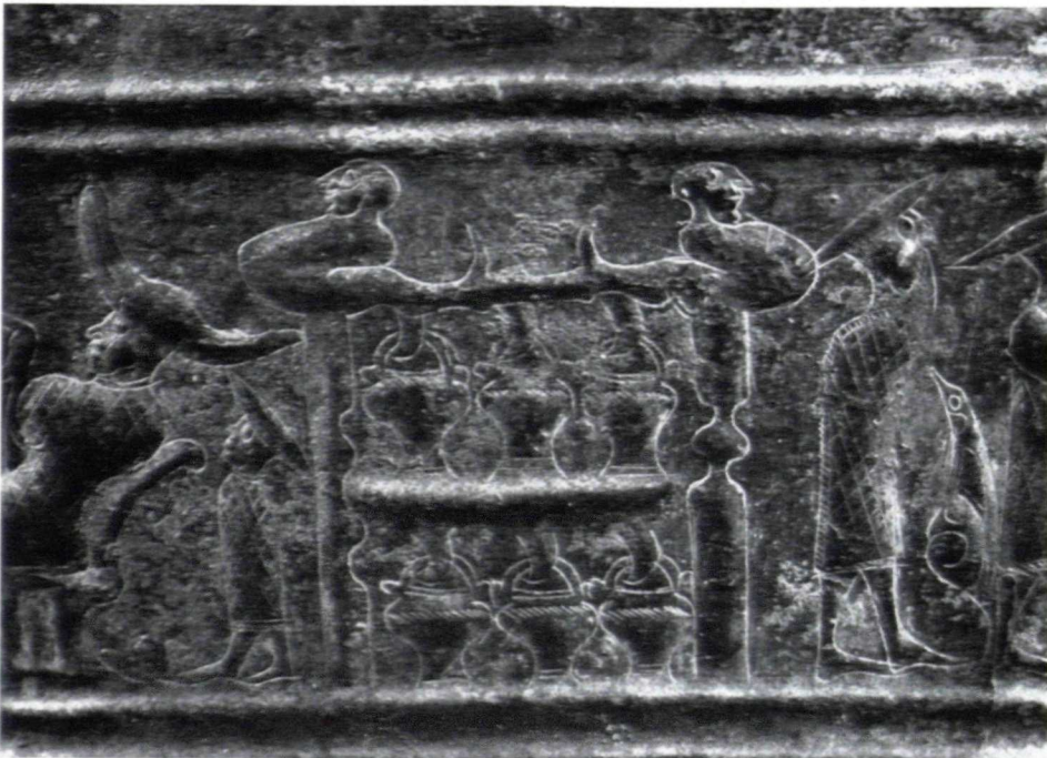
Abb. 4. Gestell mit Eimern (etwa 1 : 1)

fehlt, ist meines Erachtens nur auf Flüchtigkeit zurückzuführen. Wahrscheinlich ist er wie der zweite Diener mit der Schüssel unter dem Arm