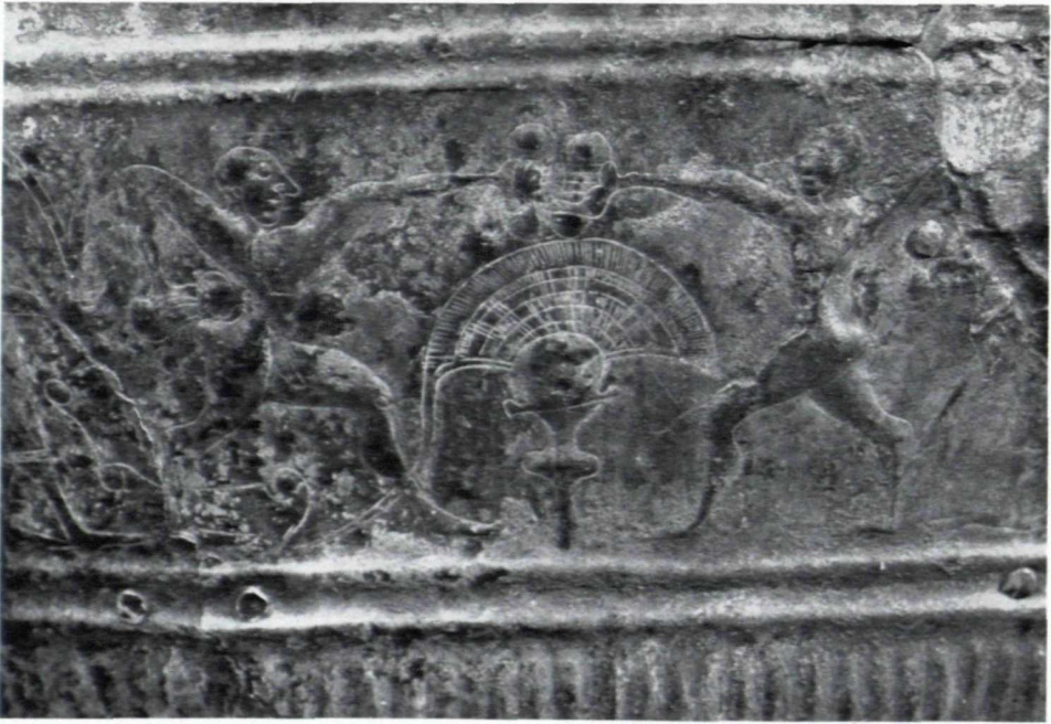
Abb. 5. Faustkampf (etwa 1 : 1)

angezogen, der gerade davongeht und zwei Henkelbecken schwingt, um sie wieder zu füllen. Letzterer trägt noch eine flache Mütze. Diese kehrt bei den anderen Männern des Frieses — abgesehen von den Wettkämpfern — immer wieder und wird die übliche Kleidung der Leute gewesen sein. So angetan ist auch der kleine Diener, der hinter dem Sessel steht. Daneben ist noch ein Gerüst für Eimer aufgestellt. Unklar ist aber die Bedeutung der beiden nackten Gestalten, die den Ständer bekrönen.