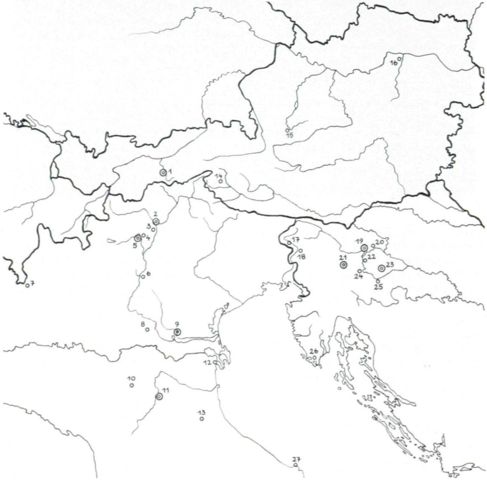
Verbreitungskarte der Werke der Situlenkunst

nach Norden über den Apennin vorstoßen und mehrere Städte in der Poebene gründen. Die bedeutendste war Felsina, das spätere Bologna, aus deren Friedhöfen zahlreiche etruskische Bronzegeräte und griechische Vasen jetzt das Museo Civico in Bologna füllen. Spina an der Pomündung wurde der Haupthafen für den