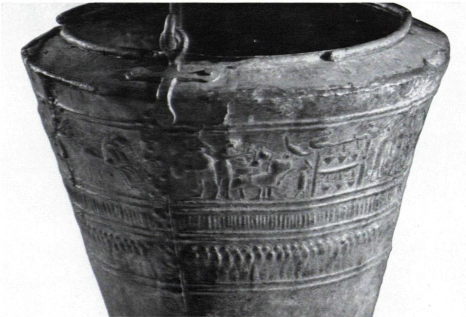
Abb. 1. Detail des Figurenfrieses und der Ornamentfries (etwa 1 : 2)

Die Figuren sind von innen herausgetrieben. Von außen ist dann ihr Umriß durch einen Meißel mit ganz schmaler Bahn oder durch eine punktförmige Punze nachgezogen worden. Die Innenmusterung der Gewänder ist zum Teil eingeschnitten. Beim Treiben wurden bestimmte Stellen, z. B. Wangen, Lippen und Kinn der