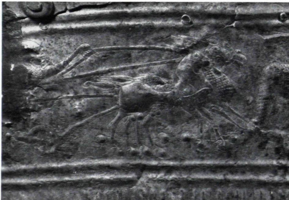
Abb. 6. Detail des Wagenrennens (etwa 1 : 1)

streitig machen kann. Auf ihn hat sich ein vielleicht glückbringender Vogel niedergelassen. Auch die Wagenlenker tragen eine besondere Kleidung, ein Gewand, das nach rückwärts in einem langen Schoß herabfällt — vielleicht ist es nur geschürzt —, und die Zipfelmütze, die wir schon bei den Reitern sahen.