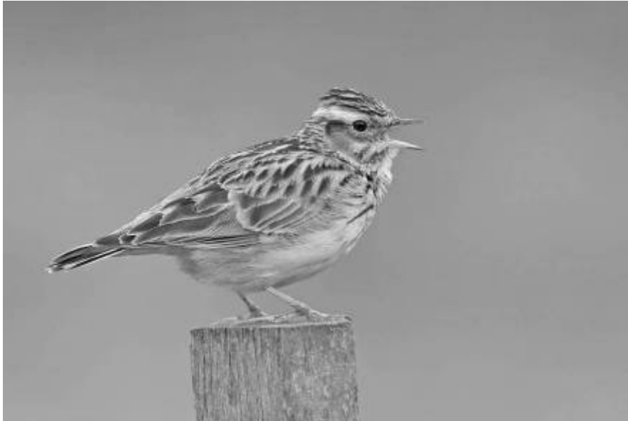
Heidelerche ( Lullula arborea ).