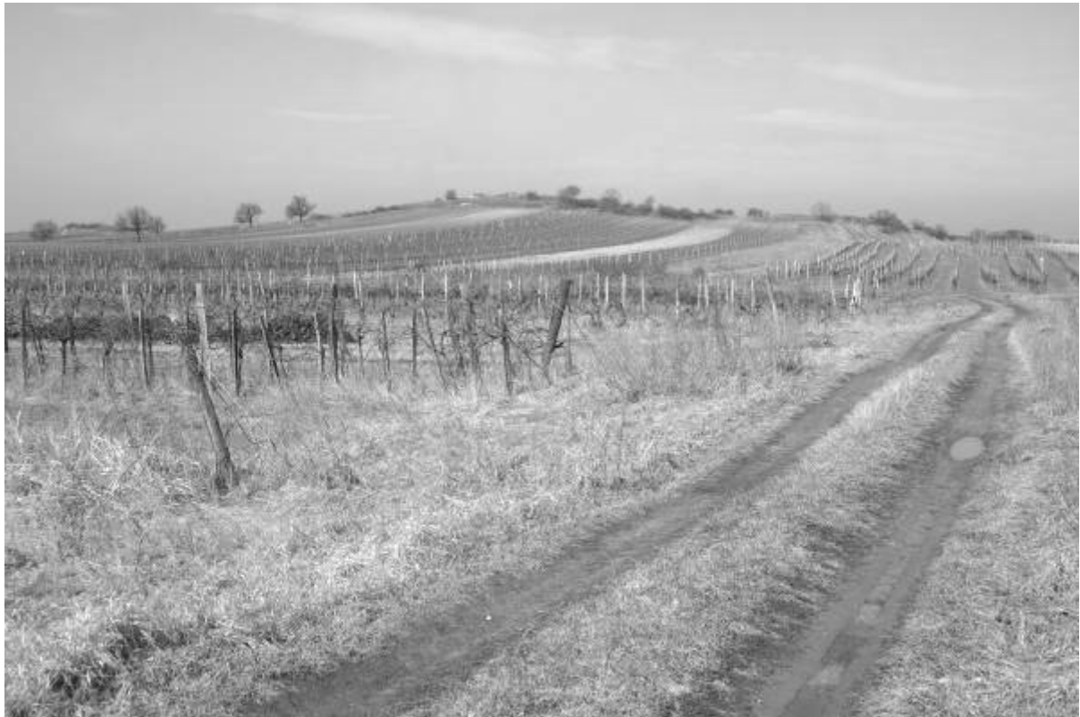
Abbildung 2: Lebensraum der Heidelerche ( Lullula arborea) bei Oggau, 27.3.2006.