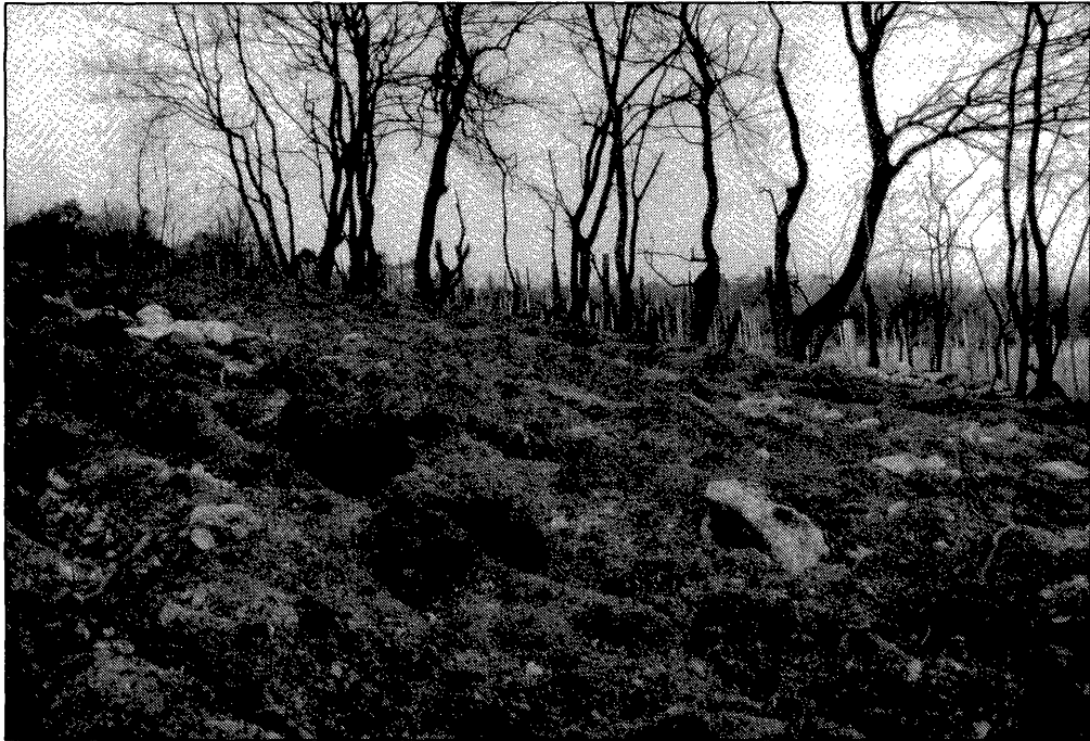
Abbildung 4. Umgebrochene Wiese am Rand zum Naturwaldreservat „Himmelswiese“ im Oktober 1989. Durch Tiefpflügen ist der geologische Untergrund angerissen und an die Oberfläche gebracht. (Foto: T. Zuna-Kratky).

Strukturreichtum bewahrt hat und auf den Spaziergänger sehr natürlich wirkt, hat der Lebensraumwandel doch deutliche Spuren in der Zusammensetzung der Vogelwelt hinterlassen.