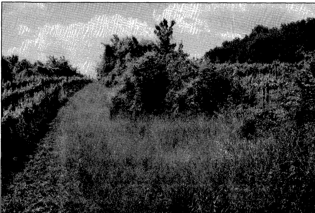
Abbildung 1. Buschiger Wiesenstreifen zwischen zwei schmalen Weingartenparzellen, Lebensraum für wärmeliebende Tier- und Pflanzenarten. (Foto: T. Zuna-Kratky).

Neben den großen traditionellen Weinbaugebieten etwa im Weinviertel, der Wachau und am Alpenostrand mit in den letzten Jahrzehnten stagnierender oder gar abnehmender Anbaufläche hat besonders der massive Aufschwung des Weinbaues im Nordburgenland zu einer Zunahme der Gesamtanbaufläche in Österreich geführt. 1986 lag die gesamte Weinbaufläche in Österreich bei knapp 58.500 ha (nach Angaben in SPITZENBERGER 1988).