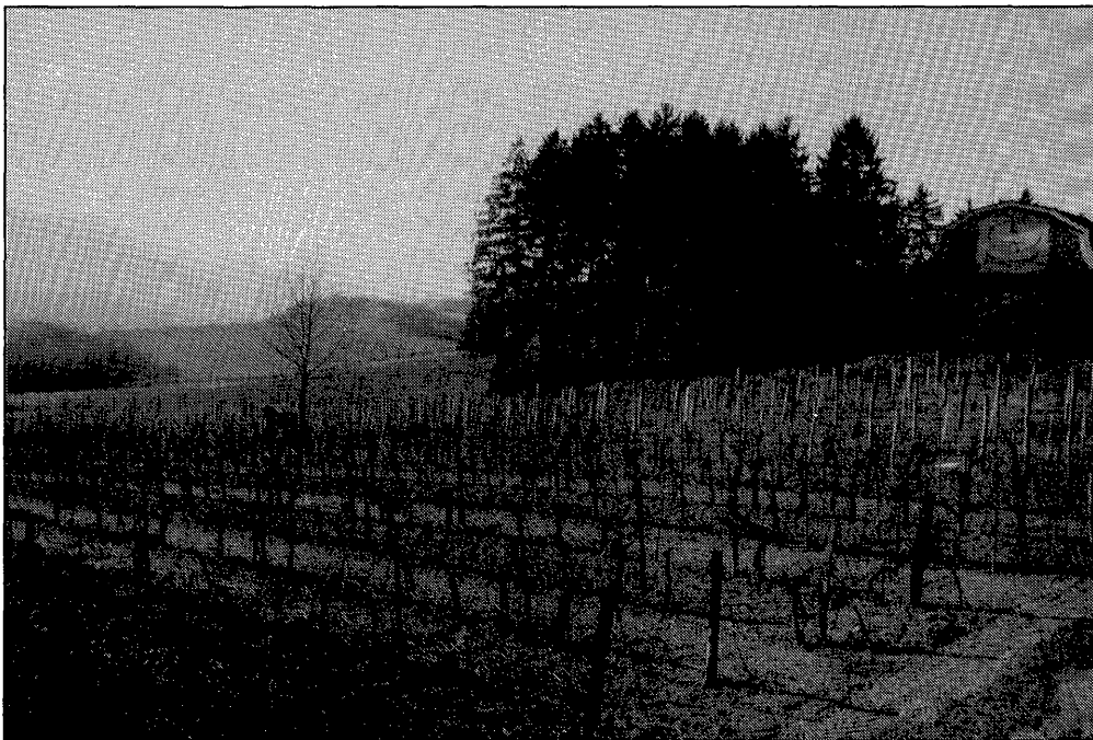
Abbildung 6. Derselbe Weingarten wie in Abb. 5, zwei Jahre später. Die Bäume sind bis auf einen Nußbaum entfernt, die alten Rebzeilen entfernt und neu gesetzt, Randstreifen umgeackert, Gebüsch entfernt.

Neben einem Verlust an Wiesenflächen ist besonders eine qualitative Veränderung der Weingartenflächen zu verzeichnen. Ende der 70er Jahre wurden weite Bereiche der Weingärten neu angelegt, ein Vorgang, der sich in deutlich stär-