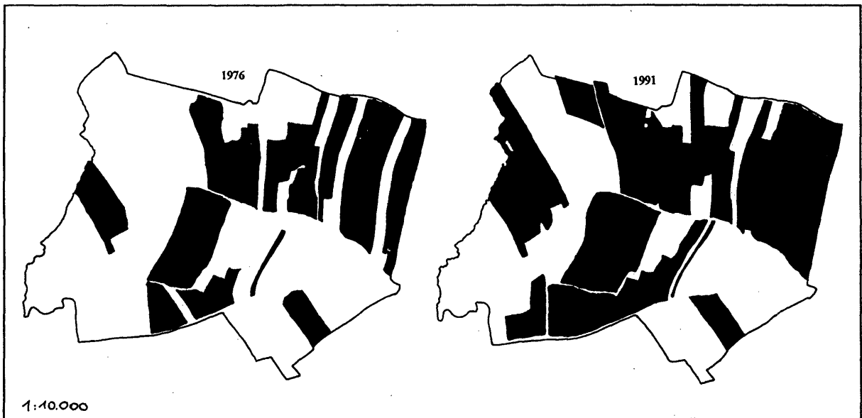
Abbildung 2. Weinbauflächen im Untersuchungsgebiet „Neuberg“ 1976 und 1991.

Das Untersuchungsgebiet hat eine Höhenerstreckung von 250–320 m Seehöhe. Die Neigung der Hänge geht überwiegend nach Süd bis Südost, durch einen zentral verlaufenden flachen Graben sind jedoch zusätzlich alle weiteren Expositionen (am schwächsten westliche) vertreten. Der geologische Untergrund besteht aus kalkreichen Ablagerungen des Tertiärmeeres, was typisch für viele Bereiche der Thermenlinie ist.