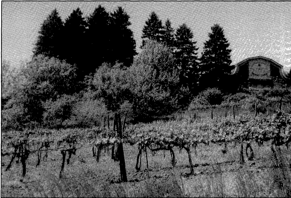
Abbildung 5. Verwilderter obstbaumreicher Weingarten (Hintergrund) im Nordteil des Untersuchungsgebietes im Jahr 1990.

Mähnutzung. Die Umwandlung von Äckern in Weingärten verlief überwiegend vor der Mitte der 80er Jahre.