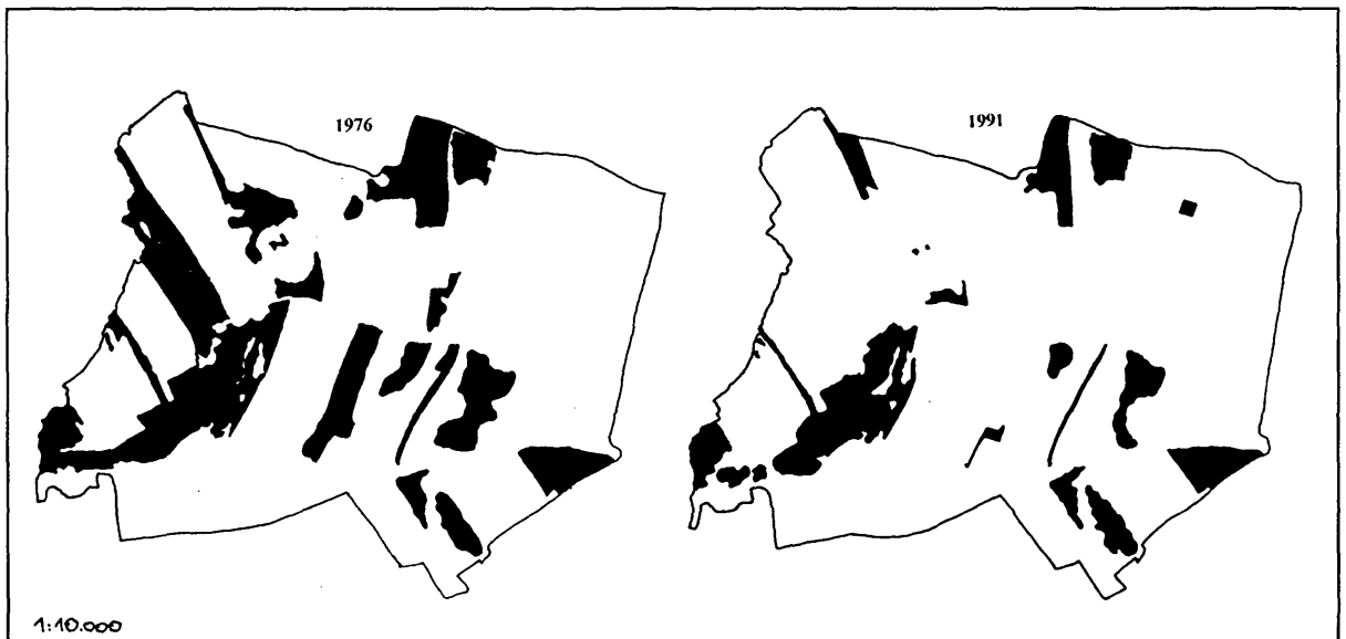
Abbildung 3. Intakte Trockenrasen und Halbtrockenrasen im Untersuchungsgebiet „Neuberg“ 1976 und 1991.

Gleichzeitig nahm die Ausdehnung intakter, unverbuschter Trocken- und Halbtrockenrasen von 6,8 ha auf 3,6 ha ab. 2,3 ha davon wurden umgebrochen und in Weingärten umgewandelt, die ersten Flächen Ende der 70er Jahre, nach einer Ruhepause von knapp 10 Jahren schließlich der größte Brocken (1,4 ha) in den Wintern 1988/89 und 1989/90 (Abb. 4). Der Rest verschwand durch Verbuschung nach Aufgabe der