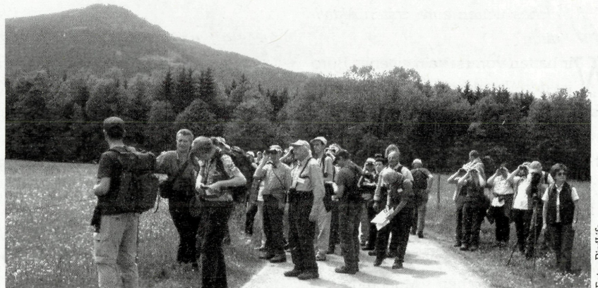
Exkursion in die Rosswiesen bei der Jahrestagung 2006.