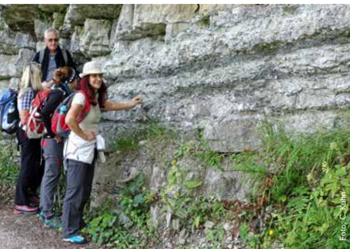
NaturvermittlerInnen bei einer Felswand im Ötscher:reich.

Für die Pilotphase wurden zwei Regionen als Projektgebiete ausgewählt: Zum einen das Ötscher:reich und Mariazeller Land an der Grenze NÖ/Stmk, wo die im Rahmen der NÖ Landesausstellung 2015 ausgebildeten NaturvermittlerInnen die Umsetzung in die Praxis gewährleisten. Die Mitarbeit bei der Ausarbeitung von Veranstaltungsprogrammen mit Partnern der Region soll dies weiter unterstützen. Als zweite Pilotregion hat sich die geographisch nahe liegende, vom Landschaftscharakter aber sehr unterschiedliche Region Weintal - Freiwald an der Grenze zwischen Mühl- und Waldviertel angeboten.