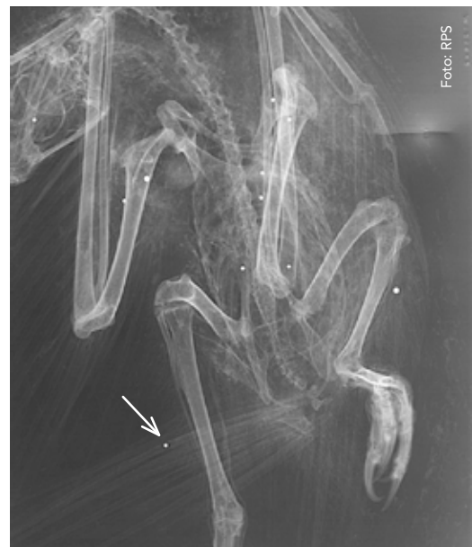
Getöteter Kaiseradler: Im Röntgenbild kann man den Bleischrot (weiße Punkte) deutlich erkennen.

Mit 1. Oktober des Jahres startete das internationale Life Projekt „PannonEagle Life“. Ziel des Projekts ist es die menschliche verursachte Mortalität des Kaiseradlers in Mitteleuropa zu reduzieren. Unter „menschlich verursachter Mortalität“ versteht man vor allem die illegale Greifvogelverfolgung, welche auf die mitteleuropäische Kaiseradlerpopulation massive Auswirkungen hat. Insgesamt 11 Organisationen aus