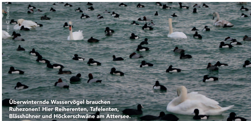
Überwinternde Wasservögel brauchen Ruhezonen! Hier Reiherenten, Tafelenten, Blässhühner und Höckerschwäne am Attersee.