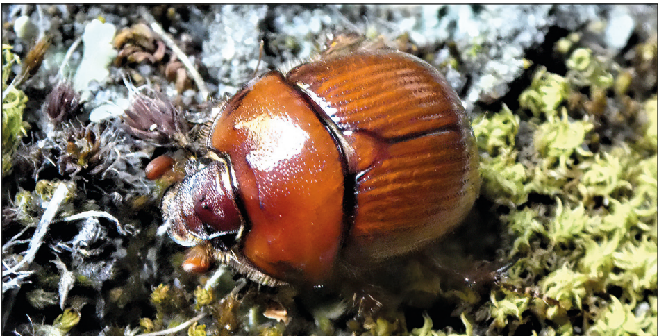
Abb. 1: Männchen von Bolbelasmus unicornis vom Fuchshäufel. – Fig. 1: Male of Bolbelasmus unicornis from Fuchshäufel.

The genus Bolbelasmus is represented in Austria by one species, Bolbelasmus unicornis . The species is rather rare and listed in the FFH directives of the European Union in annexes II and IV. The Red List of threatened species in Austria classifies B. unicornis as endangered, and also proposed the status critically endangered for the species in