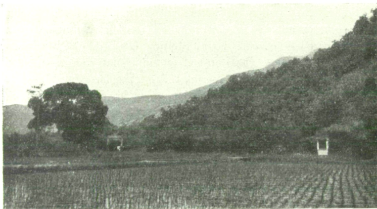
Abb. 1. Charakteristisches Landschaftsbild aus dem Gebirge südwestlich von Hang-Tschou. In der Talsohle Reisfelder, die Berghänge mit subtropischem Wald bedeckt.

Hang-Tschou, die Hauptstadt der Provinz Tschekiang, liegt etwa 170 km südwestlich von Shanghai, mit dem es durch eine Bahnlinie verbunden ist, an der Mündung des Tsien Tang-Flusses in das Gelbe Meer. Im Nordosten an eine fruchtbare, von vielen Kanälen durchzogene Ebene stoßend, bildet es ein Zentrum der Seidenzucht und ist gleichzeitig eine der ältesten Kulturstätten Chinas. Landschaftlich gilt es als eine der schönstgelegenen Städte des chinesischen Reiches