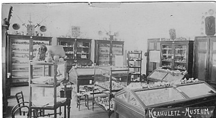
Krahuletz Arbeitszimmer (alte Ansichtskarte)

Aufgrund der heute noch nicht vorhersehbaren Pandemie-Beschränkungen bitte unbedingt die WEB-Seite beachten oder per mail rechtzeitig nachfragen. Möglicherweise muss ein Online-Symposium mit eingeschränkter Teilnehmerzahl durchgeführt werden. Im Falle einer vollständigen Absage werden die Tagungsunterlagen per Post den Teilnehmern zugeschickt.