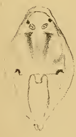
Fig. 1 b