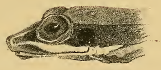
Fig. 1 a