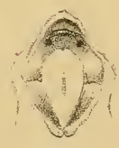
Fig. 2 a