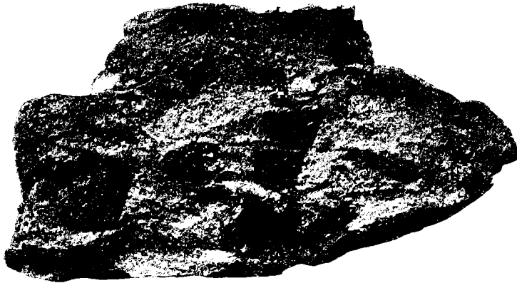
Eckige Brocken von Glanzkohle und dünne Steinkohlenschmitze im Karbonsandstein. Natürliche Größe.

Dies schien dafür zu sprechen, daß die Substanz der Gerölle zur Zeit ihrer Einbettung in den Sandstein noch weich gewesen ist. Gleich zu erwähnende Gründe schließen dies aber aus und so müssen diese Stigmen für nichts anderes gelten als ähnliche Stigmen in manchen Konglomeraten und die Eindrücke in den Geröllen der Nagelfluh, nämlich als durch Auflösung entstanden.