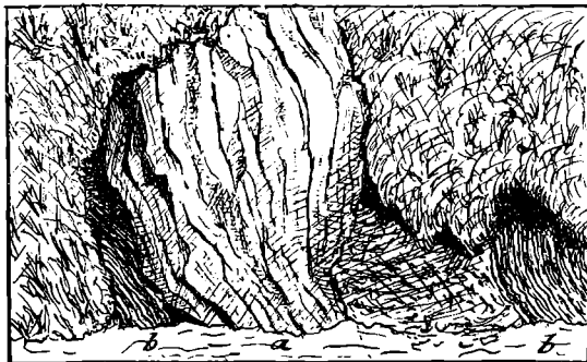
Aufschluß im Kotzgraben.

a = Gneis. — b = Karboner Graphitschiefer.