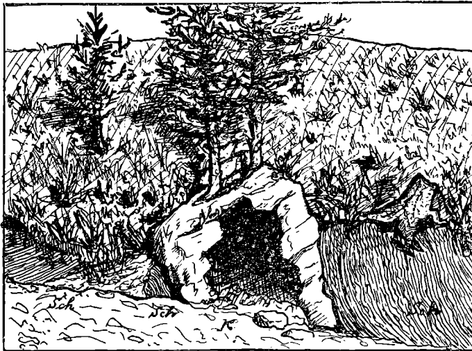
Aufschluß im Hohlwege bei Schörgendorf.

K = Karbonkalk. — Sch = Graphitschiefer.