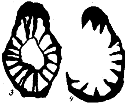
Fig. 3. Der Schnitt liegt 2 mm über der Bruchfläche.