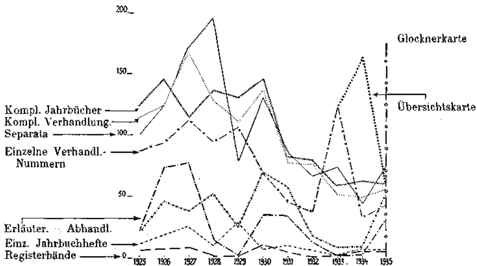
Jede Einheit entspricht einem verkauften Exemplar.