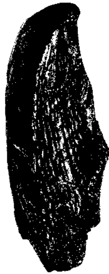
Fig. 2. Dasselbe Exemplar, gegen die Area gesehen (nat. Gr.).

zugehen und die beobachteten Eigenschaften einander gegenüberzustellen. Es sei aber insbesondere noch auf die gute Abbildung bei Haas (Lit. 1909, Tafel VI, Fig. 11 a, b) hingewiesen, da keine Beschreibung die Überzeugungskraft des optischen Eindrucks haben kann.