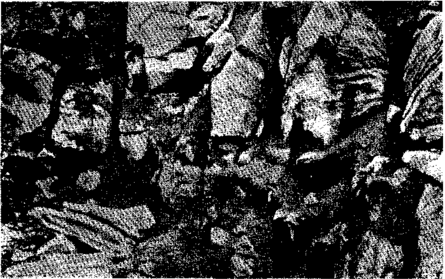
Abb. 2. Stück aus dem nordwestlichen Teil der Bruchwand des Steinbruches Marbach der Firma A. Pfitzner nahe Tagesoberfläche.

Die eigentliche Marmorindustrie im Hinterlande von Spitz scheint ihren Ausgang im Tale des Spitzer Baches zwischen Elsarn und Ötzbach genommen zu haben. Hier bricht der Marmor sowohl im Tal als auch an den Hängen an zahlreichen Stellen in guter Beschaffenheit auf. So stammt das heute noch wohl erhaltene, im Jahre 1693 hergestellte marmorne Hauptportal der Wallfahrtskirche Maria-Taferl laut alten Aufzeichnungen aus dem Steinbruche Kohlenberger bei Ranna, also aus der Gegend von Mühlendorf. In dieser Gegend sind zahlreiche alte, teilweise bereits weitgehend verstürzte und unter Buschwerk und Wald verschwundene Marmor- und Baukalkgewinnungsstätten vorhanden. Die Abtransportverhältnisse am Wege längs des Baches nach