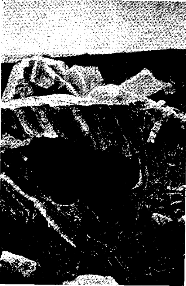
Abb. 1. Freigelegter Robblock mit angebrochener Wasserbahn. Steinbruch bei Kalkgrub.

Bildung von Karren, Röhren, Brunnen (Orgeln) usw. (vgl. Abb. 1). So ziehen von den durch die Steinbrüche um Kottes und Els geöffneten Marmorlagern zahlreiche alte, jetzt größtenteils mit Lehm und Gneisschutt verfüllte Wasserbahnen in die Tiefe (vgl. Abb. 2). Es ist anzunehmen, daß die durch ihre prähistorischen Funde berühmten Höhlen im Kremstale (Gudenushöhle, Schusterlucke usw.) mit diesem Karstphänomen der Ver-