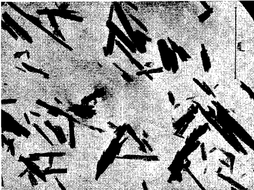
Abb. 2. Halloysit, Wegscheid, N.-Ö., Vergrößerung 30.000 ×