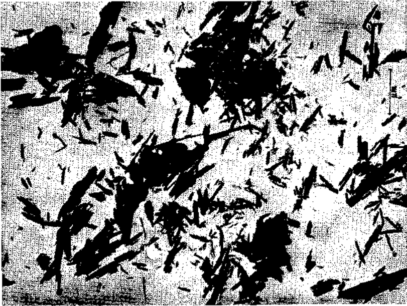
Abb. 1. Halloysit, Wegscheid, N.-Ö., Vergrößerung 12.000 ×