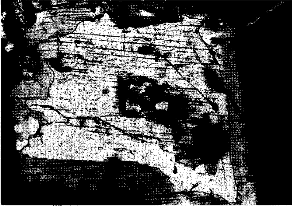
Abb. 1: Divergenz zwischen Zwillinglamellen im basischen Bytownitkern (hell, Grenze nachgezogen) und im umhüllenden Andesin. Hornblendegabbrodiorit, Pecera dy.