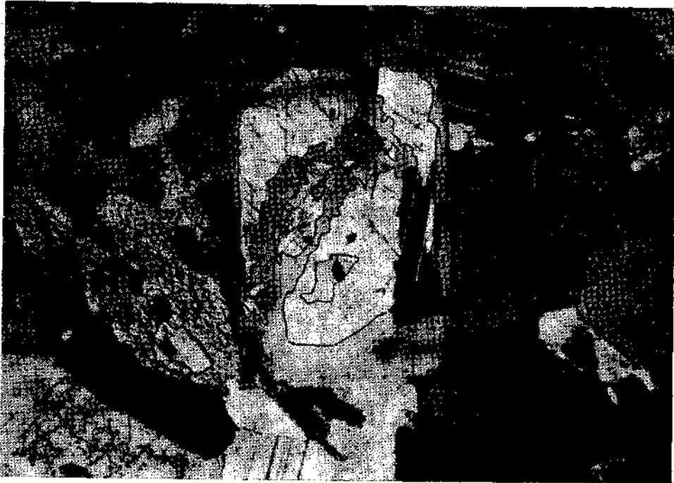
Abb. 4: Zerbrochener und korrodierter Bytownitkern (Grenzen nachgezogen) in undefor miertem Andesin-Mantelplagioklas. Tonalit von Teletín.

Moldanubikums als in-situ -Bildung zuzuordnen, im NW stehen sie im thermischen Kontakt mit schwach metamorphen Sedimenten des Barrandiums. Eine Vergleichbarkeit mit den periadriatischen Tonaliten und Granodioriten ist entsprechend der unterschiedlichen geologischen Situation und der Bildungsbedingungen nur beschränkt möglich. In Bereichen mit Kontaktmetamorphose existieren vergleichbare Bedingungen wie in den Periadriatica. Für den migmatitischen Kontakt mit dem Moldanubikum gibt es keinen Vergleich. Die hier zu beobachtenden Verhältnisse entsprechen eher den katazonal anatektischen Gesteinsumbildungen und Mobilisationen im Tessiner Kristallin.