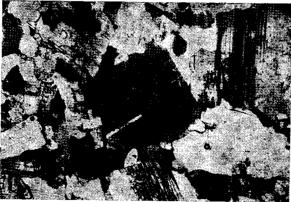
Abb. 2: Zu einem „Kernring“ korrodierter basischer Kern (Bytownit) im Mantelplagioklas (Andesin). Tonalit von Teletín.

Ein trondhjemitischer Granodiorit von der gleichen Lokalität unterscheidet sich von der oben beschriebenen Tonalitprobe durch Fehlen von Hornblende,