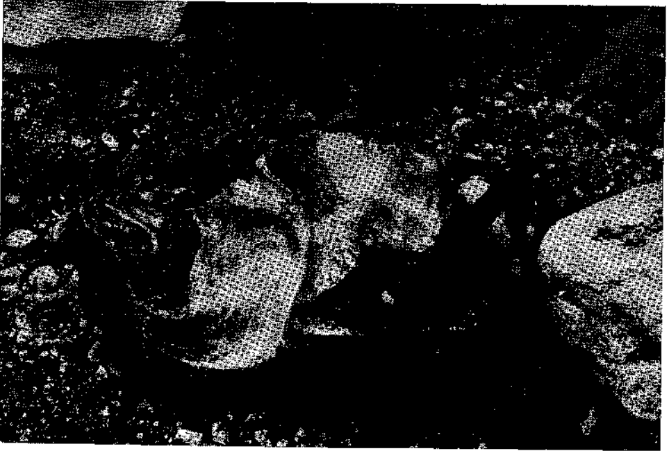
Abb. 3. Amphibolitblock mit tiefen Auskoklungen. Gänserdorfer Terrasse (Gänserdorf, Grube Porr).