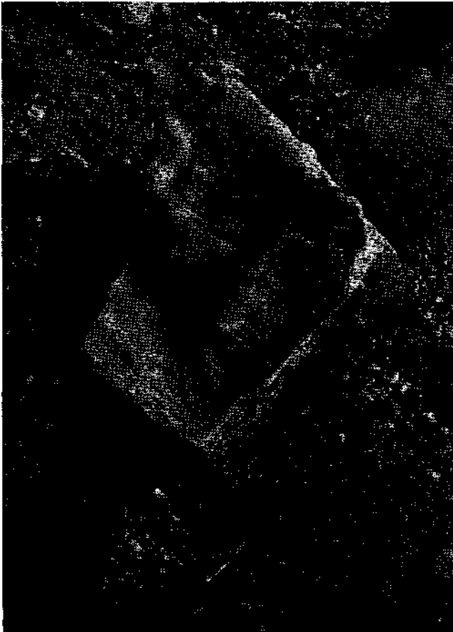
Abb. 2. Gneisblock mit fluvialer Überarbeitung einer Fläche (ursprünglich Teil einer Bachsohle). Gänserndorfer Terrasse (Markgrafneusiedl, Grube Haindl).

Daß Ablagerung und Bedeckung in diesen Fällen unmittelbar aufeinander folgen, war besonders gut an dem Block aus einer Grube in der Terrasse westlich Seyring zu beobachten (Abb. 4). Der mittelkörnige Granitblock mit ca. 0,3 m 3 (rund 800 kg) hat bei seiner Sedimentation die liegende Sandlage stark eingedrückt. Eine Erscheinung, die nur dann verständlich wird, wenn man annimmt,