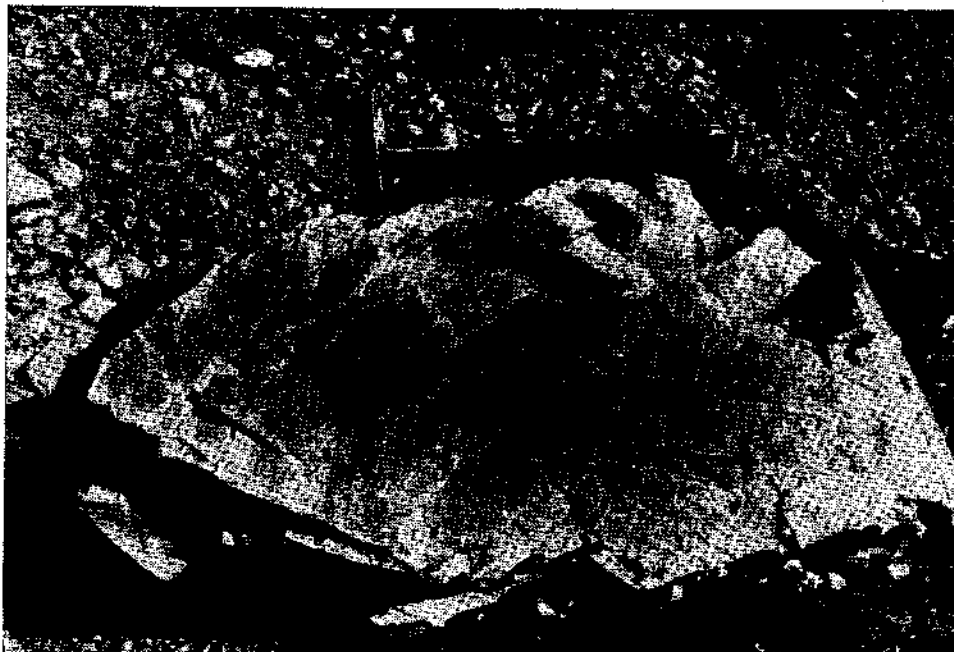
Abb. 1. Scharfkantiger, schwach klüftiger Granulitblock ohne jede fluviale Überarbeitung. Gänserndorfer Terrasse (NE Markgrafneusiedl).

Die Größe der Blöcke liegt zwischen 30 bis 50 dm 3 (80 bis 150 kg) und ca. 0,25 m 3 (rund 700 kg). Größere Blöcke wurden nur ganz selten gefunden, so in der Grube Stöger NE Markgrafneusiedl ein Block von ca. 0,6 m 3 .