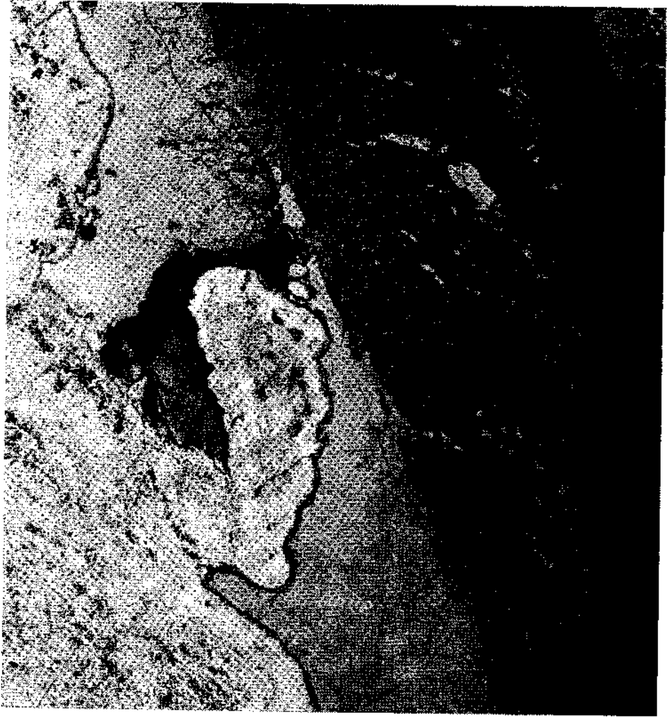
Abb. 2. Schwarzweißkopie eines Bildes aus der Infrarot-Luftbildserie „Westlicher Neusiedlersee“. Das Bild zeigt Schilfgürtel und Seefläche östlich von Oggau. Dunkle Flächen und Punkte markieren zum größten Teil Grundwasserzutritte. Am rechten Bildrand ist die Grundwasser-Aufstiegszone, welche sich an die Südfortsetzung des Neusiedler Bruches anschließt, in zwei dunklen Streifen deutlich erkennbar. Die dunkle Zone in der linken Bildmitte markiert teilweise die Einmündung von Oberflächenwässern, die von Oggau her in den See münden. (Veröffentlicht mit Einverständnis der Bundesversuchs- und Forschungsanstalt Arsenal).

Vervielfältigung mit Genehmigung des Bundesamtes für Eich- und Vermessungswesen (Landesaufnahme) in Wien; G. Z. L 62.518/75.