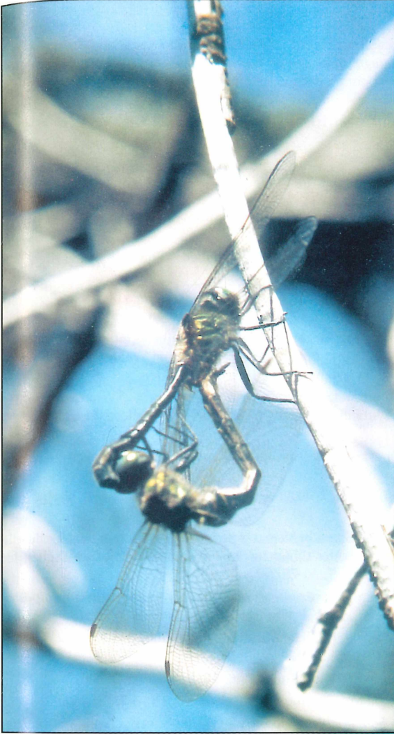
Abb. 2 Paarungsrad der Arktischen Smaragdlibelle, Mothäuser Heide, August 1997.