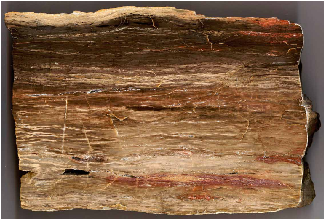
Abb. 3 Kieseltorf aus Rüdigsdorf, Breite der Scheibe ca. 20 cm, Slg. KRETZSCHMAR P439Ho.

Exemplar haftet Sand an, jedoch gehen viele in feinen Tuff über.