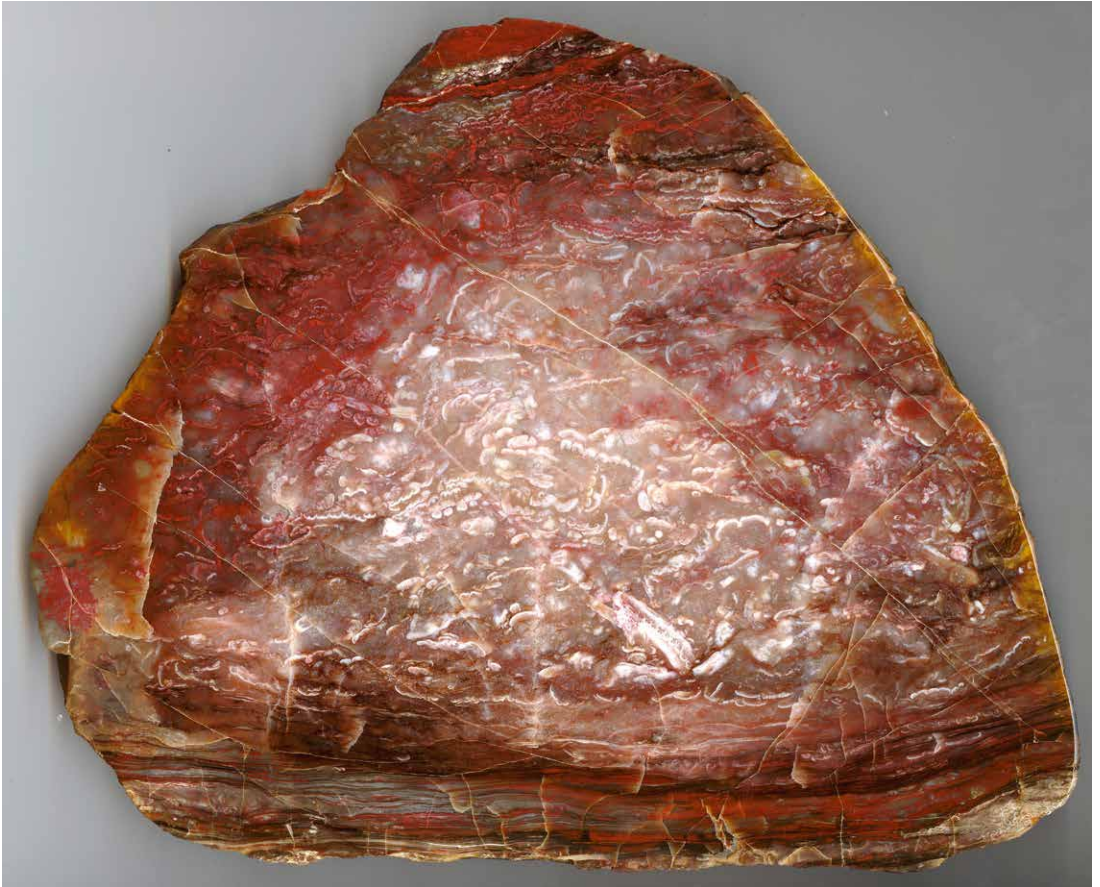
Abb. 2 Kieseltorf von Kleinnaundorf/Burgk, Breite der Scheibe ca. 20 cm, leg. H. SAHM, Slg. KRETZSCHMAR P374Ho.

selten aufzufindende zweite Variante (Abb. 6) beinhaltet in einer hellen Matrix bisher ungedeutete, schlauch- und kugelförmige Gebilde, welche manchmal kleine Schalenreste von Ostracoden führen.