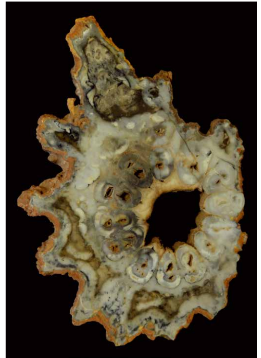
Rhexoxylon africanum , Trias von Zimbabwe, größter Durchmesser 30 cm.