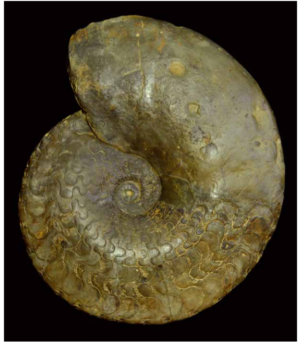
Discoceratites semipartitus aus dem oberen Muschelkalk von Schweinfurt, größter Durchmesser 30 cm.

4 DERNBACH, U. (Hrsg.) (1993): Araucaria . 160 S.; Lorsch (D'ORO).