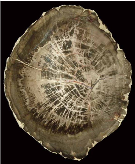
Araucarienholz, Jura/Kreide? von Neuquen, Argentinien, größter Durchmesser 14 cm.