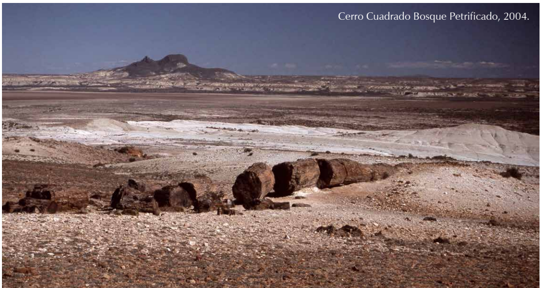
Cerro Cuadrado Bosque Petrificado, 2004.

In weiten Gebieten Patagoniens wuchsen im Jura lichte Araucarien-„Wälder“ von etwa 6-7 Bäumen pro Hektar, was am