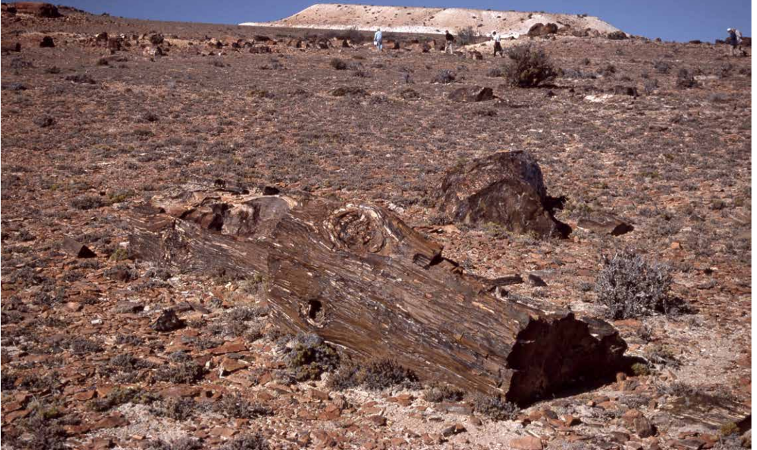
Cerro Cuadrado Bosque Petrificado, einer der schönsten versteinerten Wälder Patagoniens, 2004.