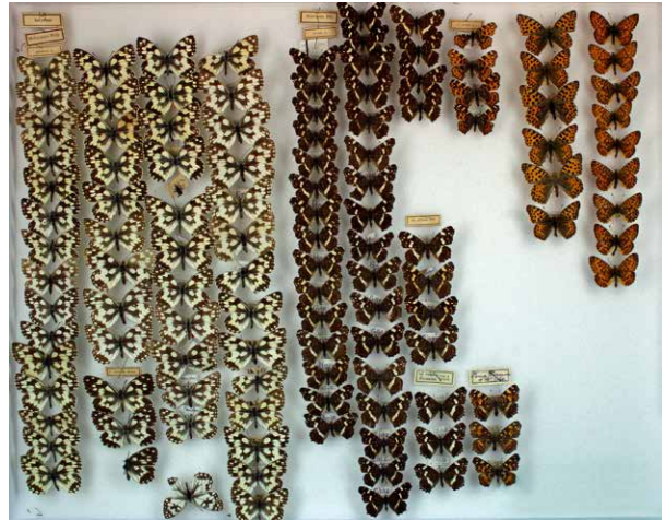
Abb. 2 Kasten (1) mit Edelfaltern (Nymphalidae) (Inv.-Nr. I-1243-C)