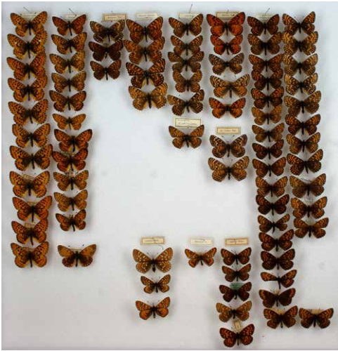
Abb. 4 Kasten (3) mit Edelfaltern (Nymphalidae) (Inv.-Nr. I-1245-C)