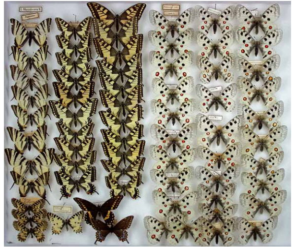
Abb. 5 Kasten mit Ritterfaltern (Papilionidae) (Inv.-Nr. I-405-C)