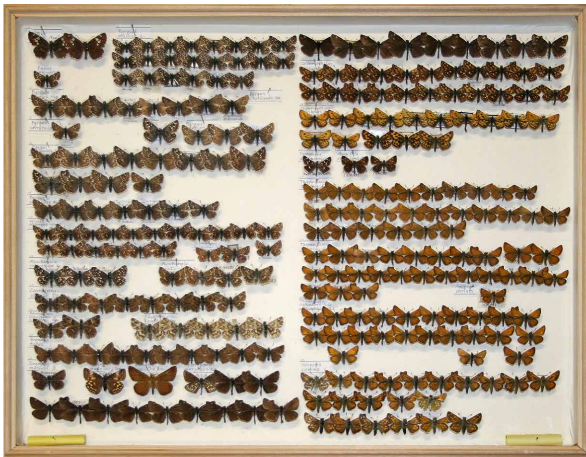
Abb. 4 | Kasten Nr. 02 aus der Sammlung G. Goldbach: Dickkopffalter (Hesperiidae).