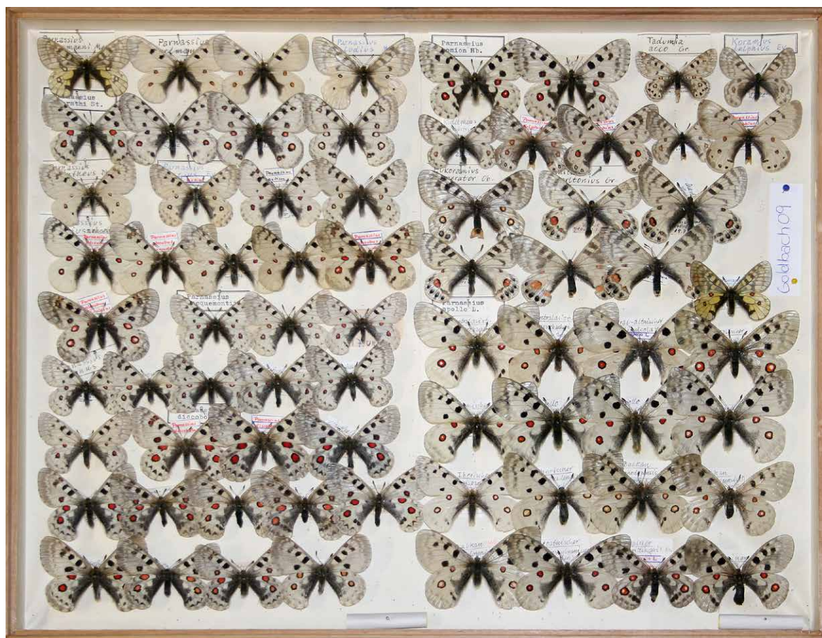
Abb. 2 | Kasten Nr. 09 aus der Sammlung G. Goldbach: Apollofalter (Papilionidae).