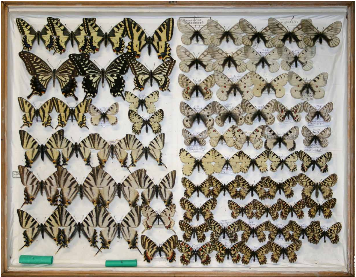
Abb. 1 | Kasten Nr. 01 aus der Sammlung G. Goldbach: Ritterfalter (Papilionidae).