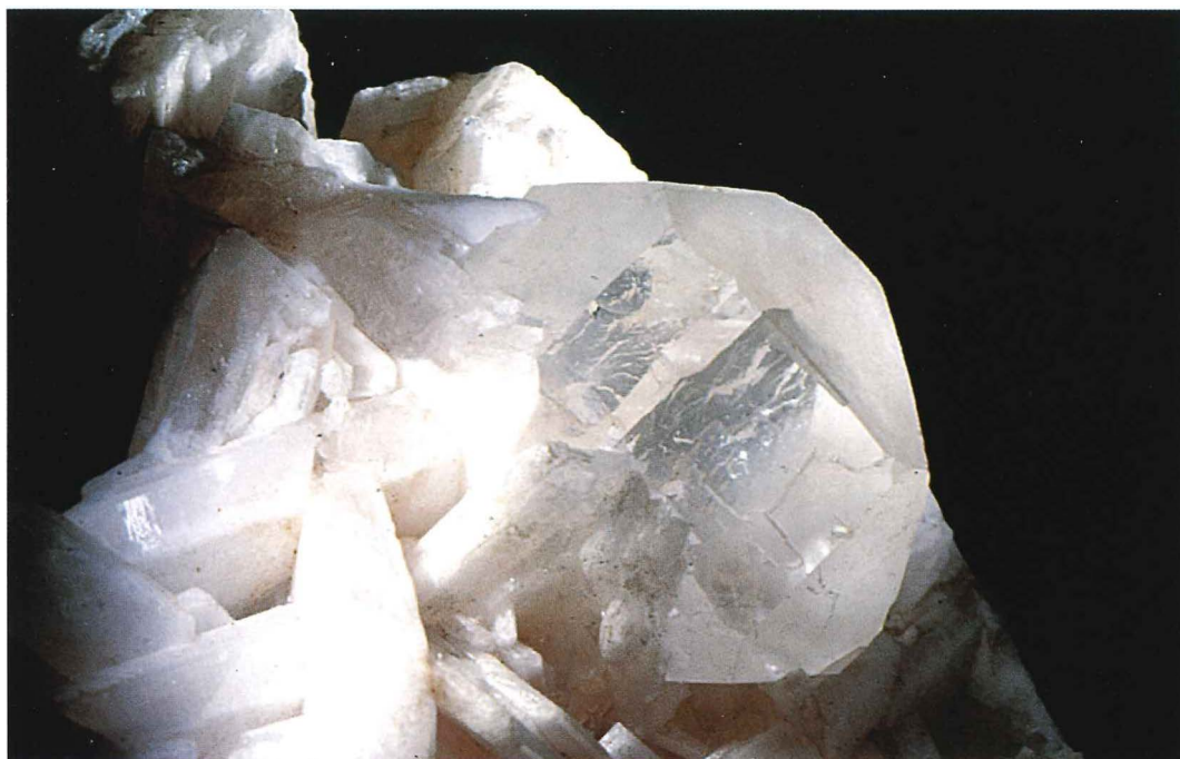
Abb. 8: Fluorit, Baryt , Grube „Hühn“ b. Trusetal, Inv.-Nr. 01/6, Ausschnitt 6 x 6 cm