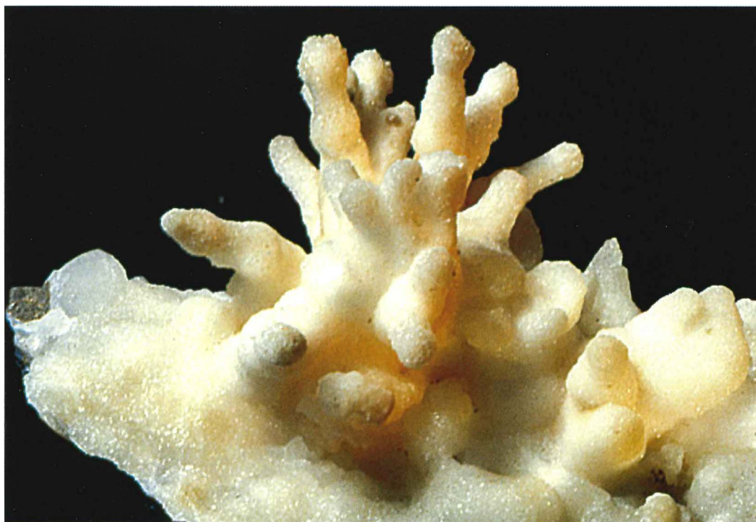
Abb. 9: Aragonit (Eisenblüte) , Tagebau „Kochenfeld“ b. Trusetal, Inv.-Nr. 01/23, Höhe 4 cm