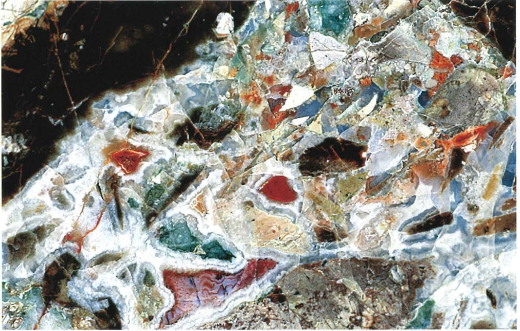
Abb. 4: Ausschnitt aus Abb. 3