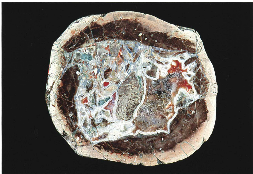
Abb. 3: Rhyolithkugel , Baumgartental b. Thal, Inv.-Nr. 02/134, Ø 10 cm