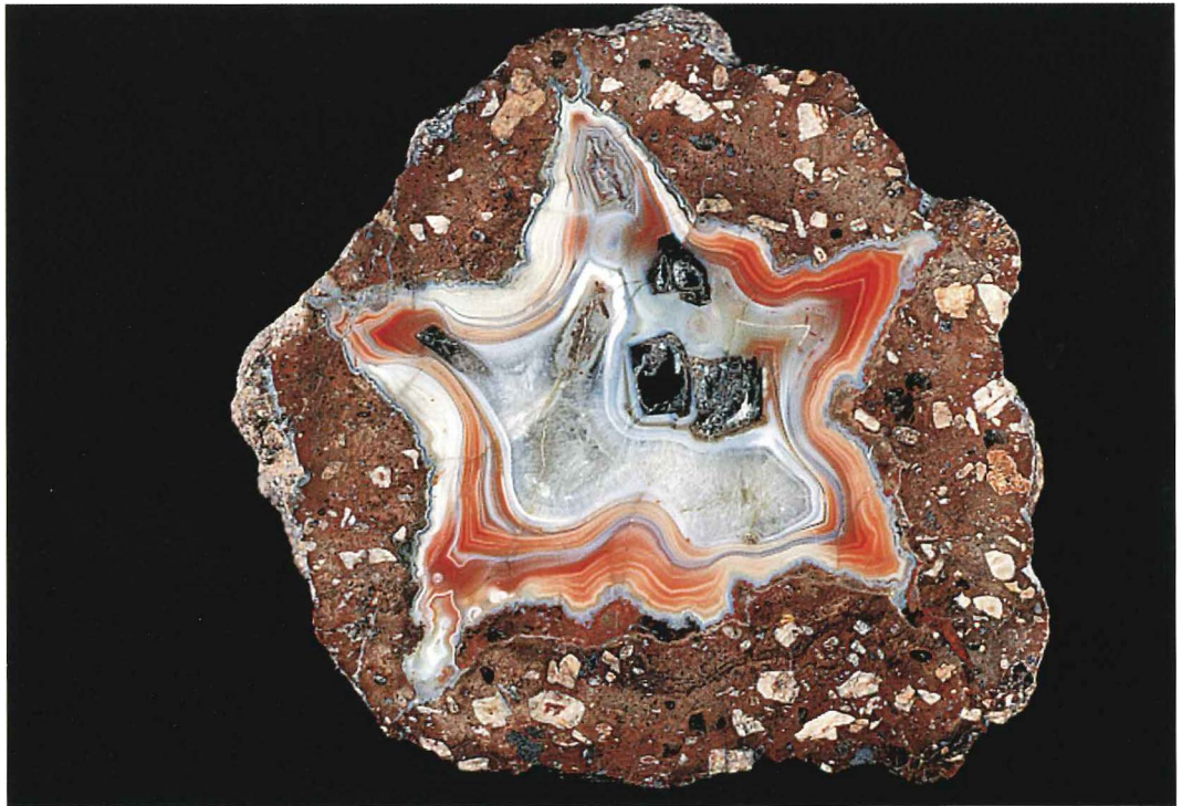
Abb. 5: Rhyolithkugel , Mönchstal b. Luisenthal, Inv.-Nr. 02/173, Ø 9 cm