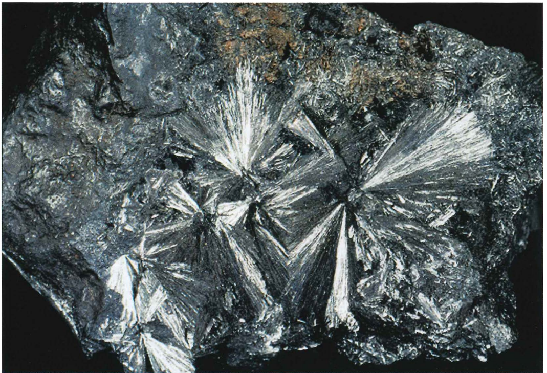
Abb. 7: Pyrolusit, Jüchnitzgrund b. Arlesberg, Inv.-Nr. 01/39, Bildbreite 8 cm