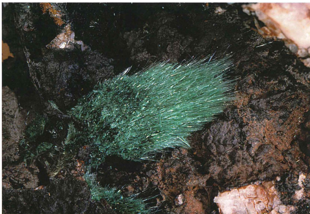
Abb. 11: Malachit , Grube „Stahlberg“ b. Seligenthal, Inv.-Nr. 01/20, Bildhöhe 1,5 cm,