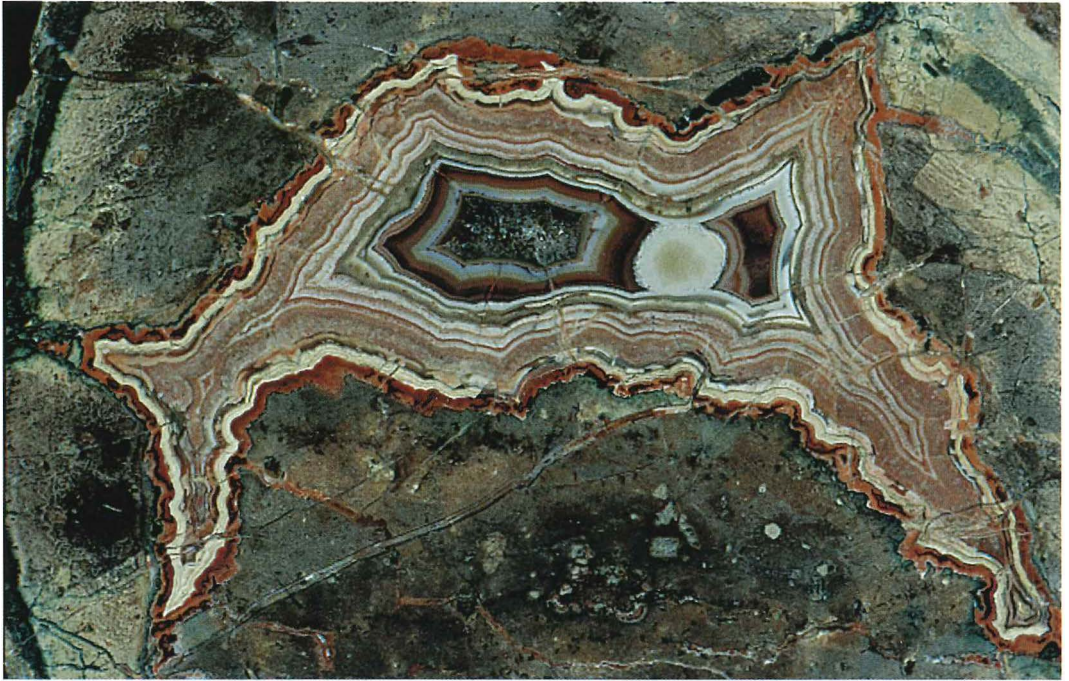
Abb. 6: Achat in Rhyolithkugel, Baumgartental b. Thal, Inv.-Nr. 02/129, Bildbreite 8 cm