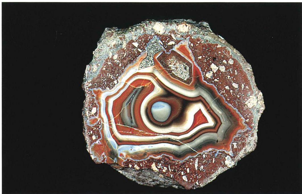
Abb. 2: Rhyolithkugel , Felsenschlag b. Gehlberg, Inv.-Nr. 01/117, Ø 7 cm