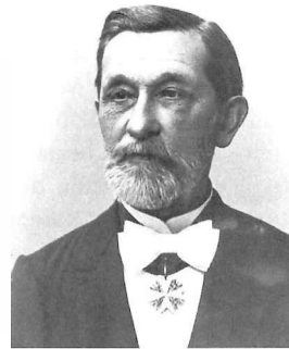
Foto 2: Maximilian Georg von Hopffgarten