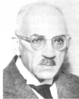
Foto 7: Dr. Paul Blüthgen