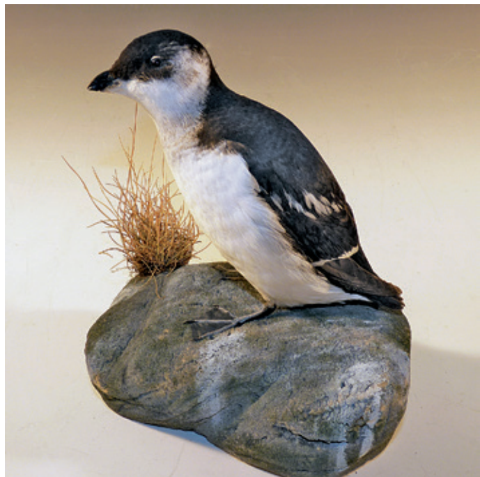
Abb. 15: Krabbentaucher Alle alle , Inv.-Nr. NME 93/158

Syrnhaptes paradoxus - H, 90/130, Thüringen, Neumark b. Weimar*, 29.04.1888, H. Koch