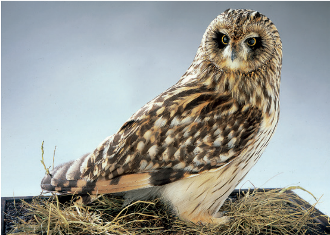
Abb. 18: Sumpfohreule Asio flammeus , Inv.-Nr. NME 03/008.

Athene noctua - H, S, 09/018**, Tierhaltung, F. Robiller, Weimar, 14.01.2009