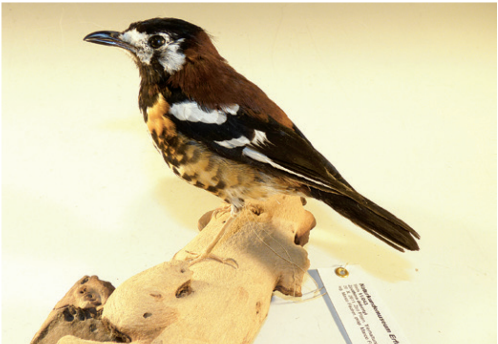
Abb. 24: Sumbawadrossel, Zosterops dohertyi , Inv.-Nr. NME 11/043