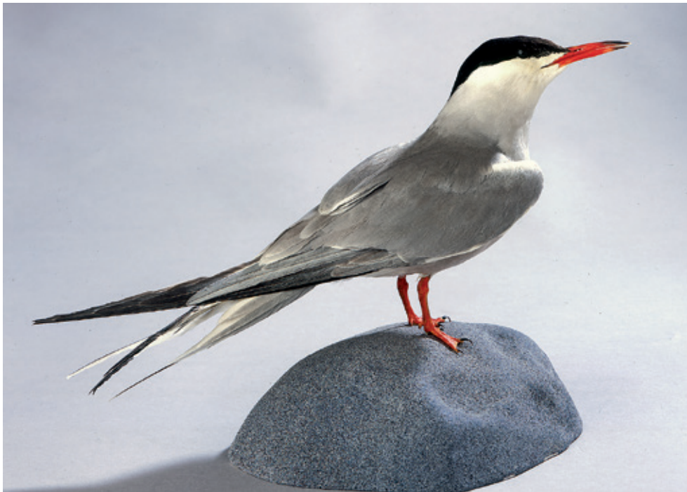
Abb. 14: Küstenseeschwalbe Sterna paradisaea , Inv.-Nr. NME 12/052.