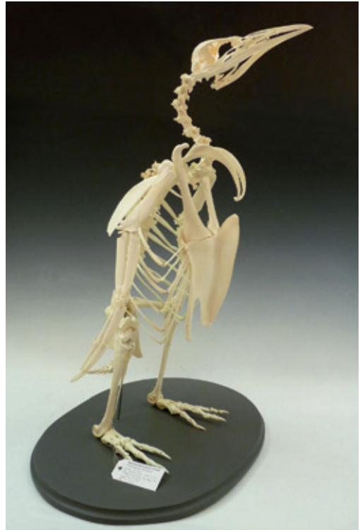
Abb. 7: Skelett des Königspinguins Aptenodytes patagonicus , Inv. Nr. NME 12/047

Aptenodytes patagonicus - S, (Haut), 12/047, Antarctica, South Shetlands, King-George-Insel, Fildes Peninsula, 21.12.2011, M. Stelter (Abb. 7)