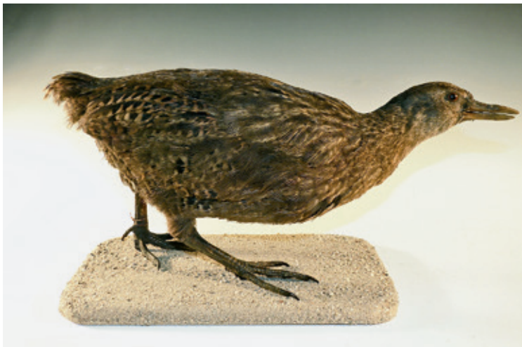
Abb. 10: Wekaralle Gallirallus australis , Inv.-Nr. NME 07/028