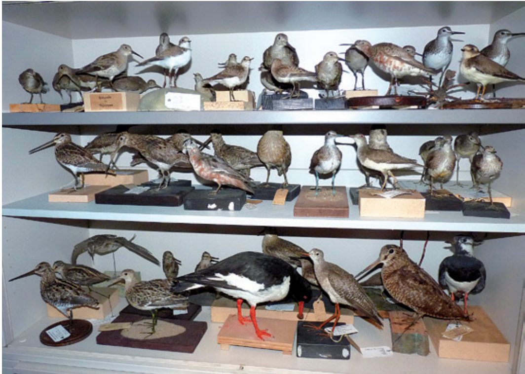
Abb. 12: Teil der Habituspräparate von Limicolen