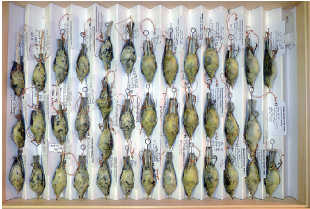
Abb. 21: Blick in die Balgsammlung der Gattung Phylloscopus