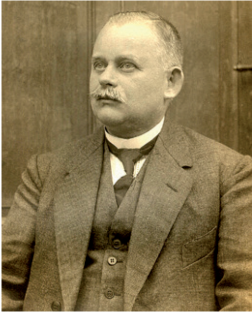
Abb. 2: Otto Rapp (1878–1953)