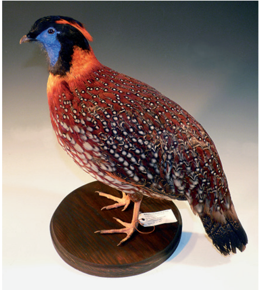
Abb. 6: Temmincktragopan Tragopan temminckii , Inv.-Nr. NME 99/006

Crossoptilon mantchuricum - H, 96/193, Tierhaltung, Slg. R. Schlothauer, Erfurt, 25.01.1940