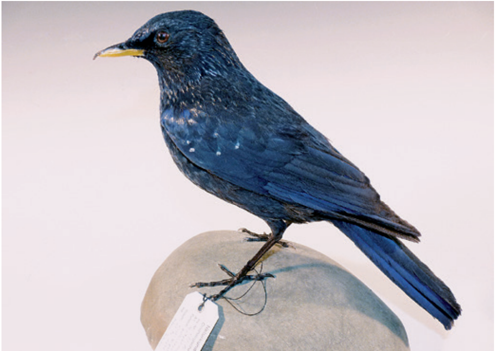
Abb. 23: Purpurfeidrossel Myophonus caeruleus , Inv.-Nr. NME 97/080