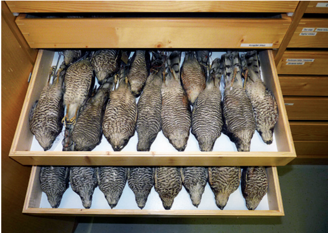
Abb. 8: Sperber Accipiter nisus in der Balgsammlung des NME