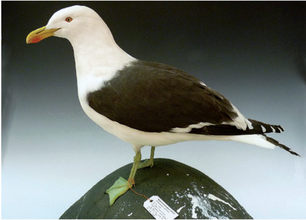
Abb. 13: Dominikanermöwe Larus dominicanus , Inv.-Nr. NME 04/080