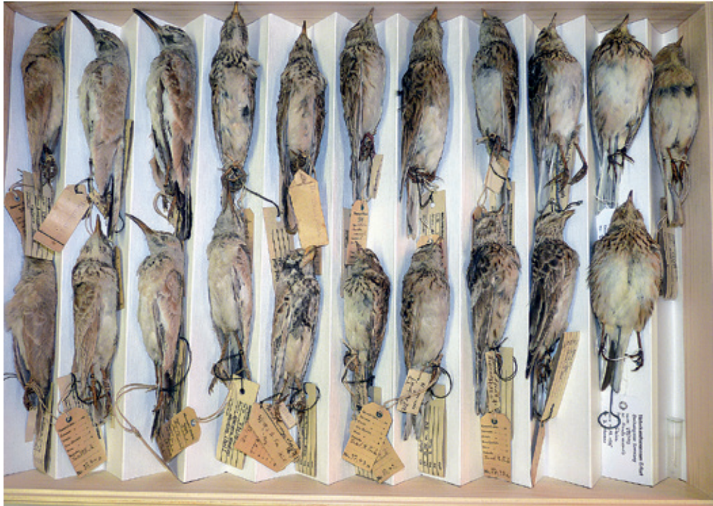
Abb. 20: Blick in die Balgsammlung afrikanischer Lerchen