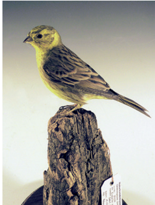
Abb. 28: Goldammer Emberiza citrinella , Inv.-Nr. NME 93/057

Pheucticus chrysopleus - H, 09/049**, Tierhaltung K. Breitenau, Erfurt, Juli 2007