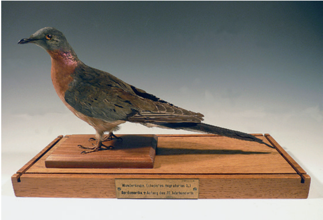
Abb. 16: Wandertaube Ectopistes migratorius , Inv.-Nr. NME 96/232