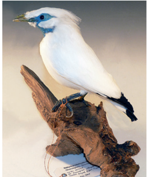
Abb. 22: Balistar Leucopsar rothschildi , Inv.-Nr. NME 01/006