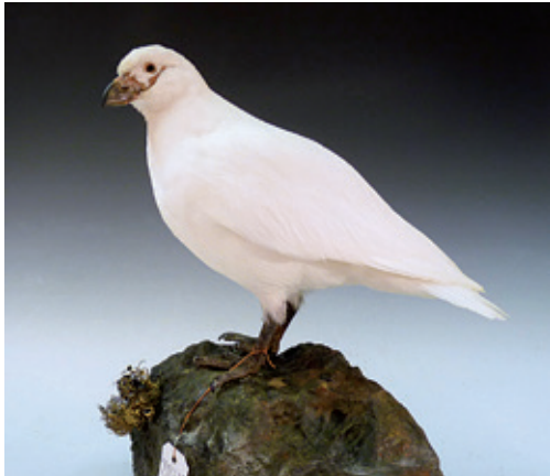
Abb. 11: Weißgesichtsscheidenschnabel Chionis alba , Inv.-Nr. NME 02/034