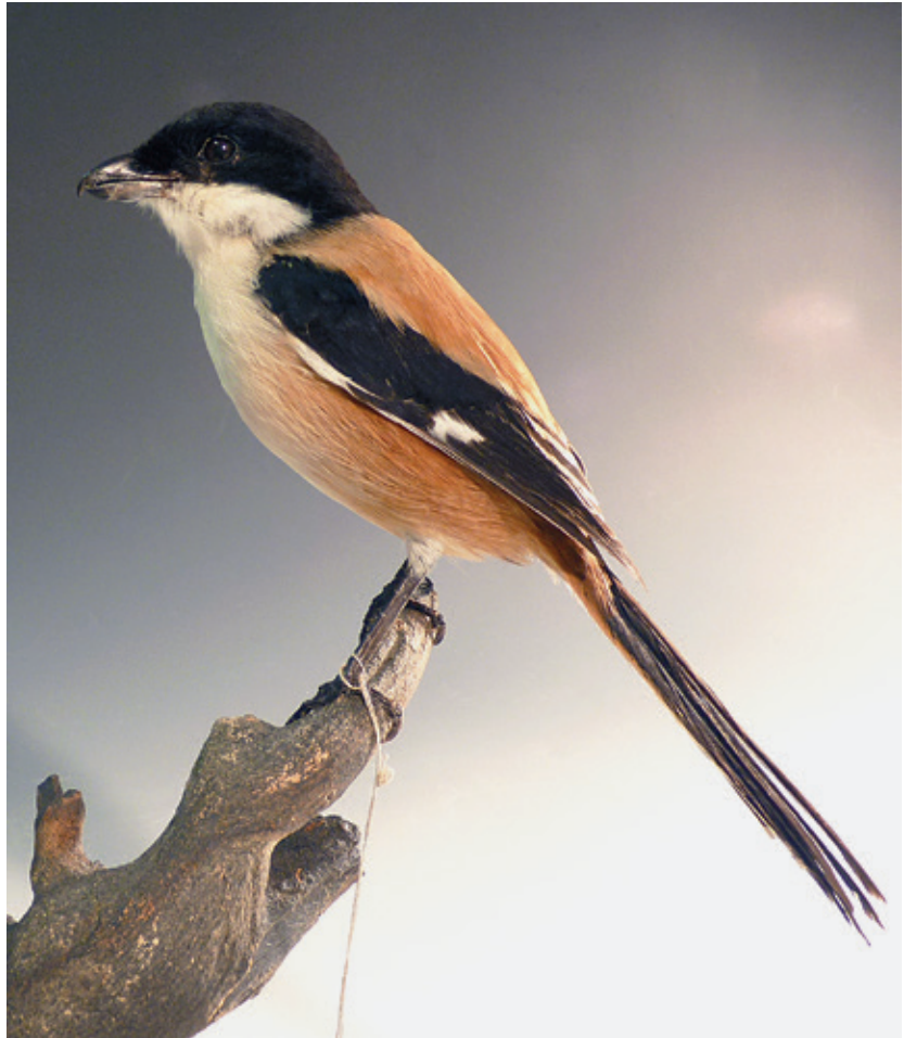
Abb. 19: Schachwürger Lanius schach tricolor ; Inv.-Nr. NME 12/043

Garrulus glandarius - B, S, 96/157, Thüringen, Heyda b. Ilmenau, 22.05.1993 Garrulus glandarius - B, S, 12/015**, Thüringen, Ingersleben/ Lkrs. Gotha, 29.01.2012, J. Kaiser Garrulus glandarius - B, 05/041**, Thüringen, Erfurt-Mitte*, 05.04.2005, T. Bierwisch Garrulus glandarius - B, S, 06/077**, Thüringen, Bad Liebenstein, 31.05.2000 Garrulus glandarius - 1 E, 96/417, Thüringen, Erfurt, Steiger, 20.04.1924, Slg. M. Timpel Garrulus glandarius - 5 E, 02/068, Thüringen, Erfurt, Steiger*, 05.05.1925, Slg. M. Timpel Garrulus glandarius - H, 93/035, ohne Daten, R. Diebitz Garrulus glandarius - H, 93/159, Thüringen, Niedertrebra b. Apolda, 27.10.1993, O. Klopffleisch Garrulus glandarius - H, 94/015, ohne Daten, R. Diebitz Garrulus glandarius - H, 91/594, Thüringen, Zeulenroda/ Saale-Orla-Kreis, Anfang 1987, H. Schaller Garrulus glandarius - H, S, 99/052, Thüringen, Ort?, 04.09.1999, D. Koch Garrulus glandarius - S, 96/655, Thüringen, Erfurt, Umgebung, 1930, G. Plate Garrulus glandarius - S, 96/656, ohne Daten, Slg. M. Timpel Garrulus glandarius - S, 09/003**, Thüringen, Erfurt-Nord, Anf. 2007