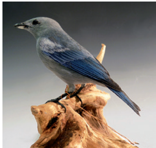
Abb. 29: Blautangare Thraupis episcopus , Inv.-Nr. NME 03/115