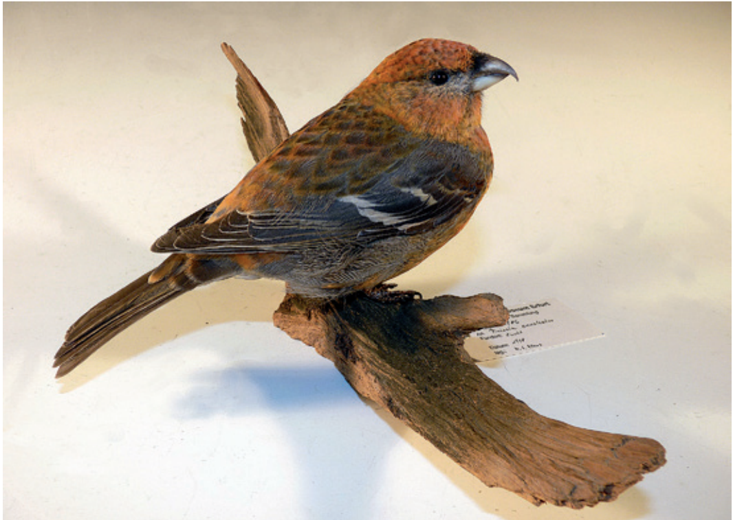
Abb. 27: Hakensimpel Pinicola enucleator , Inv.-Nr. NME 05/086

Carduelis cannabina - H, 96/327, Thüringen, Arnstadt, Nov. 1964, Tschinkel