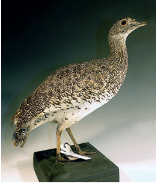
Abb. 9: Zwergtrappe Tetrax tetrax , Inv.-Nr. NME 94/040