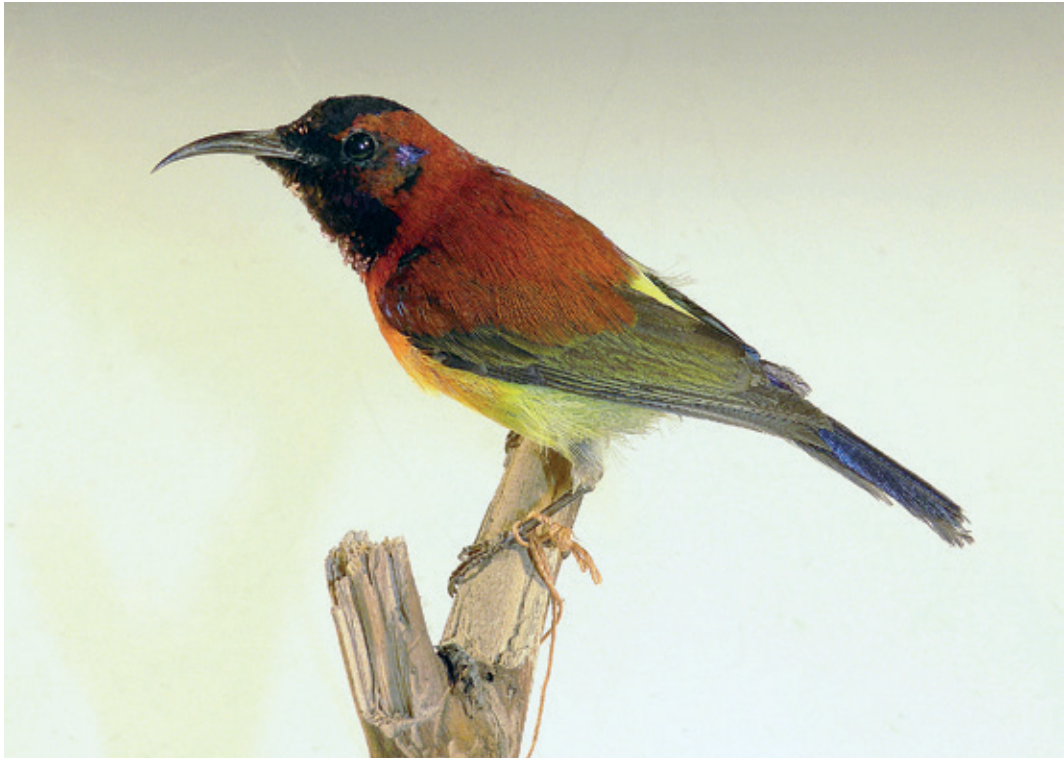
Abb. 26: Gouldnektarvogel Aethopyga gouldiae , Inv.-Nr. NME 03/004