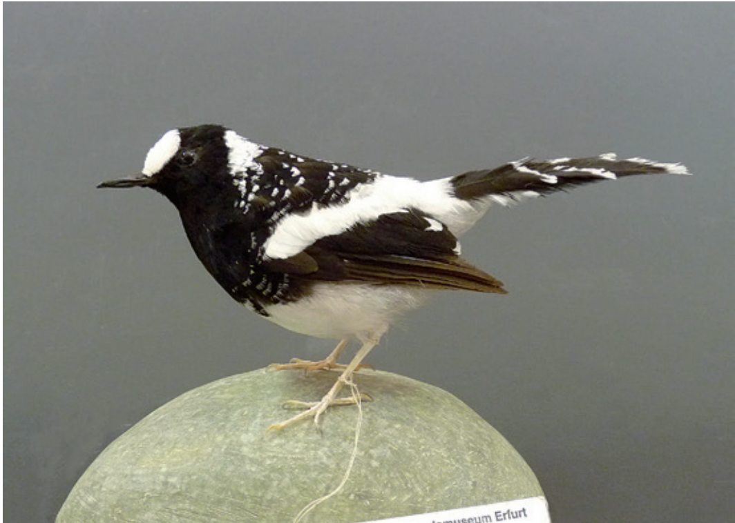
Abb. 25: Fleckenscherschwanz Enicurus maculatus , Inv. Nr. NME 97/087

Rhyacornis fuliginosa - B, 05/035**, Nepal, bei Simikot, Soli-Khola*, 22.06.2001, M. Fischer