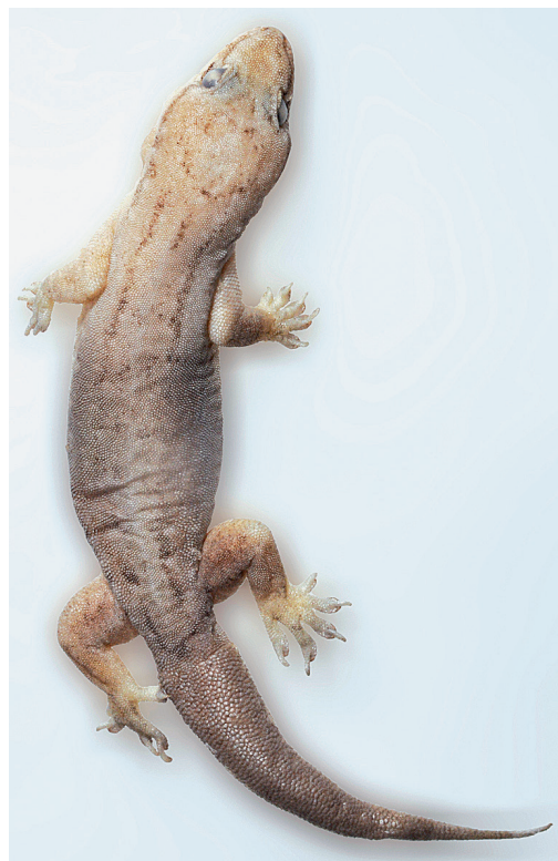
Abb. 3: Hemidactylus aquilonius vom Phou Fa (Laos) – NME R 870/13.

NME R 870/13 – Männchen, Phou Fa, Prov. Phongsali,