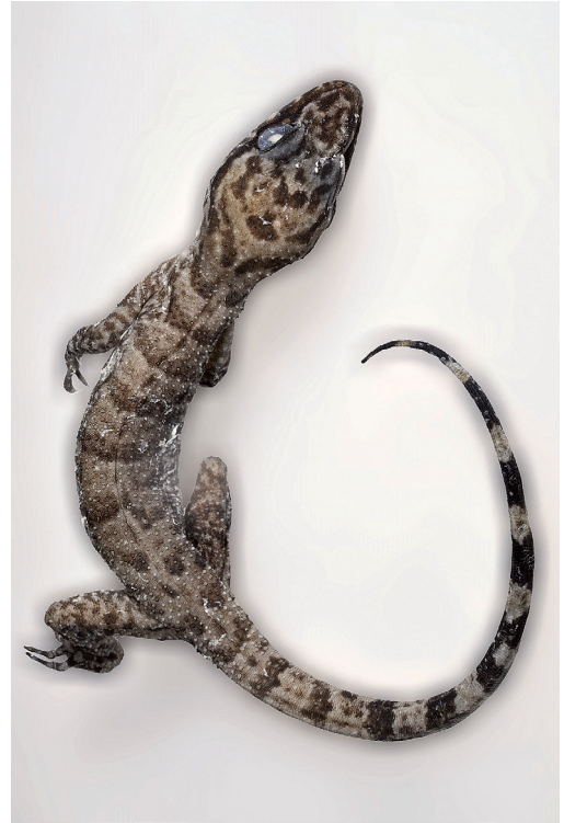
Abb. 1: Papua-Bogenfingergecko ( Cyrtodactylus papuensis ) von Misool - Erstfund außerhalb Neu-Guineas.

NME R 869/13 – juvenil, Ban Wang Yao, Ressort am Nationalpark Nam Nao, Prov. Phetchabun, Thailand, 16°44'53"N, 101°26'17"E; leg. Ulrich Scheidt & Thomas Ihle, 16.10.2007–17.10.2007.