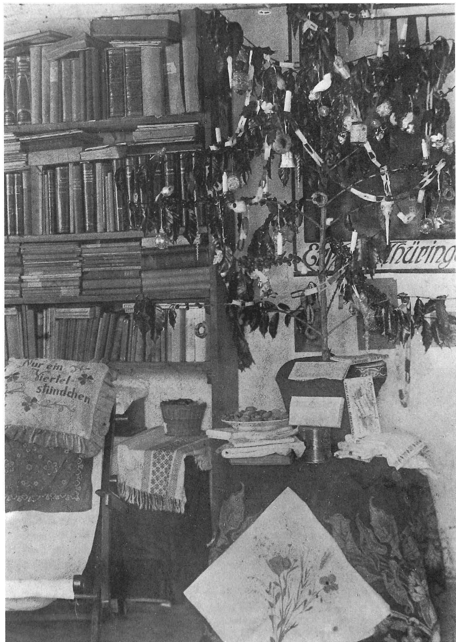
Abb. 3 Weihnachten 1919 in Santa Joanna/Espiritu Santo