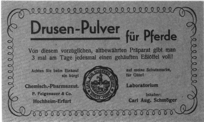
Abb. 6 Etiketten der Fabrikate von C. A. SCHMÖGER