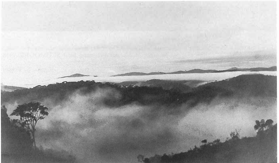
Blick von der Kirche zu Jequitiba 790 m ü. d. M. auf das Frühnebelmeer. Am Horizont Bergland am Rio Doce. Santa Leopoldina 1918

Anschrift des Verfassers : G.-R. Riedel Naturkundemuseum Hospitalplatz 15 Erfurt 5020