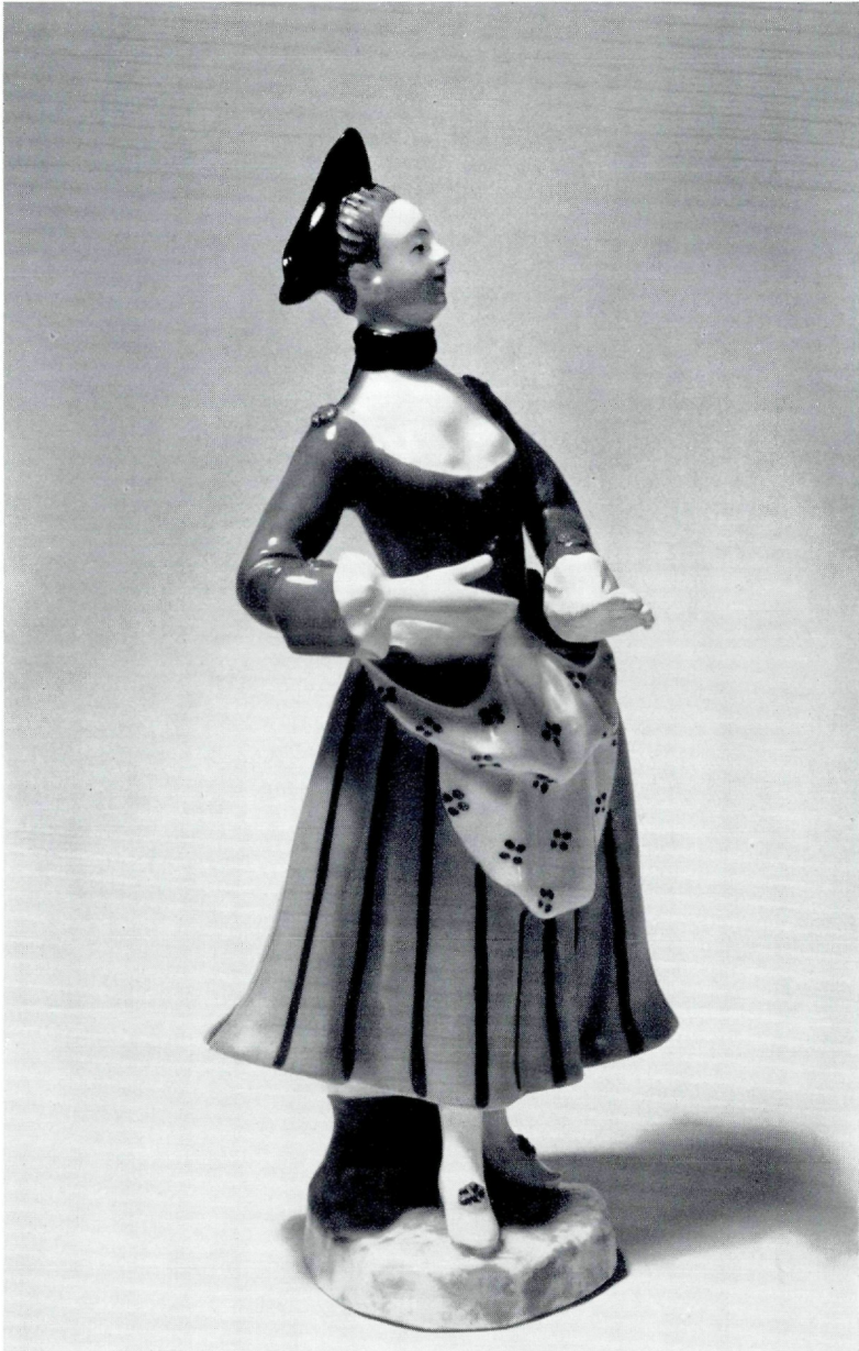
Abb. 4. Wien, um 1740, Porzellanfigurine „Schäferin“ (Inv. Nr. K 1037)