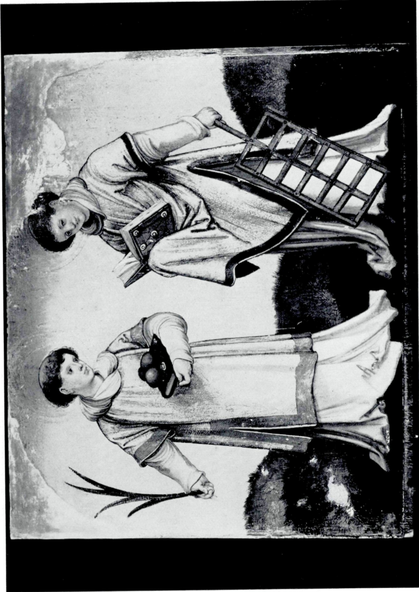
Abb. 1. Hans Schäuufflein, Hl. Laurentius und Stefanus (Inv. Nr. 1529)