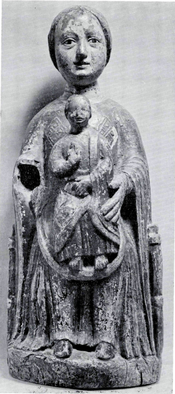
Abb. 1 Brixen, 1. Hälfte 13. Jh., Madonna mit Kind