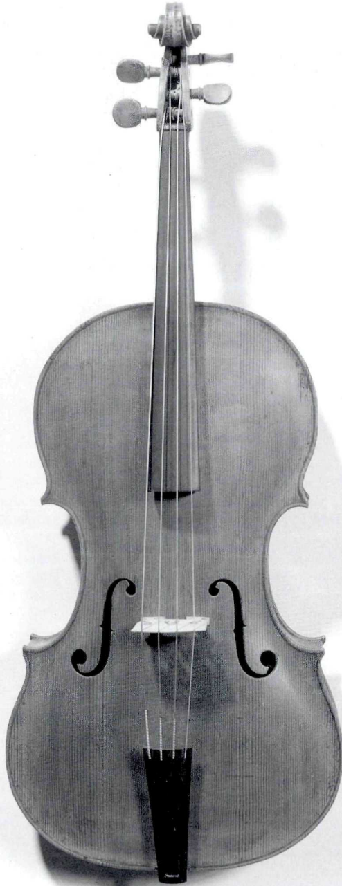
Jakob Stainer, Viola, 1649