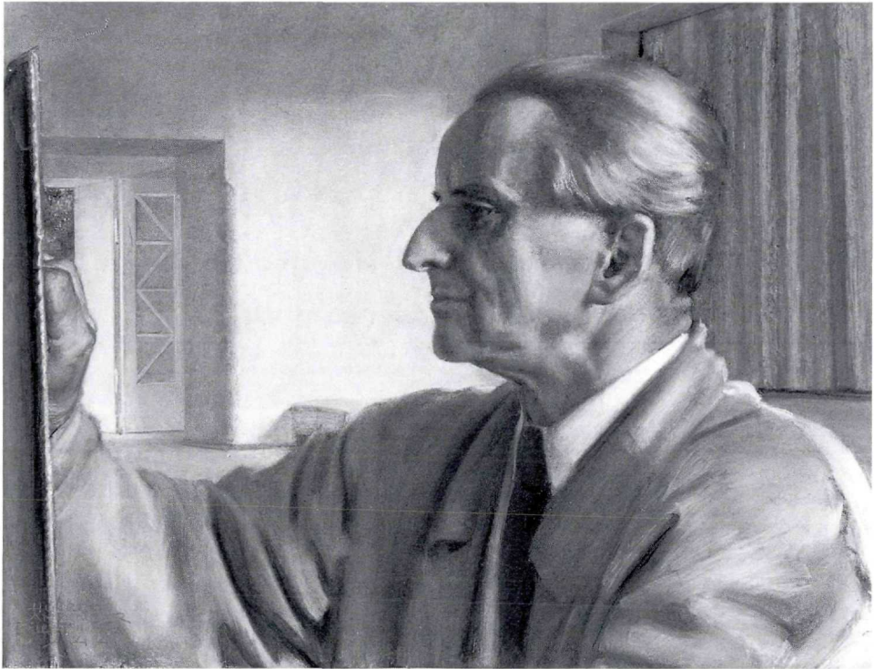
Hubert Lanzinger, Selbstbildnis, 1944 (Legat von Frau Pia Lanzinger)

Andreas Scharf, »A little mistake«, 1986, Öl auf Baumwolle, Spanplatte, Flugobjekt, Gesamtmaß 69,5 x 55,2 cm; Inv. Nr. Gem 3683 (Leihgabe des Landes Tirol)