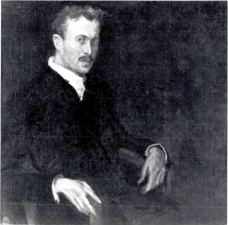
Max Oppenheimer, Bildnis Adolf Loos, 1906 (Leihgabe der Österreichischen Ludwig-Stiftung für Kunst und Wissenschaft, Wien)

Franz Helmer, Das zerbrochene Dach, 1987, Holzschnitt, 179 x 253 mm; Inv. Nr. H 301 (Leihgabe des Landes Tirol)