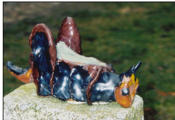
Abb. 13: Heuschrecke stilisiert, aus glasiertem und gebranntem Ton, „sitzt“ auf einem Granitfeiler vor dem Museumsgelände „Wossidlo-Haus“, erstes Wossidlo-Museum in Walkendorf bei Tessin.

Auch wenn Charles Darwin mit seiner Evolutionstheorie die bisherigen Auffassungen der Menschheit zur Geschöpfungsgeschichte des Lebens vom Sockel stürzte, so hat er für unsere Menschheit damit Großartiges geleistet. Die Entstehung des Universums ist aber für den Autor nach wie vor ein Schöpfungsprozess unvorstellbarer Größe.