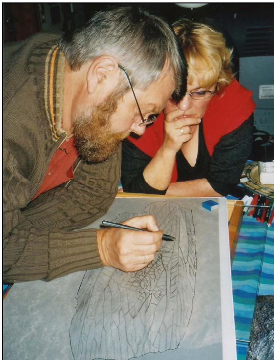
Abb. 12: Schmerzhafterweise mussten so manche zeichnerischen Entwürfe verworfen oder erneut verändert werden.

Am Ende zählt aber das vorliegende Ergebnis mit der zeichnerischen Darstellung.