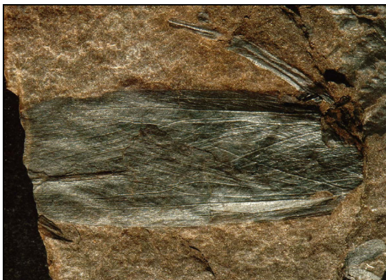
Abb. 7: Über diesen Fund berichtet ein Beitrag in der SVZ vom 11. Januar 2008 mit dem ersten Foto der Ur-Heuschrecke aus der Steinkohlenzeit

Die Abbautechnologien waren veraltet und unwirtschaftlich geworden. Aber das Plötzer Steinkohlenrevier „blühte“ jeweils nach den beiden Weltkriegen auf. Die grubentechnischen Einrichtungen wurden verbessert und modernisiert. Die 1,20 m mächtige Sohle bei Plötz wurde nach dem I. Weltkrieg zur Hauptförderstrecke ausgebaut und neue Schächte abgeteuft. Nach dem II. Weltkrieg konnten die stehen gebliebenen Restkohlefelder durch den Einsatz neuer Bruchbaustreben abgebaut werden. Die Effektivität der Ausbeute konnte durch die Produktion nicht zuletzt von „Plötzer Eierkohlen“ gesteigert werden! Das Niederbringen von zahlreichen Bohrungen in diesem Steinkohlenrevier ermöglichte neue Steinkohlenfelder zu erschließen.