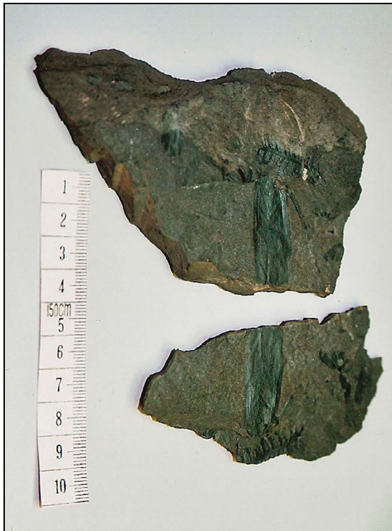
Abb. 4: Der ungewöhnliche Insektenabdruck von der Kegelhalde Plötz vor der Präparation

Zur Zeit des Oberkarbons lagen die Festlandmassen weit südlich von ihren heutigen Positionen und waren zu zwei Urkontinenten vereinigt, nämlich Laurasia , das sich später in Nordamerika, Europa und den Hauptteil Asien aufspaltete und Gondwana (Afrika, Antarktis, Australien, Indien und Südamerika). Die heutigen Fossilagerstätten z. B. Mazon Creek (USA), Montcauu-les-Mines (Kanada), Fundstätten im Saarbecken, in Großbritannien und in Böhmen lagen alle in der Nähe des Äquators und Mazon Creek lag näher an Europa als heute. Dies erklärt u. a. die Ähnlichkeit der Fauna und Flora mit den europäischen Funden im heutigen Mitteleuropa und Nordamerika. Durch die Äquatornähe lagen diese Fundstätten, also alle in einem klimatisch feuchten, fast subtropischen Klima.