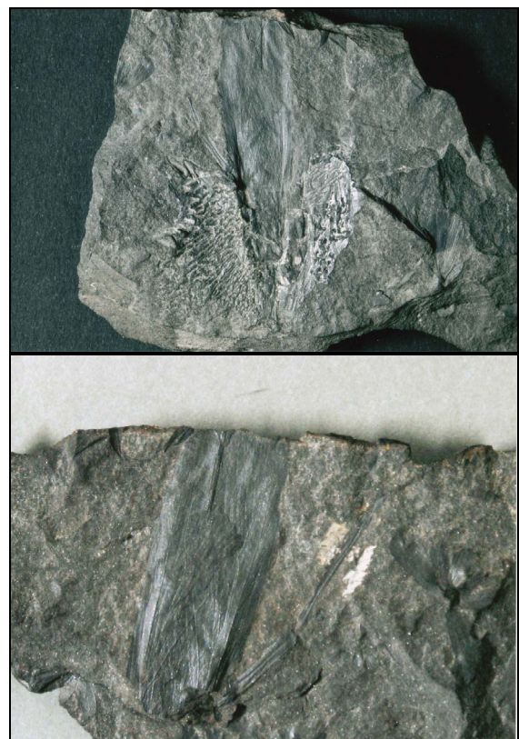
Abb. 8.1 und Abb. 8.2: Freilegung von Einzelheiten durch die Präparation an beiden Stücken (Abdruck und Gegenabdruck der fossilen Ur-Heuschrecke).

Die Abbautechnologien waren veraltet und unwirtschaftlich geworden. Aber das Plötzer Steinkohlenrevier „blühte“ jeweils nach den beiden Weltkriegen auf. Die grubentechnischen Einrichtungen wurden verbessert und modernisiert. Die 1,20 m mächtige Sohle bei Plötz wurde nach dem I. Weltkrieg zur Hauptförderstrecke ausgebaut und neue Schächte abgeteuft. Nach dem II. Weltkrieg konnten die stehen gebliebenen Restkohlefelder durch den Einsatz neuer Bruchbaustreben abgebaut werden. Die Effektivität der Ausbeute konnte durch die Produktion nicht zuletzt von „Plötzer Eierkohlen“ gesteigert werden! Das Niederbringen von zahlreichen Bohrungen in diesem Steinkohlenrevier ermöglichte neue Steinkohlenfelder zu erschließen.