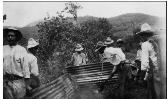
Abb. 2: Bekämpfung von Heuschreckenschwärmen auf der Finca St. Isabell im Hochland Alta Verapaz Aufnahme: W. Westendorff, Guatemala von 1933

Heuschrecken in dein Land kommen lassen; die werden die Oberfläche des Erdbodens so bedecken, dass man den Erdboden nicht mehr wird sehen können, und sollen alles auffressen was von dem Hagelwetter (die siebte Plage) verschont geblieben und euch noch übrig gelassen ist....“ So sprach Mose zum Pharao (ca. 1200 Jahre vor Christus) im Auftrage des Herrn (Gott), um den Auszug der Israeliten aus Ägypten zu erreichen.