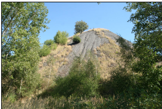
Abb. 1: Die Halde Plötz, der Fundort der „Urheuschrecke“