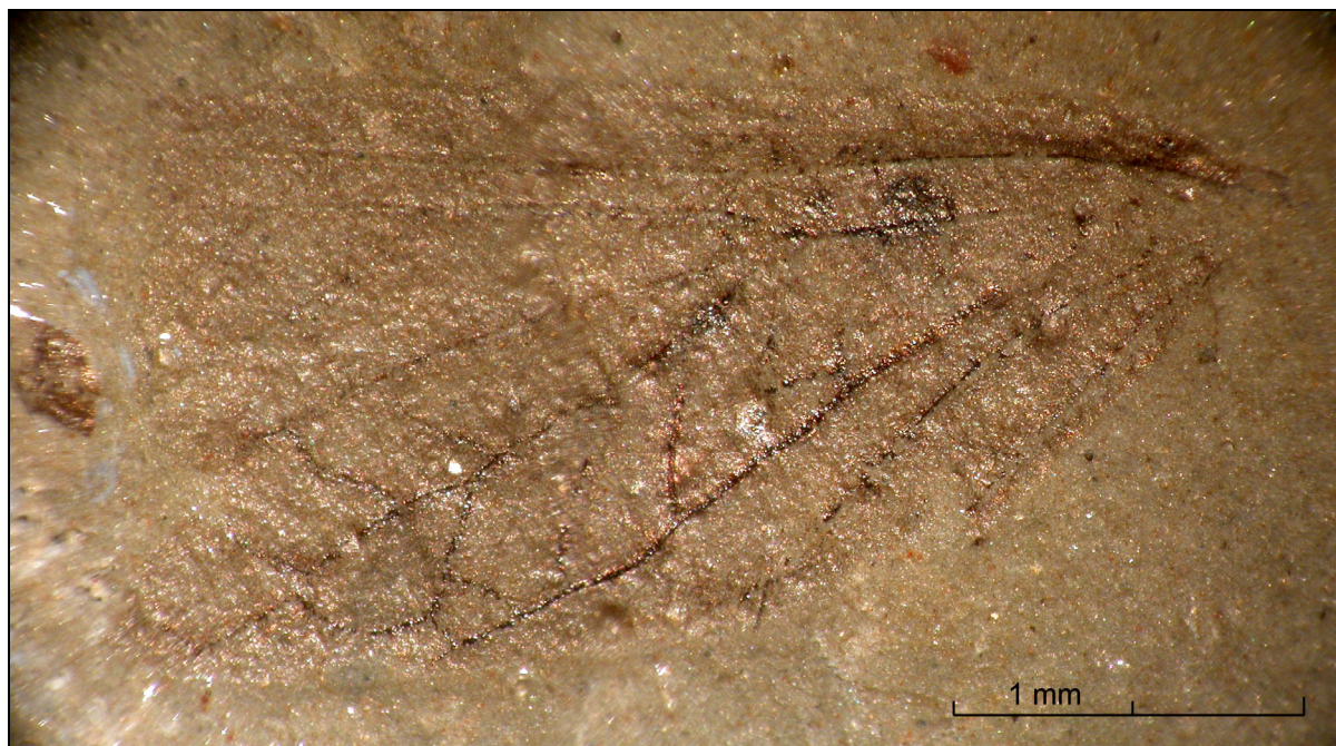
Abb. 4: Basis von Mallorcagryllus hispanicus n. gen. et n. sp. aus dem Unteren Buntsandstein der Insel Mallorca, Spanien; Sammlung Zessin (SZ) BM 1/2

Beschreibung: Erhalten ist die basale Hälfte (6,1mm) eines Vorderflügels. Gesamtflügelänge ca. 12 mm. Vorderrand gerade. Subcostalfeld (Sc-Feld, zwischen den Adern CA+CP+SCA und SCP) und Praeradialfeld (PrR-Feld, zwischen R und SC) etwa gleich breit. Im Sc-Feld und im PrR-Feld schwache Queradern erkennbar, die rechteckige Zellen bilden, deren Ordinatenwert (x-Achse) kleiner als der Abszissenwert (y-Achse) ist. RP beginnt im basalen Viertel des Flügels. Im Interradialfeld (IR-Feld, zwischen RA und RP+MA) sind vier Queradern erkennbar, die lang rechteckige Zellen bilden (x-Wert größer als y-Wert). RP+MA gestielt, mit mehr als drei Ästen (vermutlich fünf bis sechs). Zellen im Praemedialfeld (PrM-Feld) sowie im Medialfeld (M-Feld) ebenfalls lang rechteckig, MP einfach, soweit erhalten. Der proximale Teil der CuA erscheint als schräge Querader im PrCu-Feld. Hintere Äste von CuA leicht s-förmig geschwungen. Im Praeanalfeld (PrA-Feld) drei Queradern erkennbar, die lang rechteckige Zellen bilden, mit Ausnahme der hinteren, die fast ein rechteckiges Dreieck bildet. Queradern einfach, im Interanalfeld (IA-Feld) eine Doppelzelle bildend.