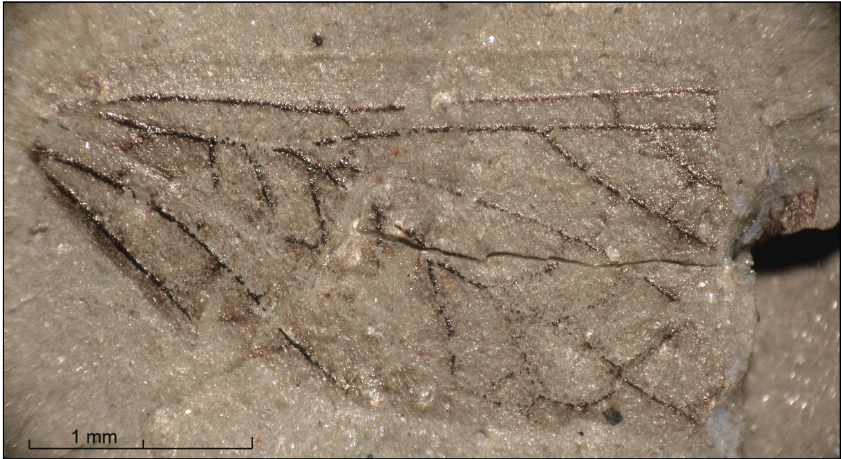
Abb. 2: Mallorcagryllus hispanicus n. gen. et n. sp. aus dem Unteren Buntsandstein der Insel Mallorca, Spanien; Sammlung Zessin (SZ) BM 1/1