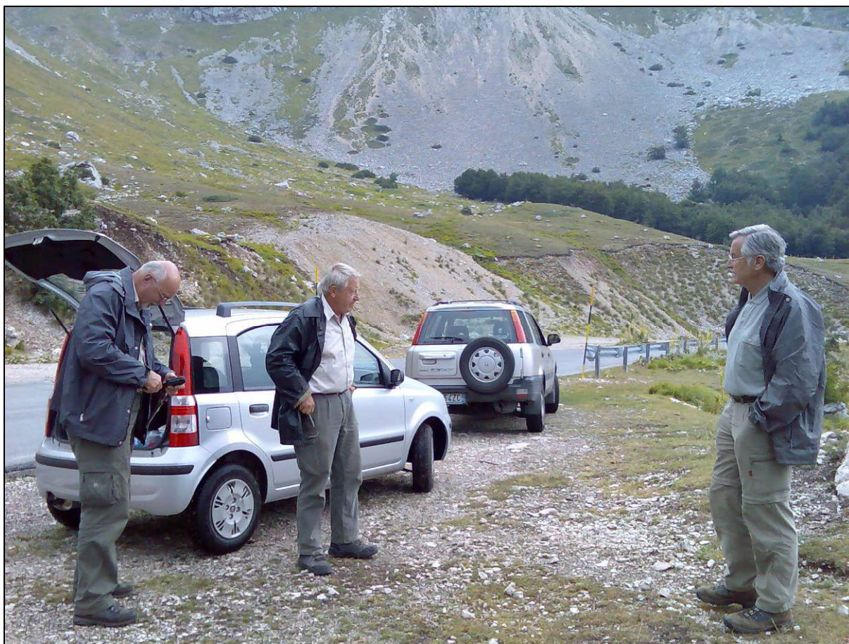
Abb. 8: Auf Käferexkursion in den Bergen der Toscana, Italien

Darin konnte er feststellen, dass die ältesten Nachweise von Schmetterlingen bereits im unteren Jura (Lias, vor ca. 190 Millionen Jahren) von England vorkommen ( Abb. 3 ). Von dort sind auch erstmals Schuppen auf den Flügeln dieser Ur-Schmetterlinge nachgewiesen.