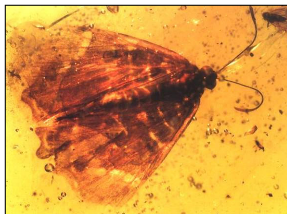
Abb. 7: Eine Riodinide ( Volutia dramba ) aus dem miozänen Dominikanischen Bernstein. Nach GRIMALDI & ENGEL (2005)