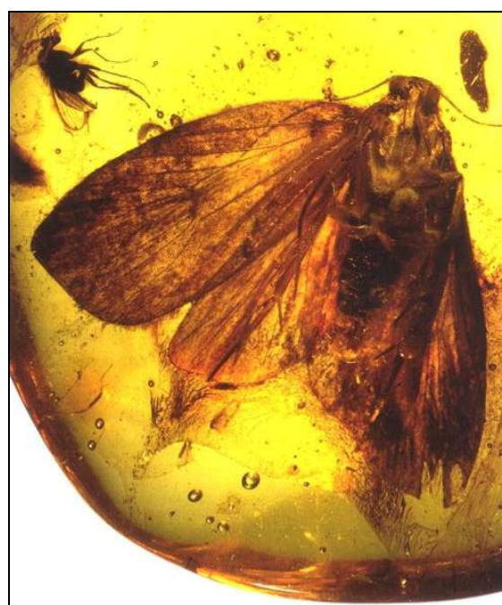
Abb. 6: Oecophoridae (Gelechioidea) aus dem eozänen Baltischen Bernstein, Vorderflügelänge 8,2 mm. Die Larven vieler Oecophoridae sind detritivor. Nach GRIMALDI & ENGEL (2005)