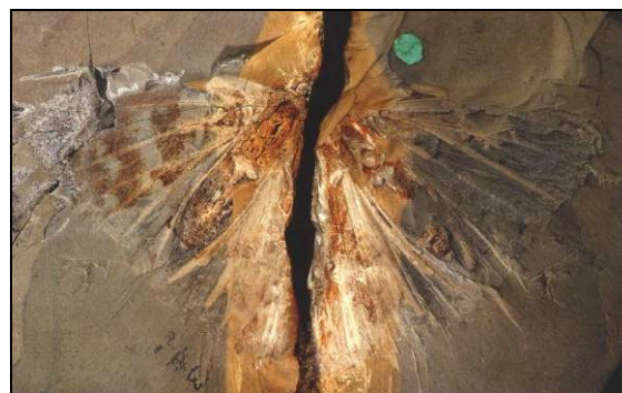
Abb. 5: Ein Abdruck einer ?Lycaenidae ( Lithopsyche antiqua ) aus dem Bembridge Mergel, Eozän oder frühes Oligozän der Insel Whight, England. Sie wurde vom Erstbeschreiber Butler, 1889 zu den Geometridae gestellt. 1980 stellt Jarzembowski den Fund in die Riodininae.