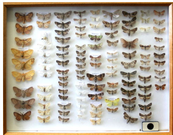
Abb. 3: Heyden's Eulenkasten aus Jasnitz