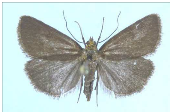
Abb. 4: Evergestis aenealis (16 mm) (Nr. 6507)

6507 -aenealis ([DENIS & SCHIFFERMÜLLER], 1775) Grünz 01.08.2003 (6F) (HOPPE); Krummenhägener See 24.08.2004 (2F) (TABBERT)