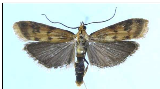
Abb. 2: Homoeosoma sinuella (16 mm) (Nr. 6072)

6072 Homoeosoma sinuella FABRICIUS, 1793 neu für MV. Prora 2002 (10F), 15.06.2003 (20F), 29.06.2009 (3F) (TABBERT)