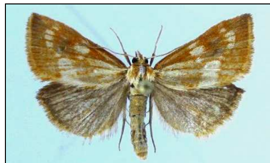
Abb. 3: Epascestria pustulalis (17 mm) (Nr. 6464)

6464 Epascestria pustulalis (HÜBNER, 1823) 15.06. - 16.07. Umg. Neustrelitz 2000 (1F) (HOPPE); Neustrelitz 2006 (4F), 2010 (2F) (BAUMGARTEN); Neustrelitz 2011 (1F) (TABBERT)