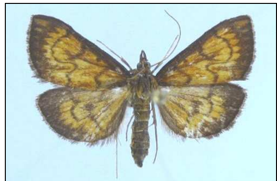
Abb. 5: Ecpyrrhorrhoe rubiginalis (16 mm) (Nr. 6588), Foto: U. Deutschmann, Buchholz

6588 Ecpyrrhorrhoe rubiginalis (HÜBNER, 1796) neu für MV, Altwarp 15.07.2007, Jatznick 17.07.2006 (TABBERT); Grünz 01.08.2003 (HOPPE)