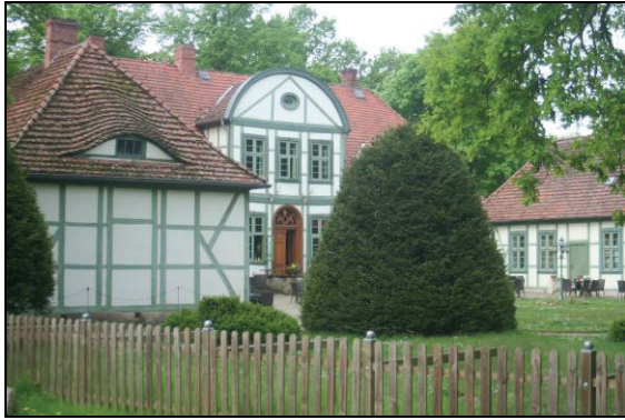
Abb. 12: Jagdschloss Friedrichsmoor Friedrichsmoor ist das einzige Dorf, das innerhalb der Lewitz liegt, alle anderen reihen sich um die Lewitz auf höher gelegenen Flächen.