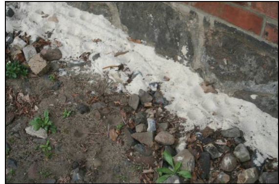
Abb. 3: Die Trichter befinden sich auch im humushaltigen feinen Sand und zwischen den Steinen. Insgesamt konnten am Haus, bevorzugt an der Ostseite, 120 Trichter am 1.5.12 gezählt werden.

Die Ausbringung des Sandes erfolgte bereits im Winter 2011/12. Der Laupiner Sand (acht Millionen alte Flussablagerungen des Flusses Eridanus, der aus dem baltisch-finnischen Raum kam und seine Sedimente bis in die Niederlande transportierte) ist äußerst fein und besteht nahezu ausschließlich aus Quarzkörnchen. Der natürliche Untergrund in Jasnitz besteht ebenfalls aus feinkörnigem Schwemmsand, gut geeignet, um die Ansiedlung von Ameisenlöwen zu befördern.