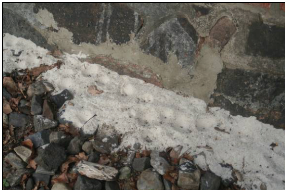
Abb. 2: Große Ansammlung von Trichtern des Ameisenlöwen ( Euroleon nostras ) am 1.5.12

Die Ausbringung des Sandes erfolgte bereits im Winter 2011/12. Der Laupiner Sand (acht Millionen alte Flussablagerungen des Flusses Eridanus, der aus dem baltisch-finnischen Raum kam und seine Sedimente bis in die Niederlande transportierte) ist äußerst fein und besteht nahezu ausschließlich aus Quarzkörnchen. Der natürliche Untergrund in Jasnitz besteht ebenfalls aus feinkörnigem Schwemmsand, gut geeignet, um die Ansiedlung von Ameisenlöwen zu befördern.