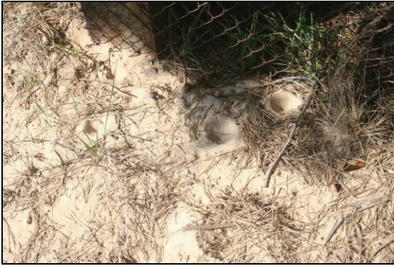
Abb. 6: Ameisenlöwentrichter unter Kiefern am Kraaker Waldsee. Von diesem Vorkommen (ZESSIN, 2007) wurden die Larven entnommen und an der Küstentanne in Jasnitz wieder ausgebracht. Es handelt sich um die Art Euroleon nostras .