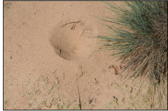
Abb. 15: Einzelner Trichter von Myrmeleon bore auf dem Hühnerberg bei Garwitz