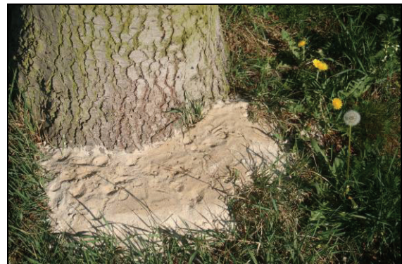
Abb. 4: Ameisenlöwentrichter an der Ostseite einer Küstentanne auf dem Grundstück Lange Str. 9 in Jasnitz am 2.5.12., kurz nach dem Einbringen der Ameisenlöwen. Sie wanderten kreuz und quer durch den Sand.