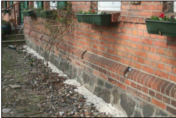
Abb. 1: Ausgebrachter Laupiner Sand an der Ostseite des Hauses in Jasnitz, Lange Str. 9