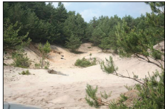
Abb. 17: Quarzsandgrube Laupin. Hier fanden sich ebenfalls vereinzelt Trichter von Ameisenlöwen ( Myrmeleon bore ) auf den freien Sandflächen.