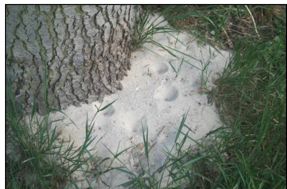
Abb. 5: Ameisenlöwentrichter an der Ostseite einer Küstentanne auf dem Grundstück Lange Str. 9 in Jasnitz am 19.5.12. Nun hat sich die Lage beruhigt und die Trichter sind ortsfest.