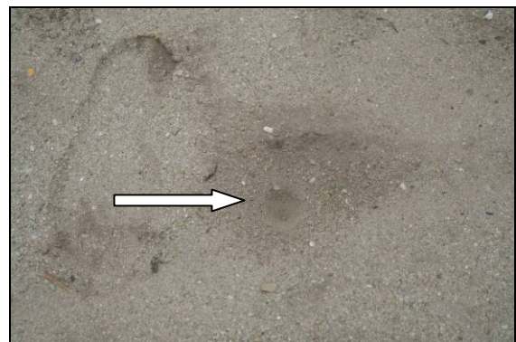
Abb. 18: Ameisenlöwentrichter ( Myrmeleon bore ) in der Sandgrube Laupin (Pfeil)