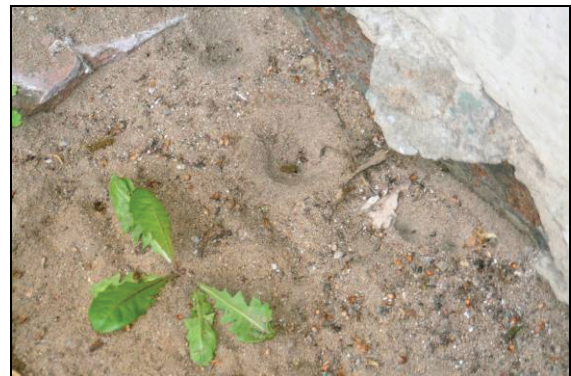
Abb. 11: Ein kleines Vorkommen des Ameisenlöwen ( Euroleon nostras ) am Friedrichsmoorer Jagdschloss, 11.5.12. Es befand sich an der Ostseite des Schlosses. Durch die davor liegende Straße und das Gebäude mit Garten auf der anderen Straßenseite ist der freie Platz groß genug, um das Vorkommen in den späten Vormittag- und Mittagstunden für einige Zeit von der Sonne bescheinen zu lassen.