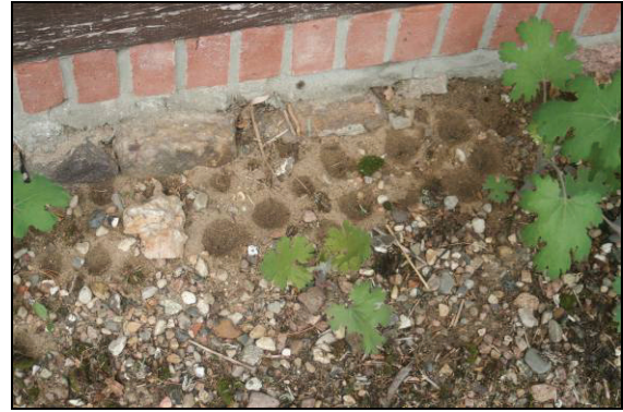
Abb. 9: Ameisenlöwentrichter an der Ostseite der Wiesenmeisterei Tuckhude bei Neustadt-Glewe.