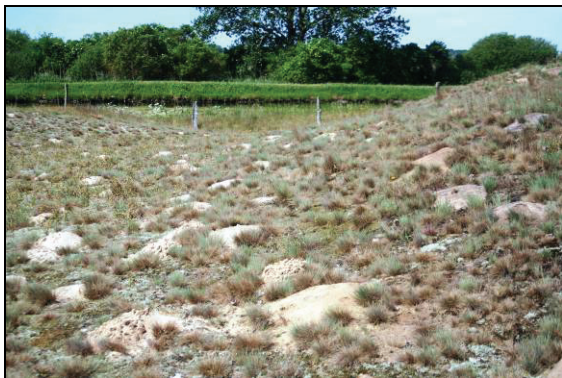
Abb. 13: NSG Hühnerberg bei Garwitz, bzw. Rusch in der Lewitz. Über diese nacheiszeitliche Binnendünenbildung gibt es eine interessante Erfassung der Pflanzengesellschaft von RIBBE (1973). In den Maulwurfshaufen fanden sich 32 Trichter von Ameisenlöwen ( Myrmeleon bore ).