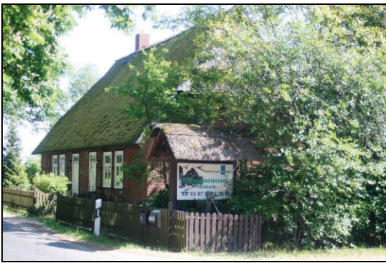
Abb. 7: Wiesenmeisterei Tuckhude bei Neustadt-Glewe (28.5.12)