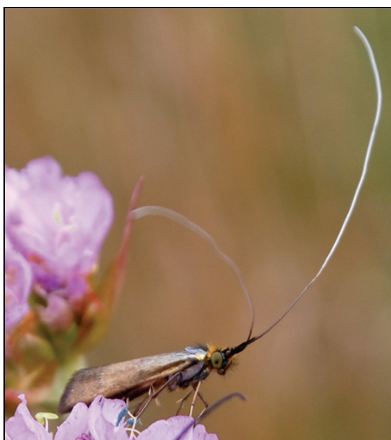
Abb. 1 Nemophora metallica an Flockenblume ( Centaurea ssp.)

In der vorliegenden Arbeit stellt der Autor seine Beobachtungen nach 1980 bis einschließlich 2012 in Mecklenburg vor.