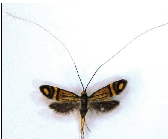
Abb. 2: N. oxsenheimerella (12 mm)

342 Nemophora oxsenheimerella (Hübner, 1813) In Mecklenburg wird die Art selten gefunden. Nachweise gibt es bisher aus Ventschow, Crivitz, Herrsburg, Rubow, Cambs und Plate bei Schwerin. 2012 wurde ein Exemplar aus aufgesammelten Fichtenzapfen gezogen. Ob das Tier nun aus dem Zapfen kam oder der Raupensack am Zapfen anhaftete, konnte nicht geklärt werden.