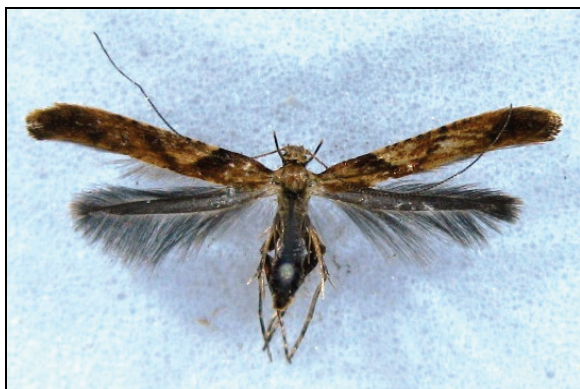
Abb. 1: Caloptilia hemidactyla (10 mm)

Beim Abstreifen eines Spitz-Ahornbaumes ( Acer platanoides ) an der Landstraße nach Buchholz bei Rubow im Landkreis Ludwigslust-Parchim am 10.10.2012 fand der Autor ein Weibchen der Blätttütentmotte Caloptilia hemidactyla . Eine Genitaluntersuchung wurde durchgeführt. Nach den vorliegenden Unterlagen wurde die Art in Mecklenburg-Vorpommern letztmalig 1899 von Stange (PATZAK, 1986) bei Neustrelitz nachgewiesen.