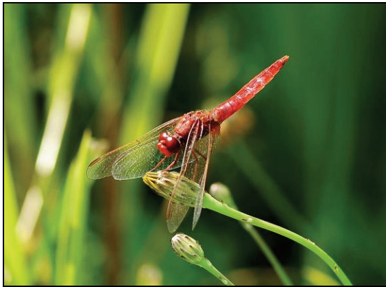
Abb. 1 Ein Männchen der Feuerlibelle in der „Obeliskstellung“ am 30.06.2012 im LSG Schlosspark Ludwigslust