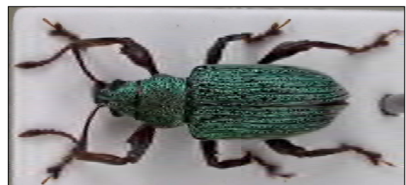
Abb. 34: Parascythopus exulans Hejerman & Magnano, 2000

Sie finden sich beide an diversen Zypressengewächsen in Wohngebieten mit Einzelhäusern und vor allem auf Friedhöfen und sind dann meist in Anzahl, teilweise auch gemeinsam an ihren Fraßpflanzen anzutreffen. Mittlerweile konnten bis zu acht Nachweise in Schleswig-Holstein erbracht werden, allerdings fehlen noch Funde aus dem Niederelbegebiet und Mecklenburg.