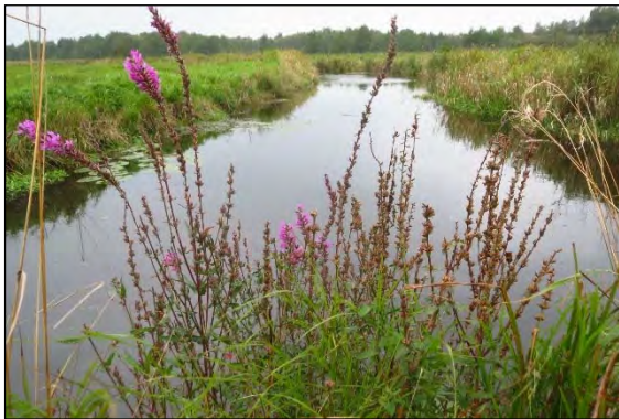
Abb. 30: Varreler Moor/CUX

Nanomimus circumscriptus (Aubé, 1864) – Diese Art ist mit 2,5 bis 3mm der große Bruder der vorigen und wurde in Norddeutschland erstmalig am 17.5.2013 in den Elbwiesen bei Hamburg-Moorburg festgestellt (Th.Schmidt).