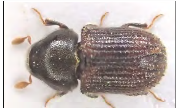
Abb. 27: Phloeosinus aubei (Perris, 1855) – Bargteheide/OD 3.6.2014 (Zi)

die ersten Meldungen für das nördliche Niedersachsen im Frühjahr 2014 im Forst Karrenzien im Amt Neuhaus/LG. Auf diese Art sollte auch in Mecklenburg geachtet werden. Geeignete Lebensräume bieten vor allem Friedhöfe, wo die Wacholder oftmals frei und sonnenexponiert stehen und dann in sommerlichen Trockenphasen dem Käfer nicht immer gewachsen sind.