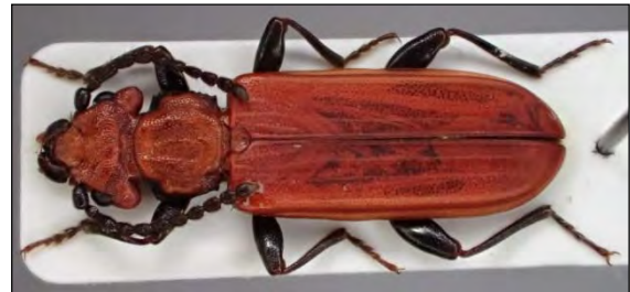
Abb. 17: Cucujus cinnabarinus (Scopoli, 1763) – Schwerin-Friedrichsthal, 1.12.2009

Saperda candida Fabricius, 1787 – Mit Sicherheit ist diese 20 bis 25 mm große Bockkäferart in Deutschland, ja in Europa ein Exote. Seine Heimat ist Nordamerika. Dort ist diese Art ein gefürchteter Schädling in Obstkulturen, vor allem an Apfelbäumen, daher auch sein deutscher Name: „Rundköpfiger Apfelbaumbohrer“. Er wurde 2008 auf der Insel Fehmarn bei Puttgarden entdeckt. Die Art entwickelt sich dort in Weißdorn und auch in der angepflanzten Schwedischen Mehlbeere ( Sorbus intermedia ). Die Käfer befallen lebende Bäume und können diese zum Absterben bringen. Der Fraß der Larven geschieht im Holz und der Befall wird erst deutlich durch ein kreisrundes Ausschlupfloch. Durch intensive Bekämpfungsmaßnahmen seitens