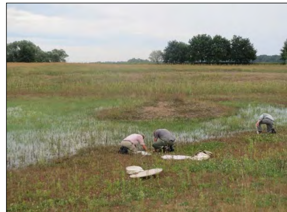
Abb. 28: Feuchtgebiet bei Laasche/DAN 4.8.2014 (Zi)

Nanophyes globulus (Germar, 1821) – Ein Winzling unter den Rüsselkäfern mit einer Körperlänge von nur 1,2 bis 1,5 mm ist der seltene „Schwarzschenklige Zwerg-Stirnaugenrüssler“ (RL D 2). Er lebt monophag an einer ebenfalls seltenen, sehr kleinen und unscheinbaren Pflanze, dem Bachbucgel Peplis portula .