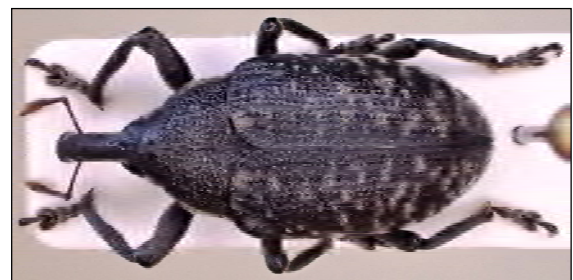
Abb. 38: Larinus sturnus (Schaller, 1783) – Jasebeck/DAN 4.8.2014 (Zi)

Sirocalodes mixtus (Mulsant & Rey, 1858) – Der 3 mm große Westliche Erdrauchrüssler lebt monophag an dem Rankenden Lerchensporn ( Ceratocarpus claviculata ), einer unscheinbaren Pflanze aus der Familie der Erdrauchgewächse, die am Boden von lichten Nadel- und Mischwäldern an wärmebegünstigten Stellen größere Polster bildet. Auch diese Art hat sich nach dem ersten Auffinden in 2004 bei uns im Norden rasch ausgebreitet. Heute ist sie vor allem in den südlichen Bereichen Schleswig-Holsteins und des Niederelbegebietes zahlreich nachgewiesen worden. Meldungen dieser eigentlich süd- und westeuropäisch verbreiteten Art aus Mecklenburg aber auch aus Brandenburg stehen noch aus.