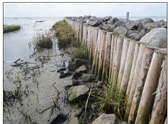
Abb. 8: Sahlenburg bei Cuxhaven/CUX

Agonum viridicupreum (Goeze, 1777) – Auch dieser auffällige, 10 mm große „Bunte Glanzflächläufer“ ist in den letzten Jahren deutlich häufiger gefunden worden. Er braucht wie die vorige Art feuchte Niedermoorflächen und Kleingewässerufer, insofern können auch beide gemeinsam angetroffen werden, wie hier in den Kanalwiesen bei Rondeshagen/RZ.