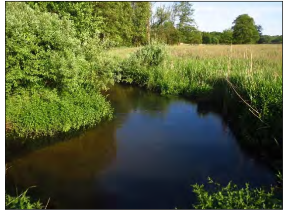
Abb. 6: Die Schmale Aue bei Nindorf/WL