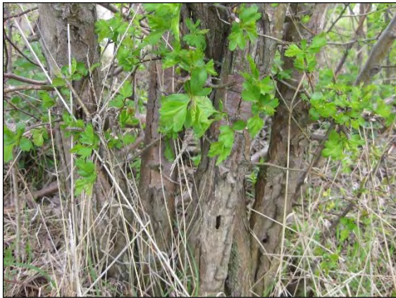
Abb. 18: Exemplar der angepflanzten Schwedischen Mehlbeere ( Sorbus intermedia ) auf der Insel Fehmarn bei Puttgarden

der zuständigen Ämter ist das Vorkommen wohl jetzt erloschen. Das letzte Tier wurde meines Wissens in 2012 aus einem armdicken Ast von bodennahem Weißdorn gezüchtet.