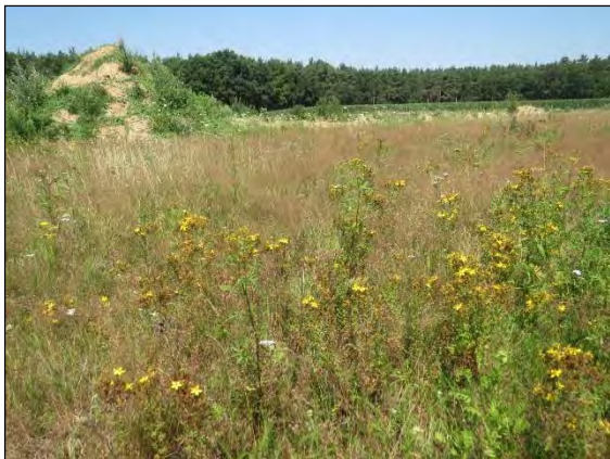
Abb. 10: Trockenfläche bei Lübbow, Kreis Lüchow-Dannenberg

Agrilus hyperici (Creutzer, 1799) – Dieser 5 mm große Prachtkäfer ist ein Neueinwanderer, der aufgrund der klimatischen Veränderungen sich nach Norden ausgebreitet hat und seit 2014 auch den Bereich des niedersächsischen Niederelbegebietes erreicht hat. So wurde er auf den Trockenflächen des Kreises Lüchow-Dannenberg bei den Kiesgruben in Woltersdorf und Lübbow festgestellt. Bevorzugt besiedelt werden sonnenexponierte Wärme- und Trockengebiete. Angewiesen in ihrer Entwicklung ist die Art auf das Vorkommen von Johanneskraut ( Hypericum ), in deren Wurzeln sich die Larven entwickeln.