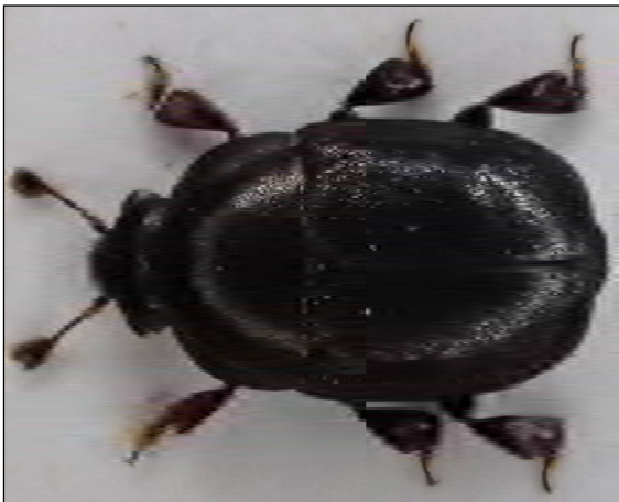
Abb. 15: Meligethes brachialis Erichson, 1845 – Vastorf/LG 27.8.2014 (Zi)

Cucujus cinnabarinus (Scopoli, 1763) – Eine ganz große Rarität unter den Käfern in Deutschland ist der wunderschöne 11 bis 15 mm große „Scharlachkäfer“. Er gilt in Deutschland laut Roter Liste 1998 als vom Aussterben bedroht (RL 1). Seit alters her gab es nur Funde aus Bayern sowie eine fragliche Meldung aus dem Schwarzwald. Aber seit einiger Zeit häufen sich die Meldungen aus Deutschland und die Art ist in den letzten Jahren Richtung Nordwesten bis nach Hessen (2012) und Brandenburg (2014) vorgedrungen. Trotzdem ist es eine kleine Sensation, dass die Art in