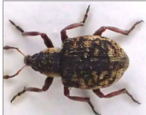
Abb. 42: Stenopelmus rufinasus Gyllenhal, 1835 – Lübeck-Moorgarten 6.7.2014 AK (Zi)

Seine eigentliche Heimat liegt aber in Nordamerika, von wo aus er 1927 erstmalig nach Deutschland verschleppt worden ist. Er lebt im Bereich der großen Flüsse am flutenden Algenfarn ( Azolla filiculides ), einer Pflanze, die schon Ende des 19. Jahrhunderts aus Nordamerika nach Frankreich eingeschleppt wurde und sich seitdem von dort ausgebreitet hat. Sie kommt nur sehr lokal und in jährlich wechselnder Häufigkeit vor. Seit 2007 haben wir ein solches Vorkommen an der Oberelbe am Sandkrug bei Lauenburg/RZ, wo sich der Käfer zu Tausenden entwickelt. Diese Art muss aber über ein gewaltiges Überlebensvermögen verfügen, auf der Suche nach seiner äußerst seltenen Fraßpflanze muss er sehr beweglich, d. h. sehr flugaktiv sein. So gelang denn auch der aktuelle Nachweis mit Hilfe des Autokeschers bei Lübeck-Moorgarten.