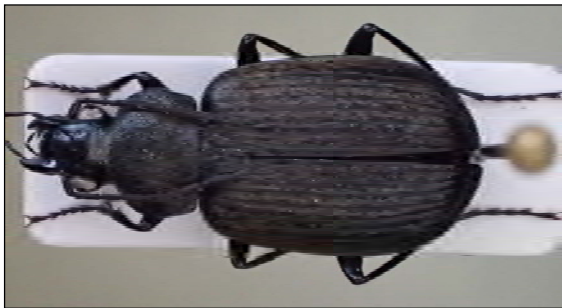
Abb. 4: Chlaenius tristis (Schaller, 1783) – Rondeshagen/RZ 10.7.2014