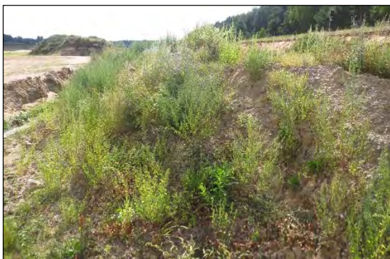
Abb. 20: Kiesgrube bei Neugüster/RZ Aus Mecklenburg liegen noch keine Nachweise vor. Als Lebensraum werden sonnenexponierte Trocken- und Wärmegebiete bevorzugt, so auch Kiesgruben. Man findet die Tiere durch Abkeschern der

Oulema tristis (Herbst, 1786) – Auch bei dieser 3,5 mm großen Blattkäferart ist eine Ausbreitung, bzw. eine Neueinwanderung nach Norddeutschland augenfällig. Noch in der Roten Liste Deutschlands gilt sie als ausgestorben oder verschollen. Dann wurde die Art 1997 in Brandenburg, 2005 in Sachsen-Anhalt, 2008 im Niederelbegebiet und 2010 in Schleswig-Holstein festgestellt.