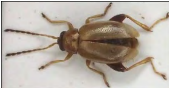
Abb. 25: Longitarsus ballotae (Marshall, 1802) – Lübbow/DAN 5.9.2013 (Zi)

Phloeosinus aubei (Perris, 1855) – Dieser 2,5 mm große Borkenkäfer findet sich wie sein etwas kleinerer Bruder Phloeosinus thujae an Wacholder. Die Larve frisst dort unter der Rinde frisch abgestorbener Äste. Die Art hat sich nach dem Erstfund in Brandenburg 2001 in den letzten Jahren von Südosten her bis zu uns in den Norden ausgebreitet.