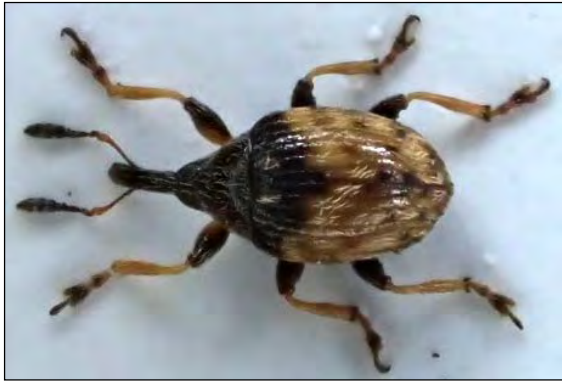
Abb. 29: Nanophyes globulus (Germar, 1821) – Laasche/DAN 4.8.2014 (Zi)

Nanomimus circumscriptus (Aubé, 1864) – Diese Art ist mit 2,5 bis 3mm der große Bruder der vorigen und wurde in Norddeutschland erstmalig am 17.5.2013 in den Elbwiesen bei Hamburg-Moorburg festgestellt (Th.Schmidt).