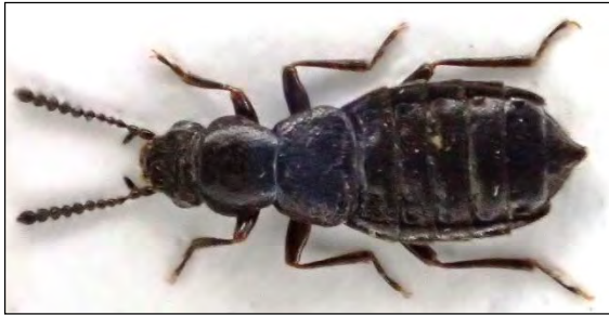
Abb. 9: Micralymma marinum (Ström, 1783)

Am 24.6.2011 erfolgte dann der erste Nachweis an der niedersächsischen Nordseeküste bei Cuxhaven. Die Art findet sich dort, wie auch auf den Halligen, an den Holzpfählen der Bühnen mit Steinpackungen. Bei Hochwasser werden diese Bereiche oftmals überflutet, aber die Tiere überstehen dieses ohne Probleme. Ein Wiederfund im Jahr 2014 bestätigte das Vorkommen bei Cuxhaven. Auf Helgoland konnte die Art jedoch nie wieder nachgewiesen werden.