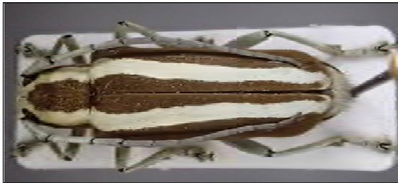
Abb. 19: Saperda candida Fabricius, 1787 – Puttgarden auf Fehmarn/OH 23.6.2012 e. l.

Oulema tristis (Herbst, 1786) – Auch bei dieser 3,5 mm großen Blattkäferart ist eine Ausbreitung, bzw. eine Neueinwanderung nach Norddeutschland augenfällig. Noch in der Roten Liste Deutschlands gilt sie als ausgestorben oder verschollen. Dann wurde die Art 1997 in Brandenburg, 2005 in Sachsen-Anhalt, 2008 im Niederelbegebiet und 2010 in Schleswig-Holstein festgestellt.