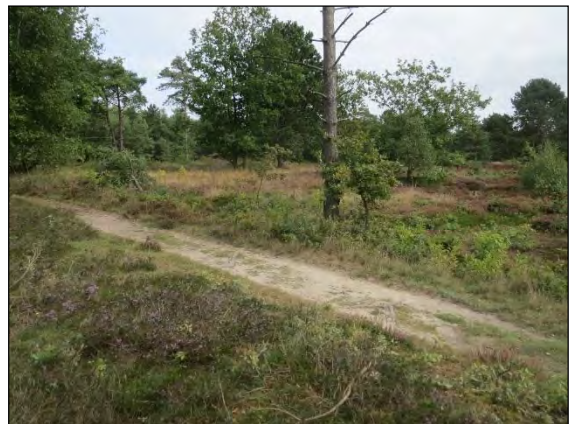
Abb. 12: Ehemaliger Schießplatz bei Sahlenburg/CUX.

Aphanisticus pusillus (Olivier, 1790) – Mit 3 mm Größe macht dieser unscheinbare „Furchenstirn-Prachtkäfer“ seinem Namen eigentlich nicht unbedingt Ehre. Er ist in Norddeutschland mehrfach gefunden worden, vor allem in den südöstlichen Bereichen des Niederelbegebietes und Schleswig-Holsteins, aktuell dort aus dem Kreis Hzt. Lauenburg bei Büchen/RZ (2009) und Götting/RZ (2014). Aus Mecklenburg ist er jedoch bisher noch nicht gemeldet, könnte aber durchaus vorhanden sein. Geeignete Lebensräume, wärmebegünstigte, trockene und sandigen Stellen mit verschiedenen Seggen, sind sicherlich vorhanden. 2014 gelang der Nachweis sogar ganz im Westen des Faunengebietes auf dem ehemaligen Schießplatz bei Sahlenburg/CUX.