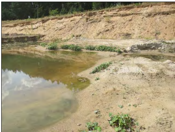
Abb. 1: Kiesgrube Neugüster/RZ - Lebensraum für Bembidion ruficolle

Schleswig-Holstein und das Niederelbegebiet werden seit langem traditionell durch die Mitglieder des Vereins für naturwissenschaftliche Heimatforschung zu Hamburg bearbeitet. Hier hat sich eine ganze Reihe von aktiven Koleoptereologen zusammengeschlossen mit dem Ziel, den Bereich um Hamburg, Schleswig-Holstein und das Niederelbegebiet faunistisch gut zu erfassen. Die Meldungen werden in der Datenbank des Vereins gespeichert. Sie geben einen guten Überblick über die Verbreitung und Ausbreitung, aber auch über das Verschwinden der einzelnen Käferarten in Norddeutschland. Sie sind abrufbar und für jedermann nutzbar unter www.entomologie.de/hamburg/karten . Alle Neufunde bzw. bemerkenswerte Arten werden im Publikationsorgan des Vereins, dem BOMBUS veröffentlicht. Leider geschieht das nicht so zeitnah wie gewünscht, insofern sind die hier vorgestellten Funde erst später im Detail dort nachzulesen. Die Reihenfolge der Auflistung folgt der gültigen Systematik.