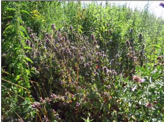
Abb. 24: Schwarznessel Ballota nigra

nigra und ist erst spät im Jahr an seiner Fraßpflanze aktiv. Aus Schleswig-Holstein liegen keine Funde vor, aus Mecklenburg nur sehr alte.