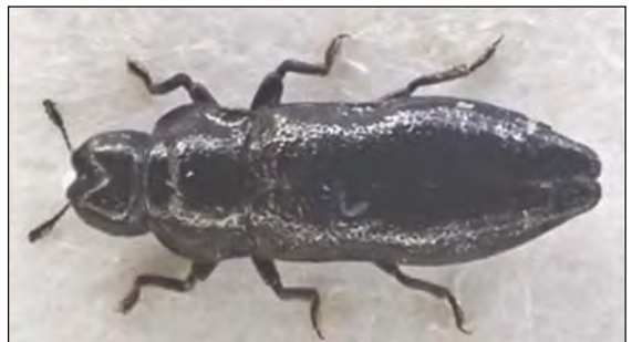
Abb. 13: Aphanisticus pusillus (Olivier, 1790) – Sahlenburg/CUX 9.9.2014 (Meybohm)