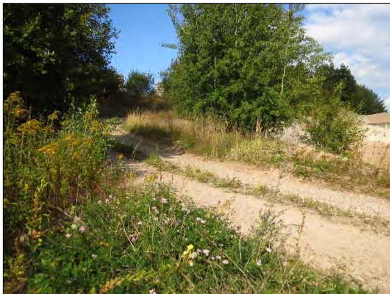
Abb. 14: Weg mit Trockenvegetation bei Vastorf/LG

Meligethes brachialis Erichson, 1845 – Ein Vertreter der großen und schwierigen Gattung Meligethes ist der knapp 2,5 mm große „Dickarmige Blütenstaub-Glanzkäfer“ (RL D 3). Dieser lebt monophag an der Kronenwicke ( Coronilla varia ). 2001 wurde er erstmals bei Dannenberg/DAN im nördlichen Niedersachsen in Norddeutschland festgestellt. Seitdem wurde die Art bei entsprechender Suche nach der Pflanze mehrfach gefunden, vor allem im weiteren Bereich der Elbtalau bis nach Hamburg hin. Scheinbar meidet sie den atlantischen Klimabereich, müsste allerdings im südlichen Mecklenburg durchaus aufzufinden sein.