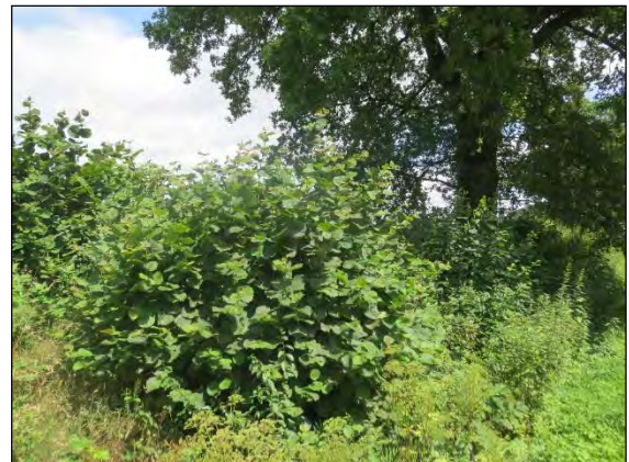
Abb. 22: Haselnußstrauch bei Rondeshagen/RZ

Altica brevicollis Foudras, 1861 – Dieser 4 mm große „Hasel-Erdfloh“ aus der Familie der Blattkäfer lebt monophag an Hasel. Er war in Norddeutschland immer als große Seltenheit bekannt, wurde in Schleswig-Holstein seit 1952 nur einmal in 1989 gefunden und im Niederelbegebiet erstmals 2011 gefunden. Aber in den letzten Jahren konnte die Art vermehrt nachgewiesen werden. Die Art ist mehr östlich verbreitet, Funde liegen vor aus dem Kreis Lüchow-Dannenberg sowie aus dem Kreis Hzgt. Lauenburg. Eine intensive Suche an Haselsträuchern dürfte weitere Nachweise ermöglichen.