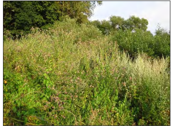
Abb. 37: Kratzdisteln bei Jasebeck/DAN - Fundort des Larinus sturnus

Larinus sturnus (Schaller, 1783) – Erst in 2014 konnte der 9 mm große Distelrüssler bei uns im Norden erstmalig nachgewiesen werden. Die Ausbreitung erfolgte in großer Dynamik, so dass wir am Ende des Jahres acht Fundpunkte aufzeigen konnten, von denen sechs im Niederelbegebiet und zwei in Schleswig-Holstein lagen. Die Art lebt oligophag an verschiedenen Distelarten, oftmals vergesellschaftet mit dem Distelkurzrüssler Rhinocyllus conicus . Eine ähnlich intensive Ausbreitung hatte in der Mitte der 1990er Jahre der Kratzdistelrüssler Larinus turbinatus , der heute mit Ausnahme des nördlichen Schleswig-Holsteins bei uns weit verbreitet ist.