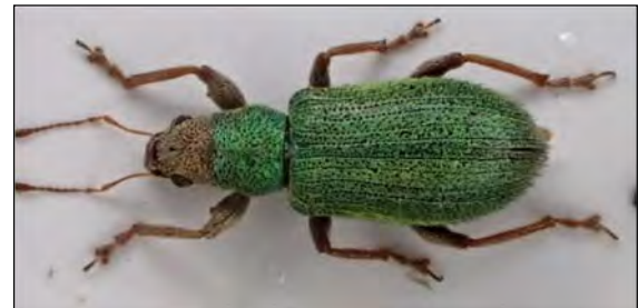
Abb. 33: Pachyrhinus lethierryi Desbrochers, 1875

Sie finden sich beide an diversen Zypressengewächsen in Wohngebieten mit Einzelhäusern und vor allem auf Friedhöfen und sind dann meist in Anzahl, teilweise auch gemeinsam an ihren Fraßpflanzen anzutreffen. Mittlerweile konnten bis zu acht Nachweise in Schleswig-Holstein erbracht werden, allerdings fehlen noch Funde aus dem Niederelbegebiet und Mecklenburg.