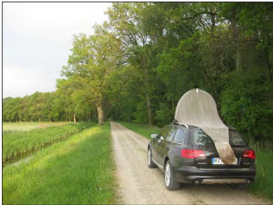
Abb. 41: Der Autokescher - ein unentbehrliches Hilfsmittel für den Faunisten

Stenopelmus rufinasus Gyllenhal, 1835 – Dieser nur 2 mm große Schwimffarnrüssler ist für unsere Fauna ein Neubürger. Erstmals nachgewiesen werden konnte er für Norddeutschland am 21.8.1990 an der Nordseeküste in St. Peter-Ording/NF im Spülsaum (Zi).