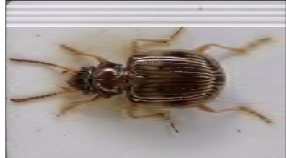
Abb. 2: Bembidion ruficolle (Panzer, 1797)

Bembidion ruficolle (PANZER, 1797) – Dieser nur drei mm große Laufkäfer ist seit alters her von den sandigen Ufern der Elbe zwischen Geesthacht/RZ und Lauenburg/RZ bekannt. Der letzte Fund datiert von dort aus dem Jahre 1949. Nach einer Auslöschungszeit von über 50 Jahren konnte die Art dann erstmals wieder am Oberelbufer in 2001 ebendort nachgewiesen werden. Die Art benötigt saubere und feinsandige Uferbereiche und ist mit Sicherheit durch die zwischenzeitliche Elbverschmutzung ausgelöscht worden. Als Ersatzbiotop hat die Art aber auch wasserhaltige neuangelegte Kiesgruben mit offenen Uferbereichen akzeptiert. So ist sie in den letzten Jahren mehrfach in Gruben in Elbnähe gefunden, aber auch durchaus weiter entfernt, so zum Beispiel bei Wittenborn/SE, in Zweedorf/LWL, in Valluhn/LWL und auch in Pinnow/PCH.