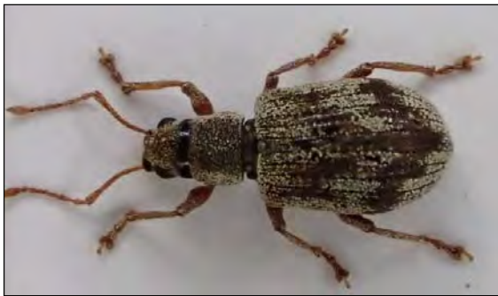
Abb. 36: Phyllobius sinuatus (Fabricius 1901) – 5.8.2014 Alandswerder bei Schnakenburg/DAN (Zi)

Larinus sturnus (Schaller, 1783) – Erst in 2014 konnte der 9 mm große Distelrüssler bei uns im Norden erstmalig nachgewiesen werden. Die Ausbreitung erfolgte in großer Dynamik, so dass wir am Ende des Jahres acht Fundpunkte aufzeigen konnten, von denen sechs im Niederelbegebiet und zwei in Schleswig-Holstein lagen. Die Art lebt oligophag an verschiedenen Distelarten, oftmals vergesellschaftet mit dem Distelkurzrüssler Rhinocyllus conicus . Eine ähnlich intensive Ausbreitung hatte in der Mitte der 1990er Jahre der Kratzdistelrüssler Larinus turbinatus , der heute mit Ausnahme des nördlichen Schleswig-Holsteins bei uns weit verbreitet ist.