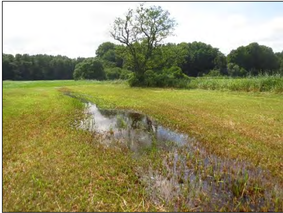
Abb. 3: Kanalwiesen bei Rondeshagen/RZ