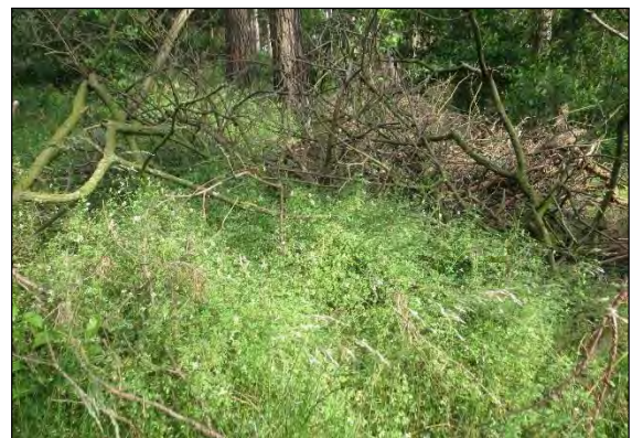
Abb. 39: Kiefernwald mit dem Rankenden Lerchensporn bei Kaarßen/LG im Amt Neuhaus

Sirocalodes mixtus (Mulsant & Rey, 1858) – Der 3 mm große Westliche Erdrauchrüssler lebt monophag an dem Rankenden Lerchensporn ( Ceratocarpus claviculata ), einer unscheinbaren Pflanze aus der Familie der Erdrauchgewächse, die am Boden von lichten Nadel- und Mischwäldern an wärmebegünstigten Stellen größere Polster bildet. Auch diese Art hat sich nach dem ersten Auffinden in 2004 bei uns im Norden rasch ausgebreitet. Heute ist sie vor allem in den südlichen Bereichen Schleswig-Holsteins und des Niederelbegebietes zahlreich nachgewiesen worden. Meldungen dieser eigentlich süd- und westeuropäisch verbreiteten Art aus Mecklenburg aber auch aus Brandenburg stehen noch aus.