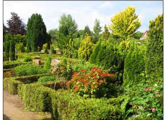
Abb. 32: Friedhof in Bargdeheide/OD

Pachyrhinus lethierryi Desbrochers, 1875 und Parascythopus exulans Hejerman & Magnano, 2000 – Diese beiden Grünrüssler sind seit dem Jahre 2010 bei uns in Norddeutschland bekannt.