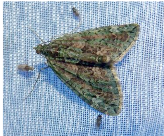
Abb. 7: Chloroclysta siterata (ca. 25mm) (Foto: M. Hippke).