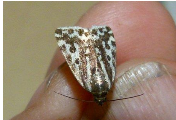
Abb. 6: Emmelia trabealis (20 mm) (Foto: M. Hippke).