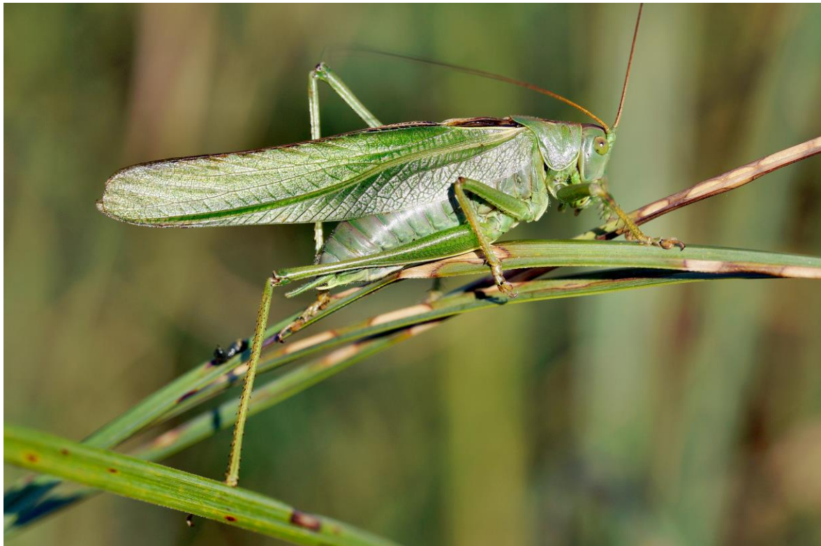
Abb. 9: Männchen des Grünen Heupferds Tettigonia viridissima.