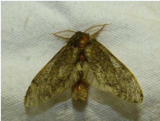
Abb. 4: Notodonta torva (ca. 40 mm).