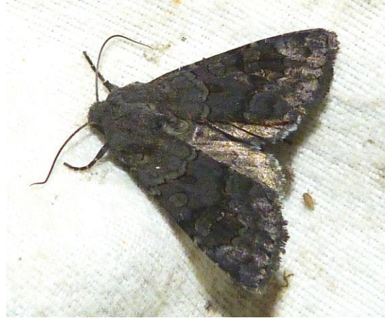
Abb. 5: Aporophyla nigra (ca. 40 mm) (Foto: M. Hippke).

Eine faunistisch interessante Art, die bisher nur in den Heidegebieten bei Lübtheen, Ludwigslust, Pinnow bei Schwerin und der Retzower Heide bei Plau am See am Licht nachgewiesen wurde.