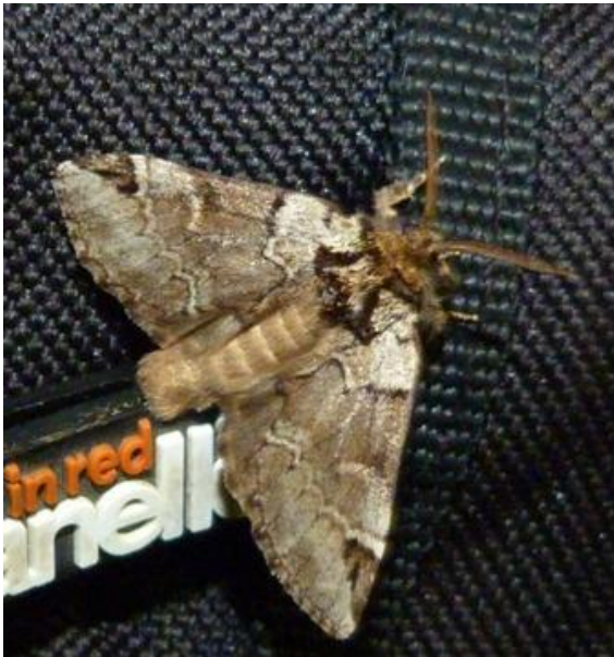
Abb. 3: Drymonia obliterata (ca. 40 mm).