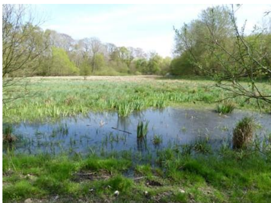
Abb. 8: Habitat der Wasserminzen-Blattzikade Eupteryx thoulessi.

Im Jahr 2014 wurden im Untersuchungsgebiet insgesamt 40 Zikadenarten nachgewiesen. Zur Artenzahl und -zusammensetzung können noch keine Aussagen getroffen werden; auf Grund der Biotopstrukturen sind deutlich mehr Zikadenarten zu erwarten. Als faunistisch interessant ist jedoch das Vorkommen der Wasserminzenblattzikade Eupteryx thoulessi zu bewerten. Die Art ist in der „Rote Liste Deutschlands“ (NICKEL et al. 2016) in die Kategorie 3 (gefährdet) eingeordnet. Weitere „Rote-Liste-Arten“ konnten vorerst nicht nachgewiesen werden.